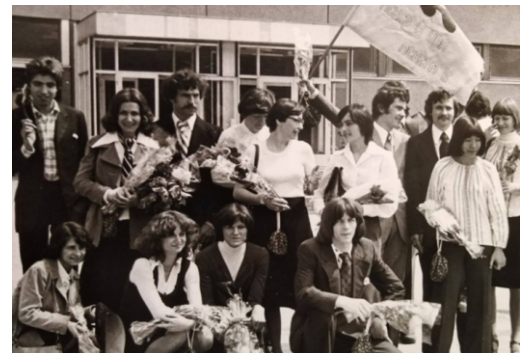
2. ábra. A Szegedi Tudományegyetemen 1978-ban biológus diplomát kiérdemelt csoport. Elöl, balról a harmadik Karikó Katalin.

a memóriasejtek éberségének fenntartása. Az mRNA vakcinának köszönhető, hogy az emberiség gyorsan, és hatékonyan küzdött le a Covid-19 világvilágjárványt, milliónyi, vagy akár milliárdnyi ember életét, egészségét őrizte meg. A Covid-19 járvány kapóra jött: alkalmas volt az mRNA vakcina hasznosságának bizonyítására. Ugyanis az mRNA vakcinatechnika már készen volt, és sikeresen alkalmazták rákos megbetegedések és néhány egyéb emberi nyomorúság gyógyítására, és bizonyosan nagy jövő áll előtte.