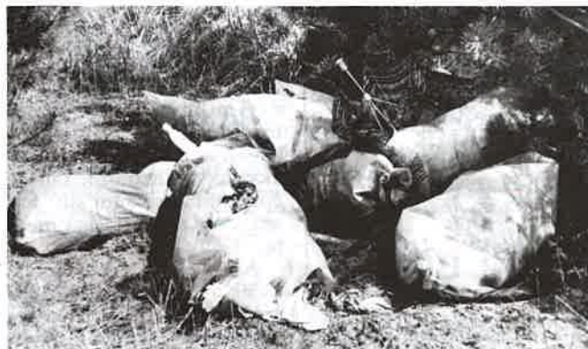
A jövőben sokba fog kerülni...