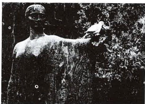
Nyár végi idill