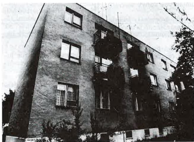
Tulajdonjogvita: ki nevet a végén?

Márpedig a jogszabály 83. paragrafusa kimondja: „Az 1993. december 31-ig bér-