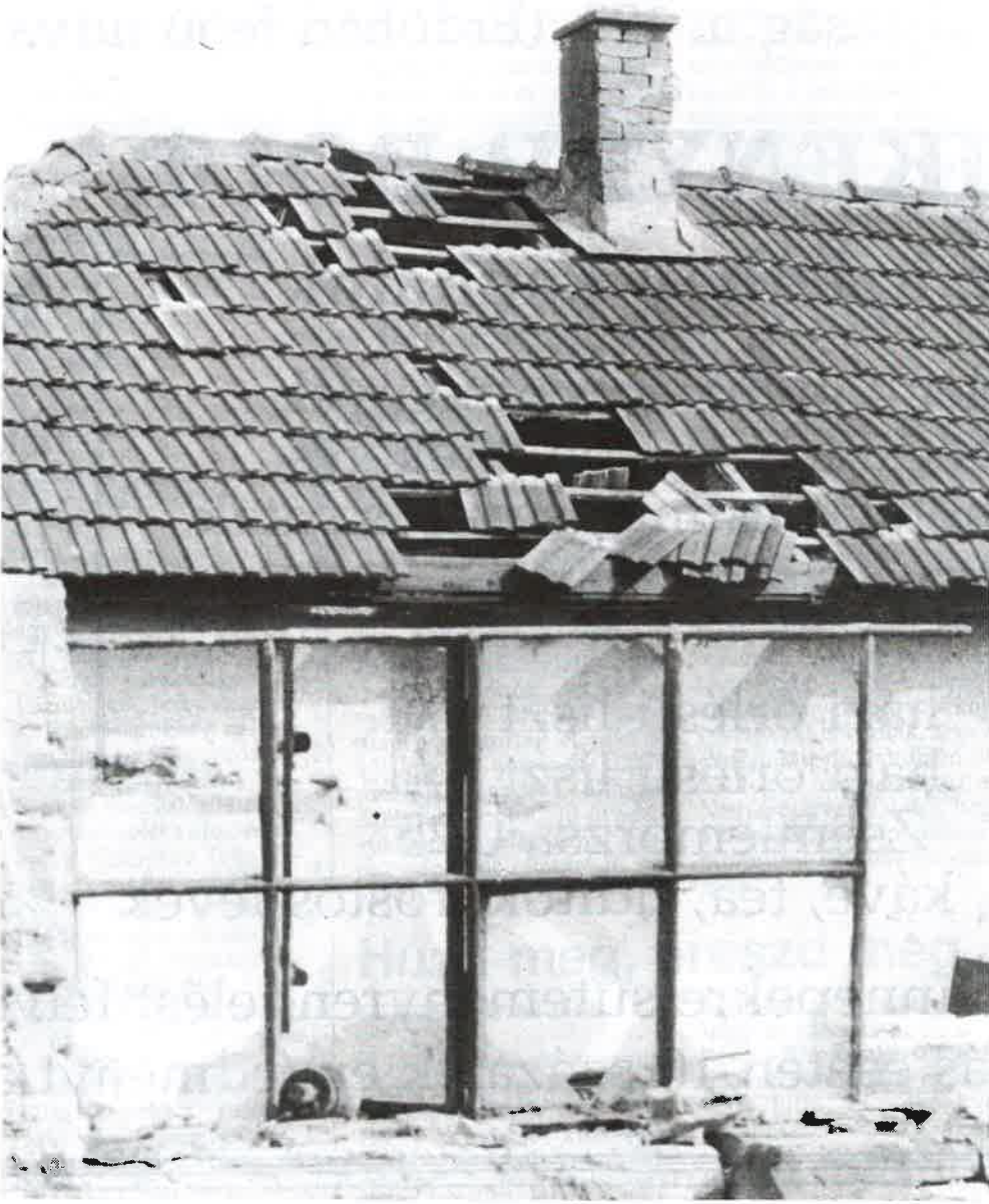
A szociális támogatás alapja a rászorultság