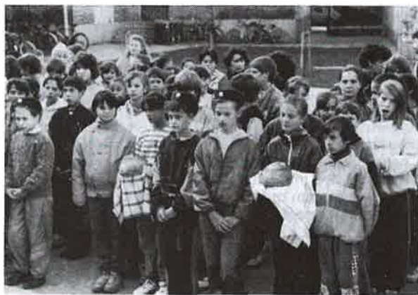
Feladatot kaptak a kenyérbe sütvé

Hagyományainkhoz híven október 15-én, az álmosdi csata évfordulóján Bocskai-napot tartottunk. Dél előtt játékos bajviadalon vehetett részt iskolánk apraja-nagyja. Összemérhették az osztályok történelmi tudásukat, ügyességüket, erősségüket, gyorsaságukat. Horgászhattak, vadászhattak, rajzolhattak, játékos labirintusban játszhattak kedvük szerint. Továbbá beöltöztek a gyerekek korhű jelmezekbe, készítettek vármakettet, alapító okiratot, tökfáragást, fáklyákat. A délelőtti gyorsan elrepült.