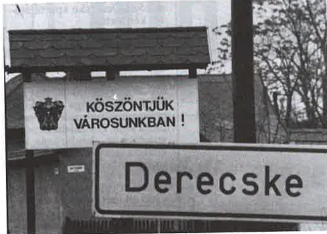
Városunk önkormányzata ezekben a napokban tárgyalja a helyi lakásrendeletet

Hogyan értesülnek a bérlők a lakbérközlésről? A lakástörvény és az önkormányzati törvény előírja, hogy már a rendeletalkotás előtt tájékoztatni kell a tervezetről a lakásbérlők érdekképviseletét. Az általános gyakorlat az, hogy a bérbeadási feladattal megbízott szervezet a bérlőknek tájékoztatót küld: az úgynevezett lakbérközlést. Ez tartalmazza a lakbérszámítás módját és végeredményét. Általános tapasztalat azonban az, hogy a lakbérközlések ellentmondásosak és hiányosak. – Mit tehet a