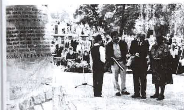
A szalag átvágása alighanem mindhármuknak sokáig emlékeztetés marad