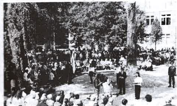
Emlékpark, 1994. augusztus 21. Emlékezett a város apja-nagyja