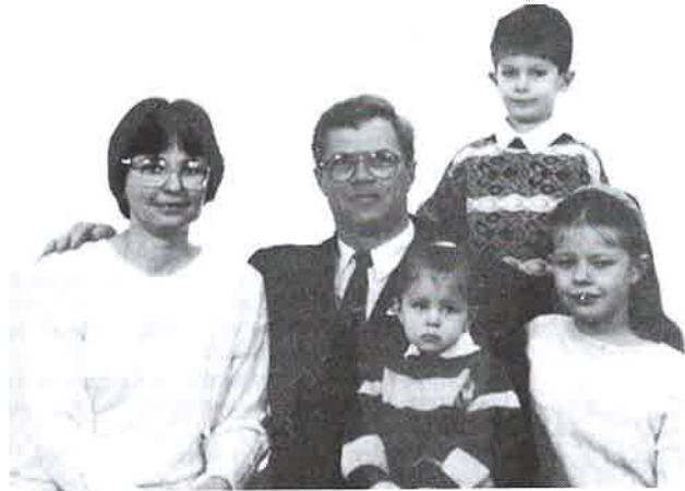
A Vágó család

– A lelképásztort Istentől kapott talentumot, képességet, melyet egy gyülekezetnek át kell adnia. Krisztus gazdagsága sokkal több, mint ami egy emberben megjelenni képes. Eppen ezért az egészséges gyülekezeti fejlődés megköveteli az időnkénti, 8–12 évenkénti lelképásztortváltást. Korábbi években is voltak meghívásaink. Eddig úgy gondoltuk, az Úr itt akar látni bennünket a derecskei gyülekezetben. Megkezdett emberi kapcsolataink voltak, melyeket nem akartunk megszakítani. Most sem gyarló emberi dolgokért, magasabb fizetésért költözünk máshová. Úgy érezzük, elérkezett a távozás ideje. Miként biztos vagyok abban, hogy az Úr vezetésével jöttünk ide tíz és fél évvel ezelőtt, akként hiszem, hogy most is ő vezet bennünket. Van egy emberi oka is annak, hogy most is ő nem egy-két esztendő múlva megyünk el. Ez a lakás, melyben laktunk, három éve épült. Nagyon szép, tágas, csak a színtelenség miatt 31 lépcső van benne. A feleségem lábait nagyon megviselte a sok lépcsőzés.