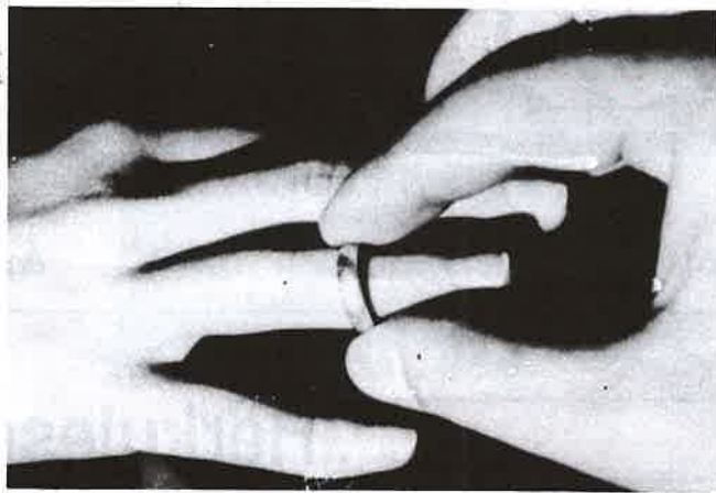
Évről évre kevesebben húznak jegygyurut az ujjukra