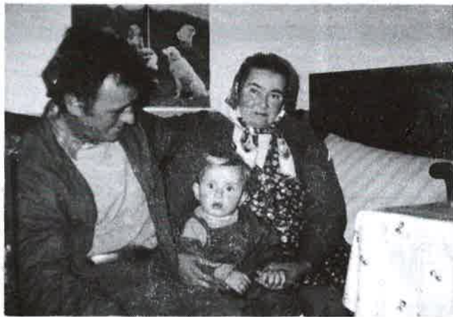
A legkisebb is fiúnak sikerült

– Munkahelyem nem volt soha, háztartásbeli voltam. A férjem a Vörös Csillag Tsz-ben növényápolóként dolgo-