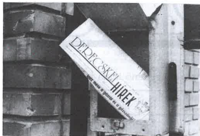
Megjelenés: minden hónap első péntekén

KÉT és fél szobás, összkomfortos lakás eladó. Derecske, Köztársaság u. 88. II. emelet. Érdeklődni lehet: 06 (30) 287-458-as telefonon.