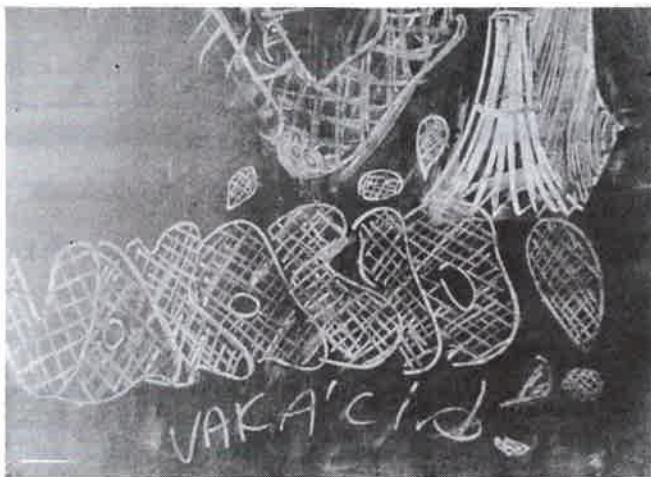
A varázsszó szeptemberig a táblán marad...