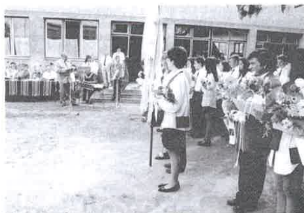
Ballag már a vén diák ... ... a József Attila Általános Iskolában