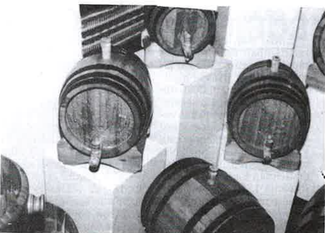
A kiállított munkák egy csoportja