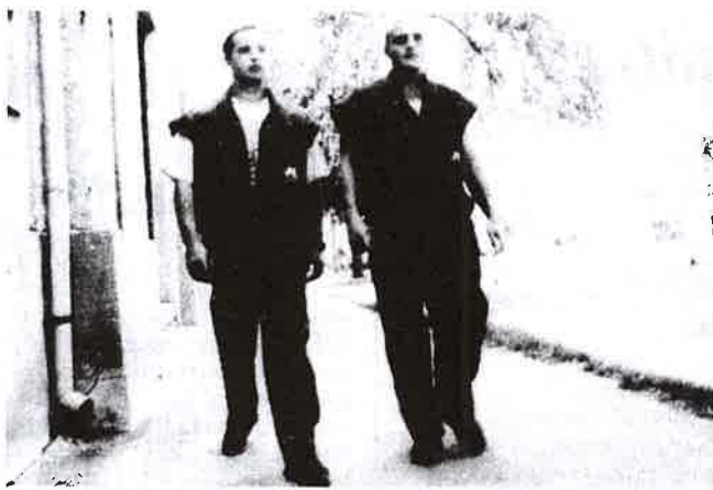
Éjjel-nappal járják a derecskei utcákat, tereket

Tárva nyitva áll a következő ház kapuja. Szinte tálcán kínálja a lehetőséget a betörőknek, tolvajoknak. Kerítéshez támasztott, őrzetle-