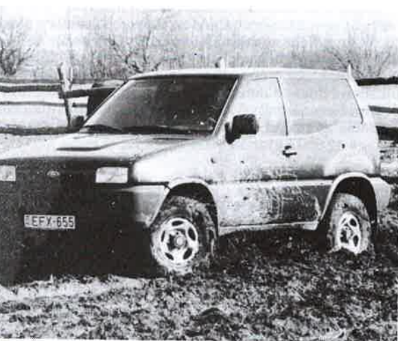
A Hajdú-bihari Naplóban a helyi adókról egy tájékoztató táblázat jelent meg. Benne Derecskére vonatkozóan tévesen 400 forintban tüntették fel a gépjárműadó tételét. Helyesen az adó mértéke: az adóalap minden megkezdett 100 kilogrammja után 500 forint.

A módosításokról szóló rendeletek 1997. január 1-jén léptek hatályba, rendelkezéseit a hatályba lépést követően keletkezett árbevételek utáni adómegállapítások során kell először alkalmazni.