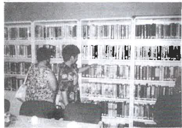
Egy holland pszichiátriai intézet könyvtára