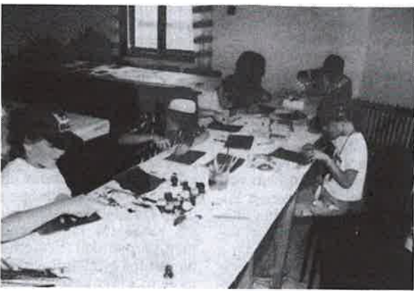
A városi művelődési központ által megszervezett táborok idén nyáron is jó néhány derecskei gyereknek kínálnak hasznos elfoglaltságot. A Derecskei Hírek fotója ezúttal a képzőművészeti tábor résztvevőit látogatta meg, akik éppen a linómetszés fortélyait ismerték meg.