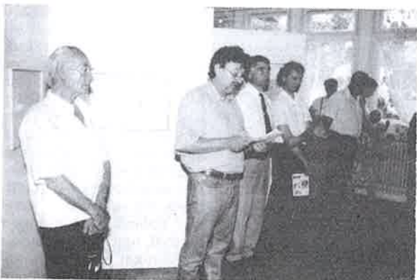
A megnyitó ünnepélyes pillanatai

A tíznapos alkotótábor – amelyet az önkormányzat szándékai szerint ezután minden év júniusában megrendeznek Derecskén – szakmai fórum is, amelynek keretében a hazai grafika helyzetéről, szerepéről, az új technikai eljárásokról cserélnek véleményt az alkotók. A derecskei grafikai művésztelepen készülő alkotások egy része a debreceni Déry Múzeum kortárs anyagát fogja gyarapítani.