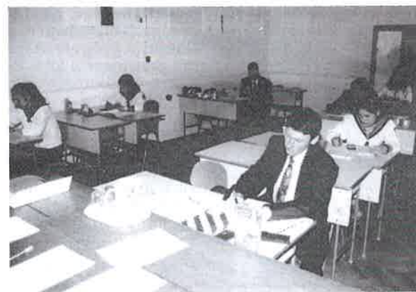
Próbátétel matematikából az I. Rákóczi György Gimnáziumban