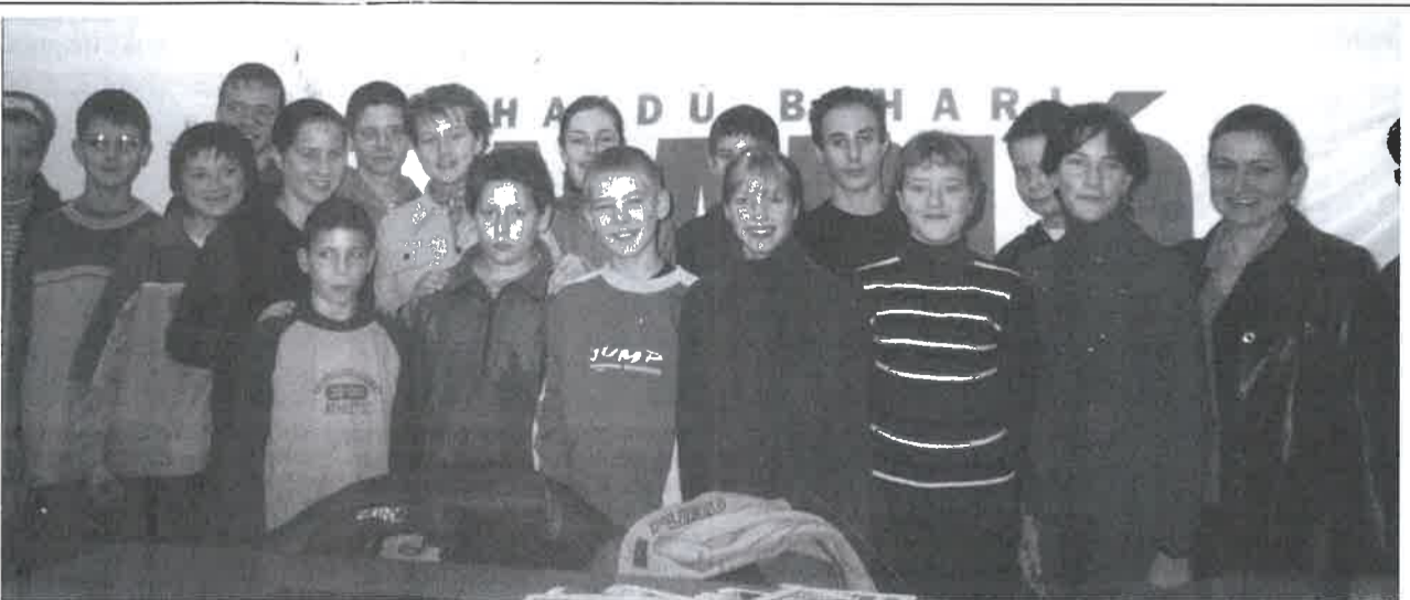
A Hajdú-bihari Napló szerkesztősége rendszeresen fogad általános iskolai osztályokat, hogy megismertesse a gyerekeket az újságkészítés folyamatát. A közelmúltban a derecskei Bocskai István Általános és Művészeti Iskola

néhány növendéke tette tiszteletét a megyei lap szerkesztőségében, és csak remélni merjük, hogy új ismeretekkel no és élményekkel felvértezve tértek haza a kirándulásról