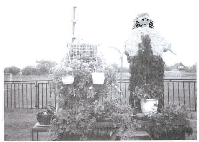
A Városgazdálkodási Kht. feldíszített traktora