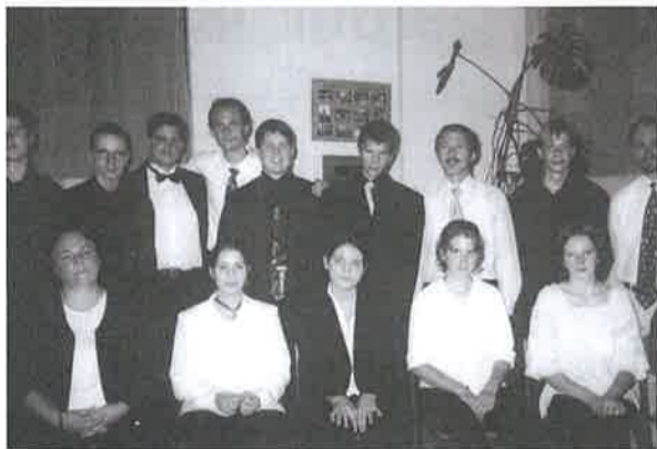
A zenei világnap alkalmából a Bocskai István Általános és Művészeti Iskolában megrendezett koncerten egykori tanítványok léptek fel. Képünkön tanáraikkal együtt a hangverseny után.