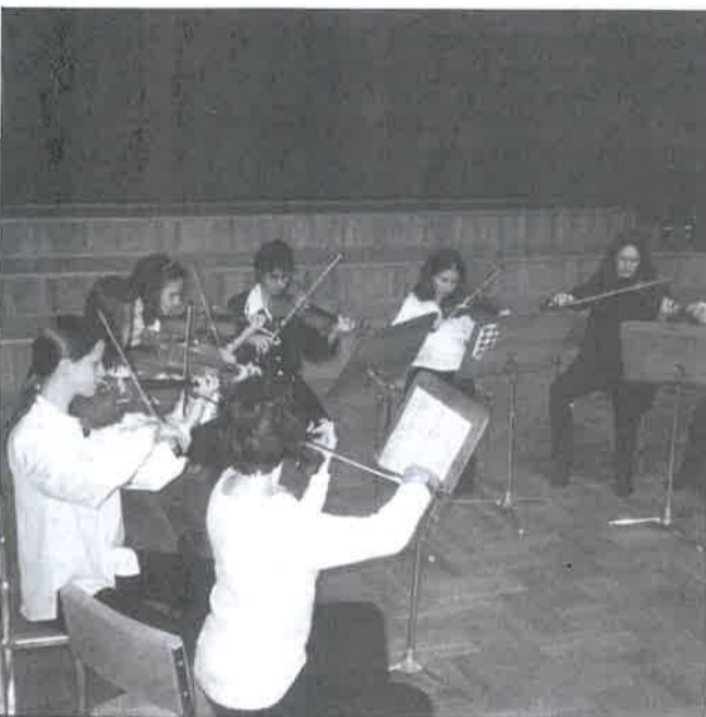
A Bocskai-iskola vonószeneke szereplés közben