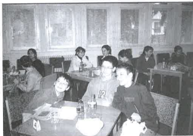
A győztes általános iskolai csapat