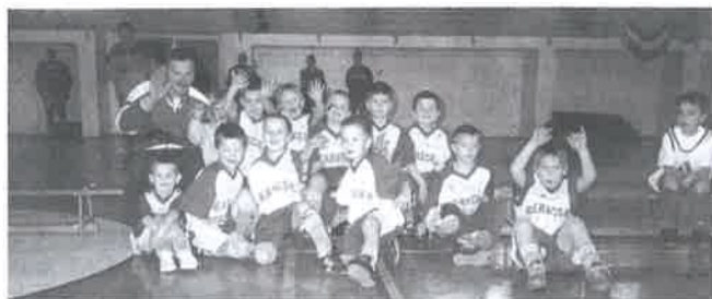
Derecskei focipalánták öröme

Ezen a szombat délelőttön rengeteg gyerek érezhette jól magát, és ezt ezen a napon a labdarúgásnak köszönheték. Jó volt még látni azt, hogy a felnőttek, a szülők, nagymamák és nagypapák, kis- és nagytestvérek együtt örültek a főszereplőkkel. Nevezetesen a '96-'97-es születésű gyerekekkel. A kis focistapalánták körmérkőzéses formában 10 perces meccse-