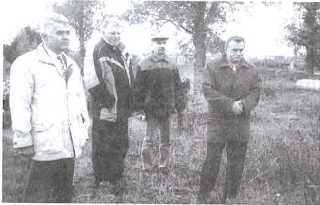
Az illetékesek a helyszínen tájékoztak a történetkről

Ennek értelmében folyamatosan 4-5 közhasznú munkás dolgozott a temetőben: motoros fűrésszel, baltával vágták az embermagasságot is meghaladó fánövéseket, elburjánzott cserjéket, az elvadult őserdőt. Mivel járható út