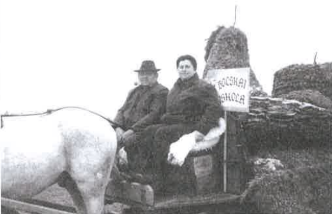
Gyümölcstál kompozíció a Bocskaiából