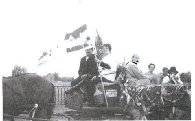
A Dermák szüreti kocsija