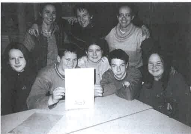
Büszkék a Kodály-műveltségi vetélkedőn elért eredményükre a derecskei diákok és tanáraik

lyáról kellett a labdát a kapuba juttatni. Ezt egy a Komádi csapatában játszó gyermek nyerte. Ezután ismét folytatható a „móka.” Lassan vége lett a meccseknek kialakult a végeredmény is. De még jött egy nagy meglepetés a fiatalok számára. Maga a Mikulás látogatott el a viadal végére a lurkókhoz, akit énekszóval is köszönthettek a bátrabb gyerekek. A télapó ajándékai után átvehették az érmeiket is. A díjátadásra a „mi vagyunk a bajnokok” című öröklágerre vonultak be, amit eredménytől függetlenül az összes kisserác elmondhatott magáról. Aranyat kapott Komádi, ezüstöt Derecske egyik csapata és Hajdúszoboszló, a bronzot pedig a konyáriak és Derecske másik alakulata vehette át.