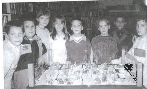
Az állatok világnapja alkalmából az óvodások agyából és gyurmából készített állatfiguráiból nyílt kiállítás a városi könyvtárban október második hetében.

II. Gyermekek és Ifjúsági Önkormányzati Választások