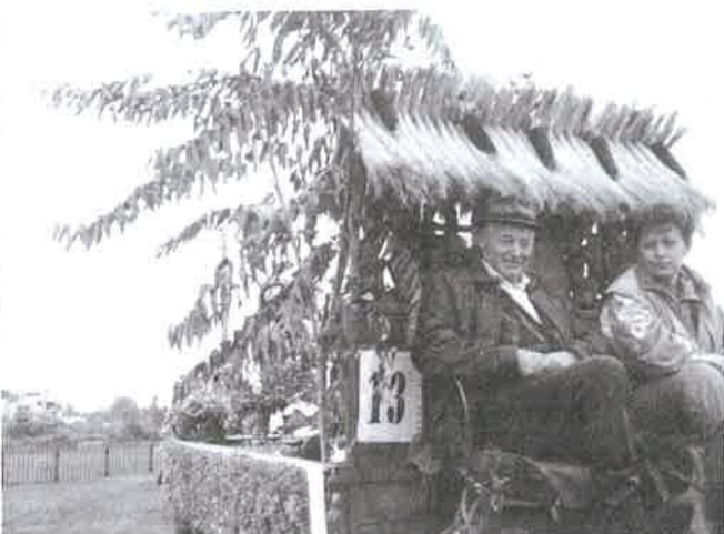
Az óvoda kocsija