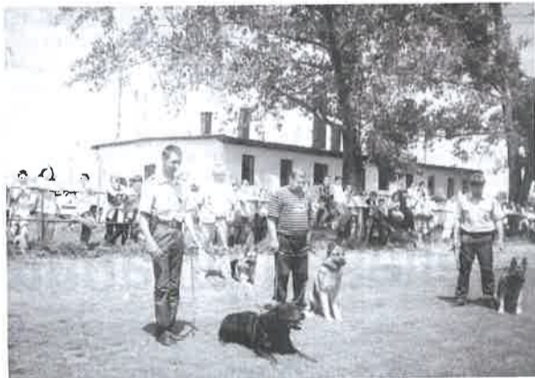
Jó hangulatban nem volt hiány

Az osztályoknak a szülői munkaközösség vezetésével, főleg az anyukák bevonásával – elvértve apukák „kuktálkodásával” – főztek az ebédet a felállított bográcsokban. A vezető étel a paprikás krumppli kolbásszal, illetve a slambuc volt. A diákönkormányzat munkáját segítette és anyagilag támogatta a városi önkormányzat ifjúsági és sportbizottsága, valamint a Derecske és Térsége Közművelődési Kht.