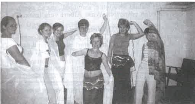
A felvétel magáért beszél

– Alkatilag legideálisabbak azok a hölgyek, akiknél van némi súlyfölség, de természetesen ez nem feltétel. Korosztálytól függetlenül, mindenkit szeretettel várunk. Bármilyen alakú emberből válhat kitűnő hastáncos. Akinek jó érzéke van a tánchoz, az élvezettel műveli, és sok esetben improvizál is. A hastáncban erre rengeteg lehetőség nyílik.