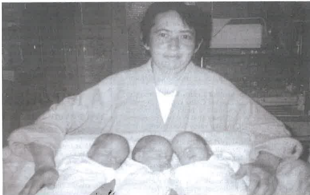
Szépek, egészségesek s milyen egyformák a hármas ikrek