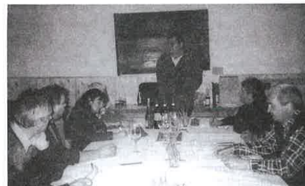
A legutóbbi foglalkozáson a villányi borokkal ismerkedtek a tagok

terjesztésével. Télen tízhetes kurzusokat szerveznek, aminek keretében egy-egy hazai borvidékkel ismerkednek meg videó-film vetítés, szóbeli előadás keretében és a borok gyakorlati bemutatójával. Nyáron pedig személyesen keresnek fel egy-egy borvidéket. Tavaly nyáron például jártak Hajóson és Tokajban. A klubtagok szintén tavaly részt vettek a debreceni borkarnevalon is.