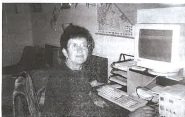
Nyíró Gizella: kihívásnak tekintem ezt a munkát

– A képviselő úr hétfőtől csütörtökig Brüsszelben vagy Strasbourghban tartózkodik az Európa Parlament bizottsági ülésein. Három bizottságnak a tagja: regionális-fejlesztési, költségvetési, költségvetési-ellenőrzési bizottság. A hét hátralévő részében pedig itthoni programjain közösen veszünk részt. Pálfi István a Tiszántúlt, illetve a határon átvágó kapcsolatok ápolása jegyében Kárpátalját és Pátiumot képviseli Brüsszelben. Ebből következik, hogy a régióban szervezett programjaira elkísérem őt.