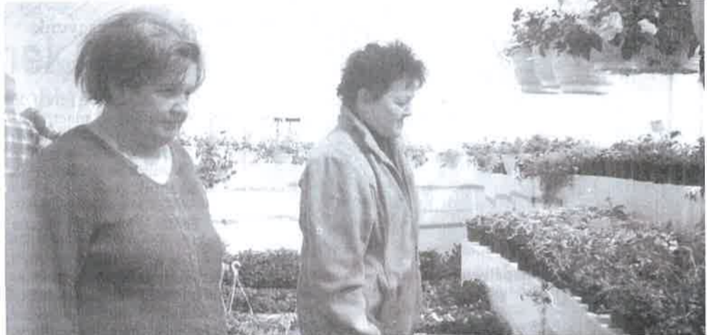
Üde színfolt a Kite kertészeti telepén. Ki a virágot szereti...

- Újratelepítettük a füves területek egy részét ősszel és tavasszal. Erre a gyomtalanítás miatt volt szükség, valamint így mostmár a sze-