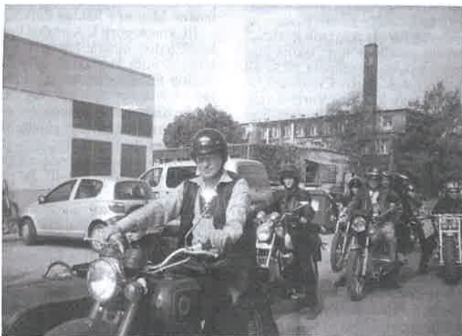
Veterán motorosok útban a mulatság helyszínére, a sárosói pihenőpark felé