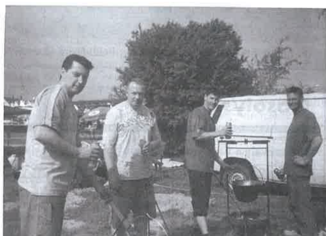
Egy jókedvű baráti társaság a majálison. Sör és bogrács... mi kell még?