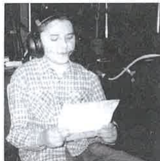
Imike is szerepelt a műsorban

Ennyi segítő szándék, összefogás láttán talán nem tolakodó a kérdés, hogy áll az alapítvány anyagi helyzete, milyen forrásokra számíthatnak még a szülők. „Új szórólapokat készítettünk és itt megint csak köszönetet szeretnék mondani a szerkesztésért, nyomtatásért a teleházaknak, a polgármesteri hivatalnak, a Derecskei Hírek nyomdájának és Venyige Lajos tépepe lakosnak - válaszolta Er-