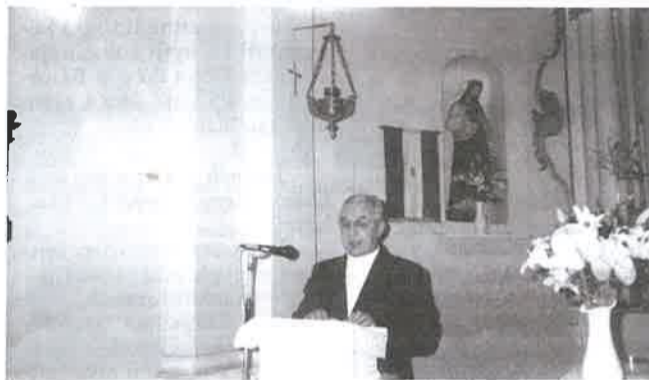
Emlékező pillanatok voltak

Egy helyi hívó felajánlotta, hogy vásárol egy új orgonát. Idén márciusban ez meg-