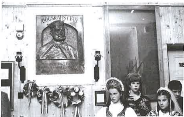
A koszorúzás meghitt pillanatai