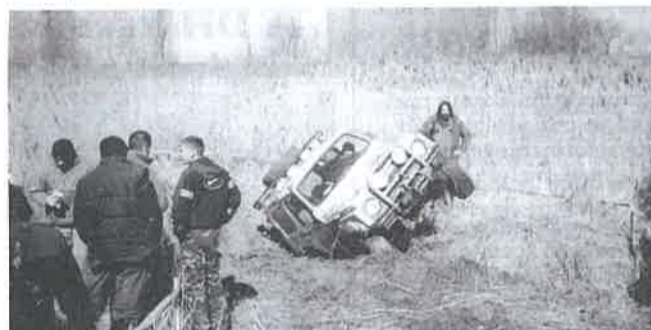
Amint a felvételen is látszik, nem volt éppen egy könnyű verseny

Szombat délelőtt állt rajthoz a sárdagonyozástól alig felismerhető mintegy ötven terepjáró, hogy megtegye a hatvan kilométeres, igen ke-