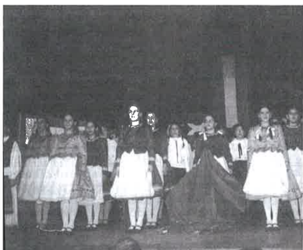
Pillanatkép az ünnepi műsorból