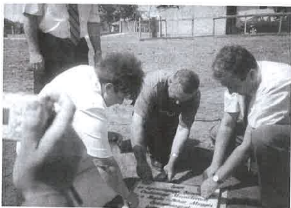
Az alapkövetétel ünnepélyes pillanatai