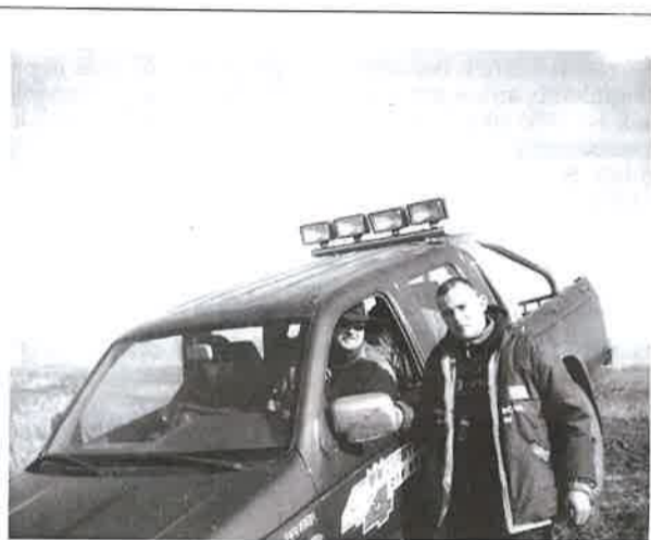
A fiúk sikert sikerre halmoznak