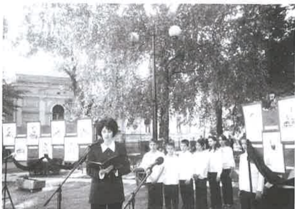
Az ünnepi műsor szereplői