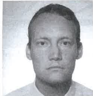
Az új állatorvosunk

– Mielőtt Derecskére kerültem, a háztáji állatok egészségügyi ellátása szerepelt főbb feladataim között. Jelenleg hétköznapiakon 6.30–7.00 óra között rendelek, (Derecske, Szováti út 41. szám alatt) délelőttönként pedig a Kasz-Coop Kft. szarvasmarha- és sertéstelepeken a magas színvonalú állattartás állategészségügyi ellátásával foglalkozom. Ez számomra az eddigiékhöz képest, új feladat.