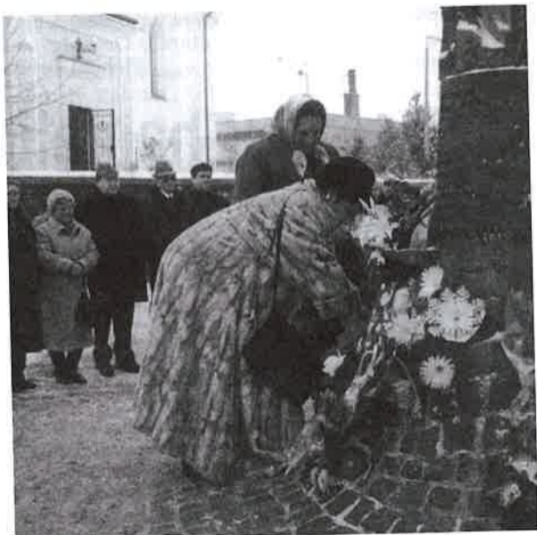
A Templomkertben álló második világháborús emlékműnél az önkormányzat az egyház, a pártok és hozzártartozók elhelyezték a hála koszorúit és virágait.