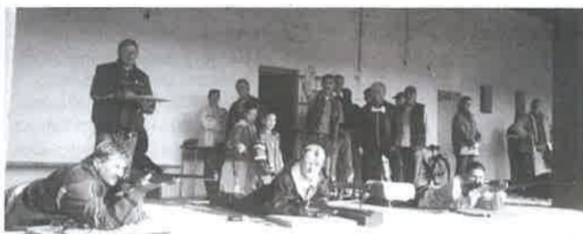
Az Alter Center csapata az itthoni versenyen

Jövőre új serleget kell csináltatni, ugyanis az október 2-án – ötven versenyző részvételével – lezajlott, Derecske Város Lövész Kupájáért kiírt kispuskás verseny a házizagdzák győzelmével zárult, így a harmadik alkalommal elnyert vándorserleg végleg a győzteseké maradt.