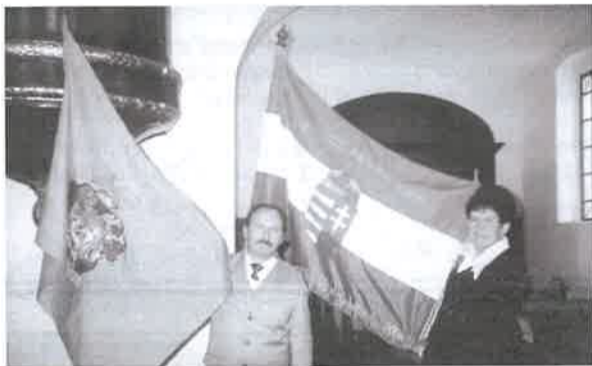
A zászlóavatás emelkedett pillanatai