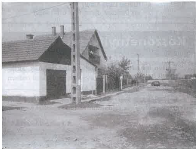
A Kandia utca

2005-ben 14, 2006-ban 12 millió Ft-ot. Információim szerint az Országos Cigány Kisebbségi Önkormányzat pályázatot írt ki, amelyben olyan beruházásokat támogatnak, amelyre a Területfejlesztési Tanácstól korábban már támogatást nyertek. Ha ez a pályázat sikeres lesz, akkor az utépítéshez szükséges önerőt ebből a pályázati pénzből biztosítaná az önkormányzat. Egyébként meg örülünk annak, hogy a legmagasabb beruházási összegű utcára nyertük meg a pályázatot, a többi utca bekezdési költsége jóval ez alatti összeget tesz ki.