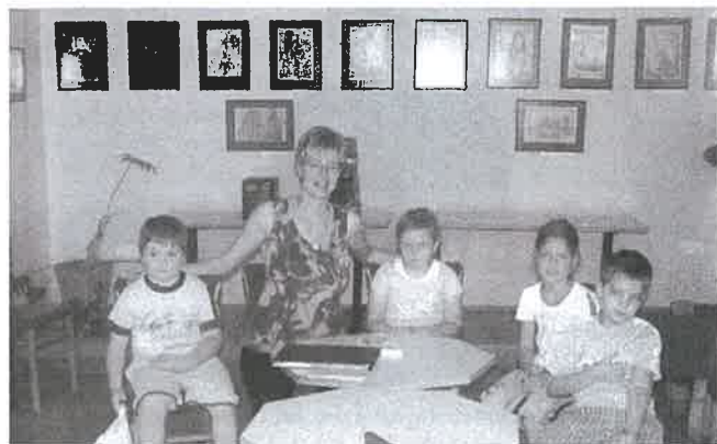
Nem lehet elég korán kezdeni?