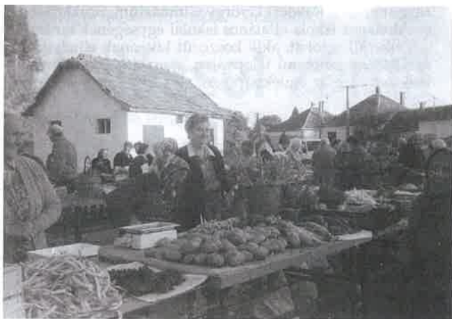
Minden, mi szem-szájnak ingere...

– Hát kedves, muszáj a nyugdíj mellé tenni még egy keveset, meg ha már megtermett, ne menjen pocskiba. Így legalább hasznosnak érzem még magam, ha tesz-veszek egy kicsit a ház körül a kis kertben. Kell egy