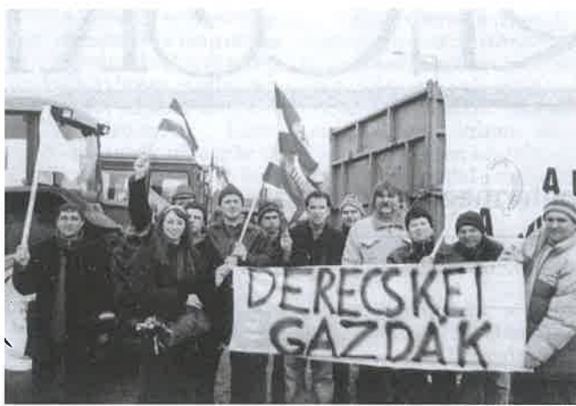
Derecskei gazdák a Felvonulási téren február 26-án

Az alkalmi színpadul szolgáló traktor platóján Angyán József professzor drámai hangú beszédében ecsetelte a magyar mezőgazdaság végveszélybe került állapotát, s sürgős intézkedést követelt a vidék megmaradása érdekében, ha nem akarjuk, hogy dél-amerikai típusú latifundiumok – nagybirtokok – jöj-