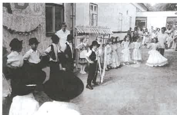
A derecskei óvodában