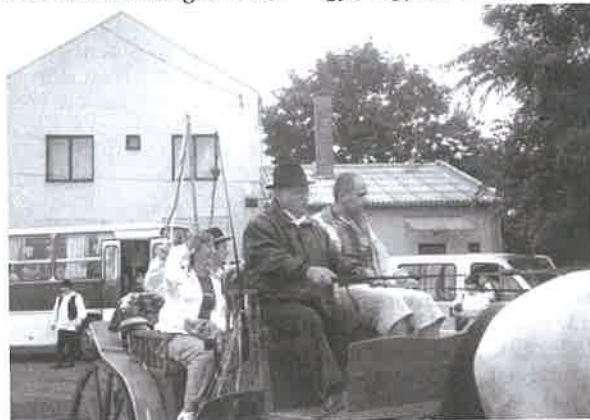
Megadták a módját...