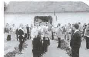
A tépei iskolában