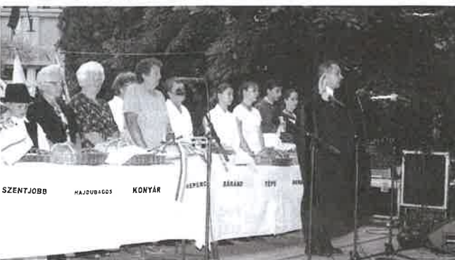
Megszentelik az új kenyeret