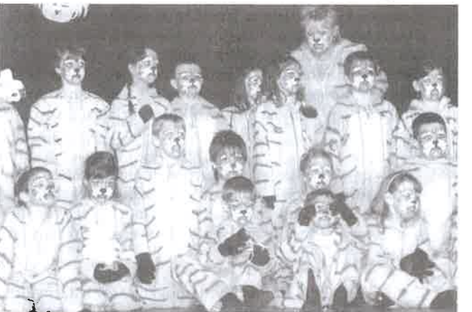
Mire mindenkit kifestettünk, egész belejöttünk