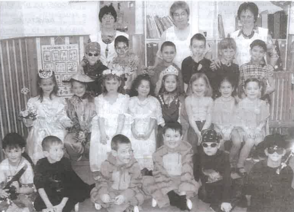
Aranyosok vagyunk, szépek vagyunk, és persze nagycsoportosok vagyunk