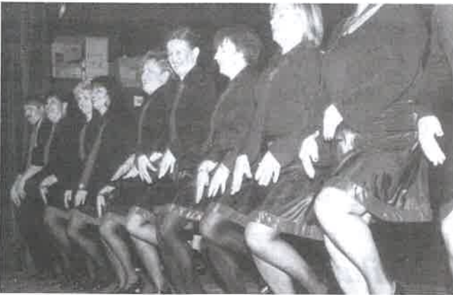
A bocskai szülők is kitétek magukért; ír táncot roptak