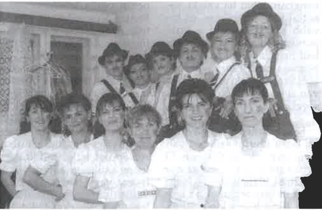
Szülői produkció a József Attila alapítványi bálján