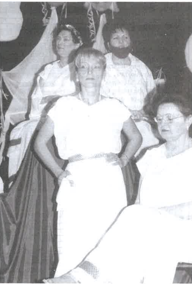
Görög istennők a Bocskaiából