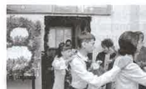
A tépei iskolában