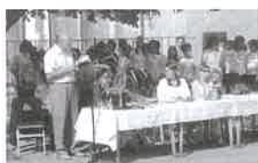
Az I. Rákócziiban