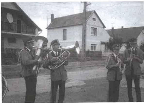
Székelykeresztúri fúvósok a Sátorkertben