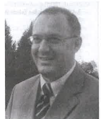
Pálfi István európai néppárti képviselő

– A hozzáférhető források nagysága és belső szerkezete egyelőre még nem tisztázott. A vita erről is szól, meg arról is, hogyan tudnánk a leghatékonyabban hozzájutni ezekhez a forrásokhoz. Egyesek szigorítanak a feltevérendszeren az új csatlakozó országok nagy számára hivatkozva. Óriási verseny folyik a pénzekért. Ez azért hátrányos az újonnan belé-