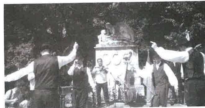
Fontos a hagyományok ápolása