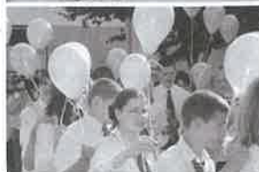
Az I. Rákócziiban