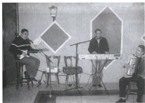
Szeretnék, ha felfigyelnének rájuk