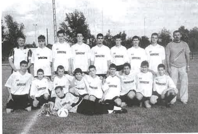
A sikeres alakulat