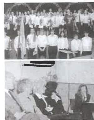
A Bocskai iskolában