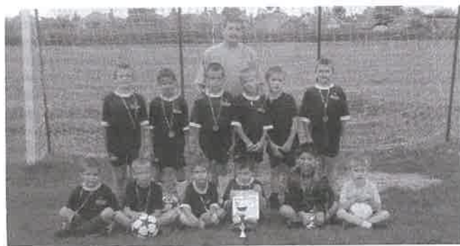
Már a kicsik is nagyon lelkesek