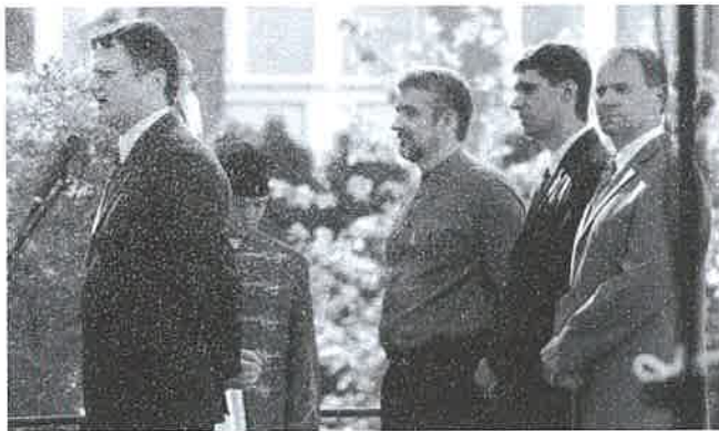
A szónokok a nehéz helyzet ellenére is bíznak a jövőben

– Vissza kell fordítani ezt a fo-lyamatot – szögezte le, hozzátéve: újra lesz Derecskén bölcsőde és visszaállítják a nagy hagyományú szakképzést is. Két nagyváros – Debrecen és Nagyvárád – között fekszik Derecske, ami magában