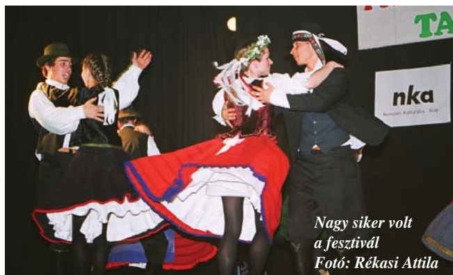
Nagy siker volt a fesztivál