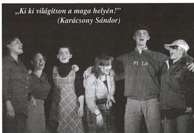
Nagy élmény volt a „padkaporos” bál.

S bizony, aki tesz, csak abban a hiszemben tud önzetlenül szolgálni, ha tudja, hogy lesz, aki befogad, elfogad, ott lesz. Mint ezúttal is. A szülők örömmel figyelték sokszor csintalan csemetéjük önfeledt alkotó játékát, táncát. A táncosok meglepetés műsora, a családi vetélkedő izgalmait, a helyben főtt ételek íze, a feledésre ítélt derecskei remek, az otelló kóstolgtatása