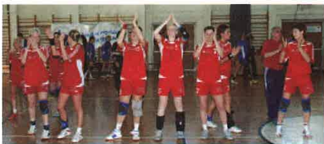
A Tajtavill-Derecske képes lehet arra, hogy megkapaszkodjon az élvonalban