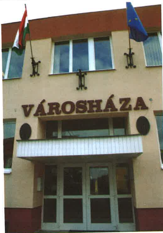
A derecskei városházán nem kérdeztek meg senkit

– Most az a dolgunk, hogy egy olyan együttműködést ösztönözzünk, amely segíti, hogy tovább formálódhat Derecske és vonzáskörzete, és Létavértesi és vonzáskörzete. A