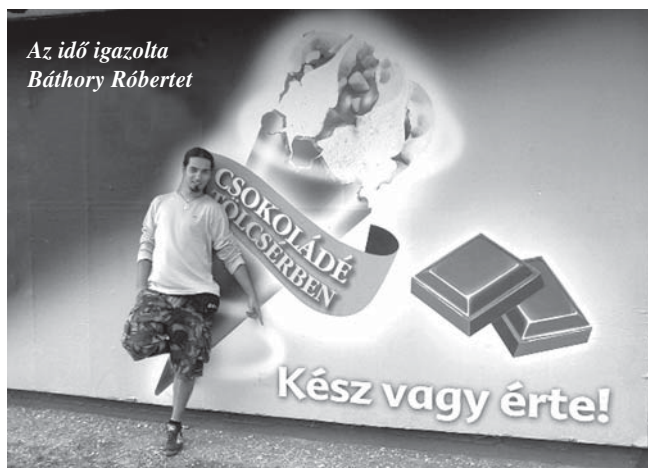
Az idő igazolta Báthory Róbertet