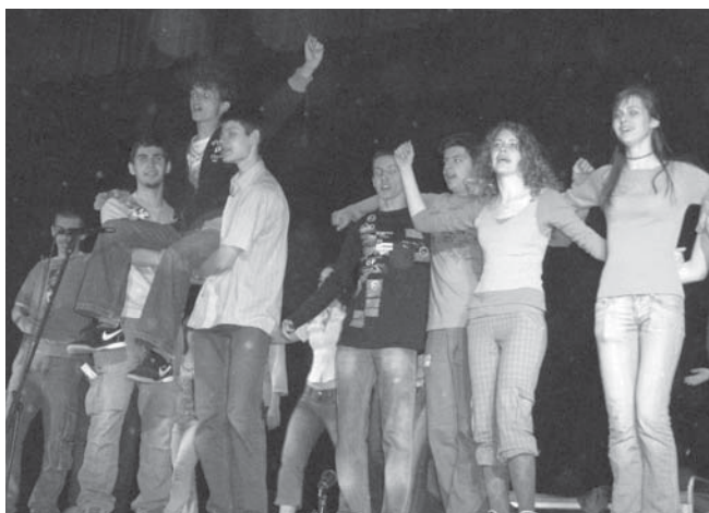
A rendezvény is bizonyította, hogy a diákszínjátszás egyre népszerűbb