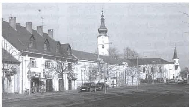
A tisztaságra mindenkinek vigyázni kell

folyóirat, katalógus, füzet, könyv, írógéppapír.