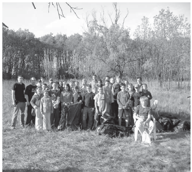
A résztvevők a munka végeztével örömmel álltak össze egy „csapatképhez”