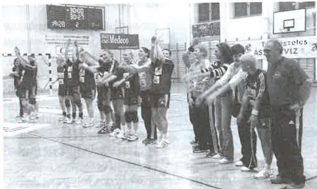
A derecskei csapat örömmámorban úszott a meccs után