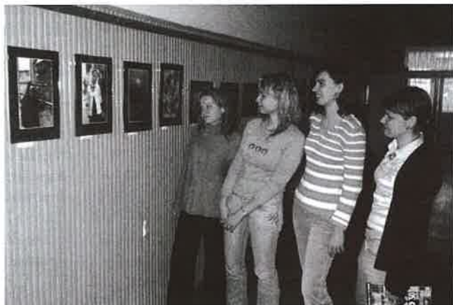
A gimnáziumban havonta megújuló fotókiállítást tekinthetnek meg az érdeklődők