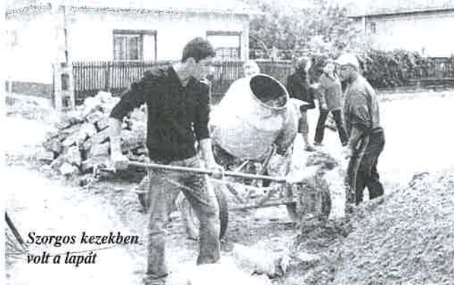
Szorgos kezekben volt a lapát