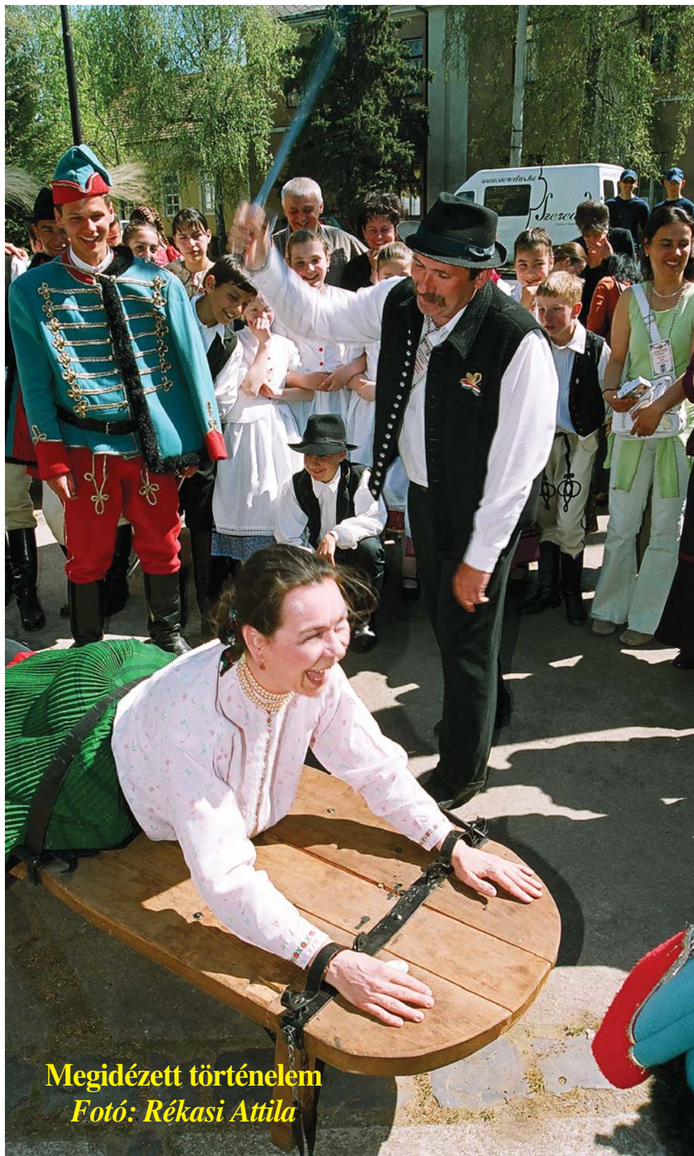
Megidézett történelem