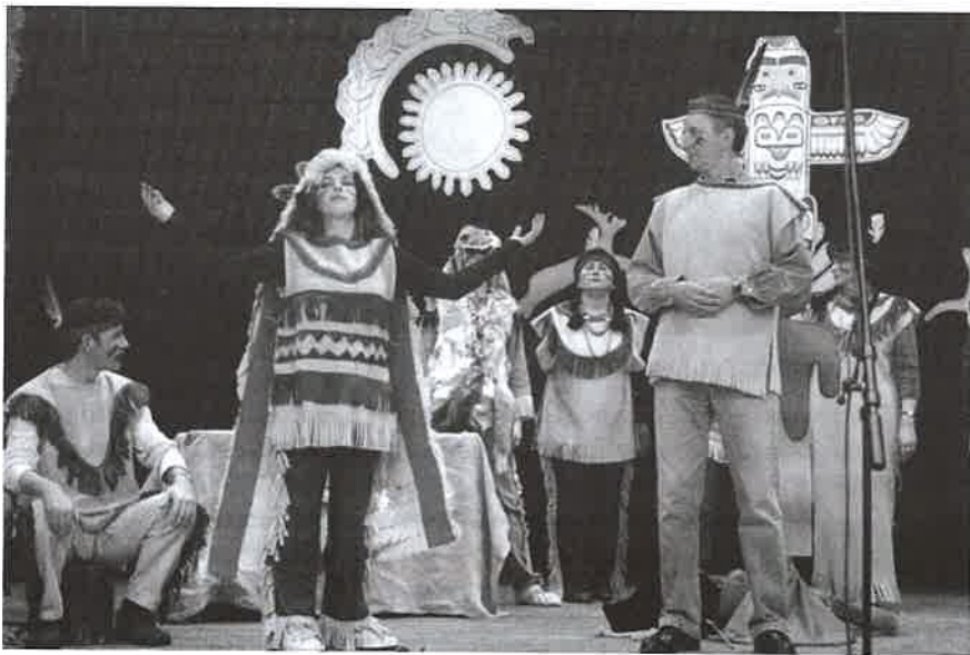
A tanárok produkciói nagy sikert arattak.