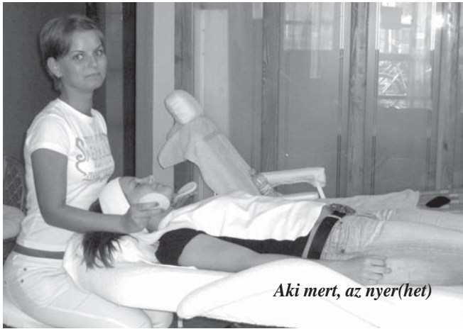
Aki mert, az nyer(het)

Derecske egykor a vállalkozók városa volt, de a mai nehéz gazdasági helyzetben is akadnak olyan optimisták, akik bíznak ötletükben és merik megvalósítani álmukat – ráadásul itt helyben, ami a településnek is hasznos.