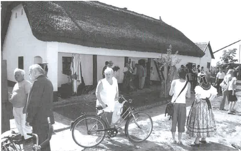
Nem csak múzeum lesz a tájház.