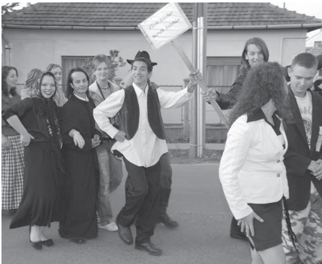
A csoportok utcai felvonulása (is) nagy sikert aratott.