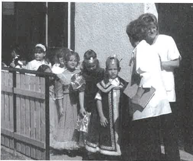
Fontos a tehetséggondozás ebben az életkorban is

– Hiányoznak a gyerekek, a régi csoportom. Gyökeresen megváltoztak a napjaim, reggeltől estig az irodában kell dolgoznom. Most még át kell látnom az óvoda egész rendszerét, a személyi anyagoktól a szakmai irányításig. Több mint nyolcvan munkavállaló foglalkoztatásának a felelőssége szakadt rám. Most formálódik a társulási szerződésekben lefektetett együttműködések gyakorlati megvalósítása. Fontos feladatnak tartom, hogy a nevelőtestület őszinte munkakörében tudjon együtt dolgozni. Építem a csapatot magam köré. A kimondott szavaknak súlya van, és nem mindegy, hogy kritika vagy intrika hangzik el. Céлом, nyílt őszinte légkör kialakítása, minden kollégámmal személyes beszélgetés keretében egyeztetjük, hogy ő milyen feladatvállalással tudja előmozdítani az óvoda ügyét. Nem változtattam a vezetésen, hiszen nagy gyakorlattal és tapasztalattal bíró