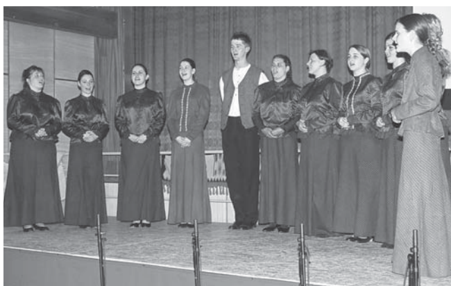
Új tagokat is várnak a „Tilinkósok”

– A Verbunktalálkozóra érkező csoportok, akik egy-egy tájegység néptánc koreográfiáját adták elő, ehhez mi az adott tájegység népdalcsokrét társítottuk, miközben a közönség kivételén is nyomon követhette