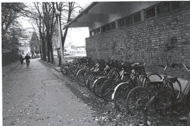
A kerékpárút megépítése biciklisták életét fogja megmenteni

Gazdasági és Közlekedési Minisztérium támogatásával kerékpárút épül 2008-ban Derecske és Tépe között. A két települést összekötő csaknem két kilométernyi szakasz megépítésére 59.460.000 forintot nyertek a pályázók. A 2008 szeptemberére elkészülő beruházás jelenleg az előkészítés szakaszában tart. Folyik műszaki ellenőr kiválasztása majd közbeszerzési eljárás során a kivitelező.