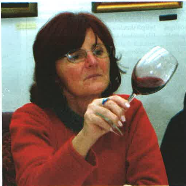
A zsűri alaposan megvizsgálta a nedűket.

A versenyen persze eredmények is születtek. Vörös bor