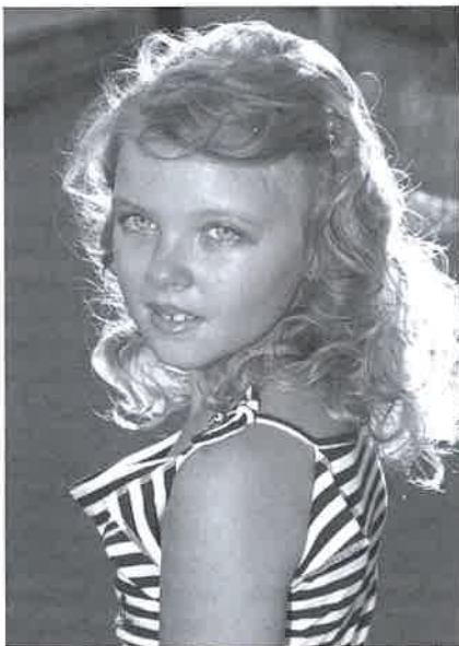
A szépségverseny egyik legszebbje mindenkit Marilyn Monroe-ra emlékeztetett.