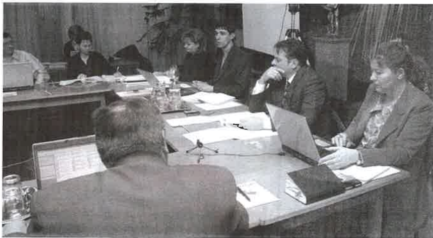
A képviselő-testület ebben az évben lerakja az alapokat...

– Újból megindultak az általános iskolák átszervezésével kapcsolatos munkálatok. Tud-