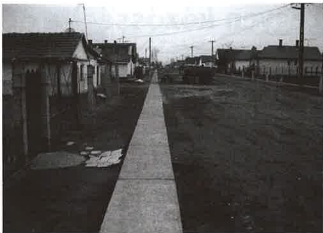
Az új járda lépés az élhető élet felé...