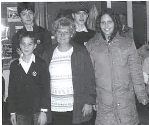
A nyolcadikosok csapata