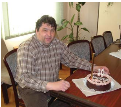
A jubileumhoz torta is dukált

Amikor idejöttem, eléggé lerobbant állapotokat találtam úgy a közbiztonság területén, mint a rendőrörsön belül. Nem volt ritka a napi 4-5 betöréses lopás üzletekbe, magánházakba. Egy szóval: áldatlan állapotok uralkodtak a városban, ami azonnali beavatkozást igényelt. Új taktikával, támadó szellemben kezdtünk hozzá a bűnügyek felderítéséhez, és augusztusig 23 bűnelkövetőt „vontunk ki” a forgalomból. Sikert a városban elfogadható közbiztonsági helyzetet teremtenünk. Persze, a feltételek akkor sem voltak adottak, nem volt számítógépünk, nem volt elegendő gépkocsink, több fős hiánnyal küzdöttünk, s egy lepukkant épületben kellett dolgoznunk. Az első években sikerült ezen a helyzeten javítanunk, s ahogy optimálisabbá váltak a feltételek, úgy mutatkoztak az eredmények is. Amíg 1998-ban 100 bűncselekményből csak 22-t derítettünk fel, addig mára ez a mutató stabilan 40-50 között áll, sőt, 2003-ban 62 százalék volt felderítési eredményességünk. Az évek során sok munkatárssal dolgoztam együtt, közel negyvenre tehető azok száma, akik irányításom alatt végezték munkájukat. Nagyon sok időt kellett képzésükre fordítani, de sajnos, a rendőrség igen rossz humán erő-