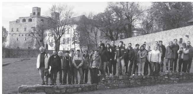
A kiránduláson mindenki jól érezte magát

– A pályázatod sikeres volt, így részt vehettél az említett utazáson. Merre jártatok, milyen tapasztalatokkal gazdagodtál?