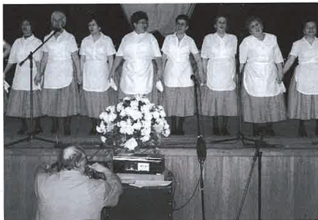
Az új csoport nagy sikert aratott

Március 6-án nőnapot tartottunk a klubban. Meghívtuk közénk a hajdúszoboszlói és a füzesgyarmati nyugdíjasok klubjának tagjait is.