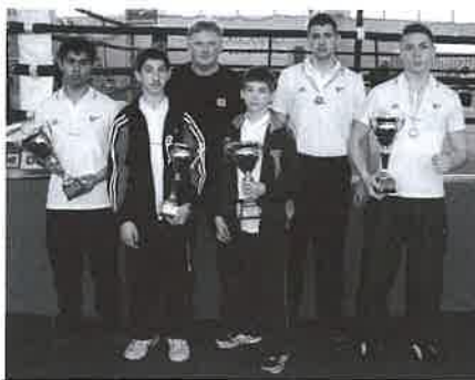
Az ökölvívók megint kitettek magukért

A DVSC Derecske bokszoói eredményesen szerepeltek március 19. és 22. között a Nagykanizsán megrendezett serdülő- és kadetkorú ökölvívók országos diákolimpiáján.