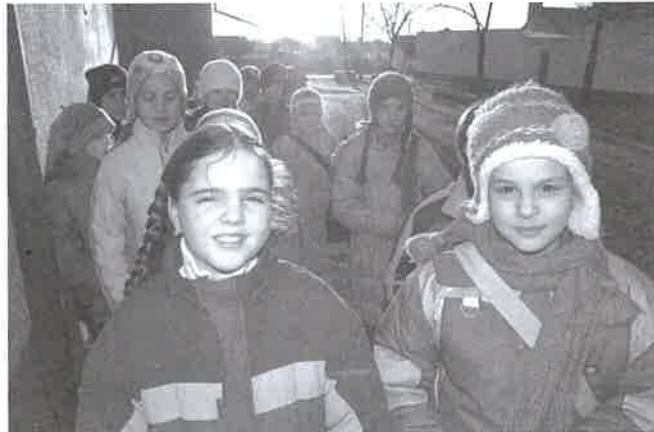
A gyermekeink jövőjét is meghatározzuk a szavazatunkkal

A szavatszámoló bizottság – szavazóköri eredményt megállapító – döntése ellen önálló fellebbezés nyújtható be, melyet az OVB bírál el a választási eredmény megállapítása előtt. A választásról szóló jogszabály, illetőleg a választás alapelveinek megsértésére hivatkozással bárki