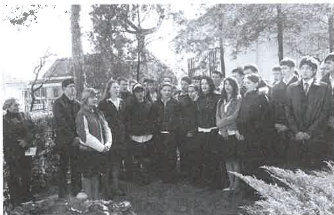
Ünnepi műsor Berettyószéplakon

2008. március 15-én, szombaton 7 órakor indult el a derecskei I. Rákóczi György Gimnázium, Szakközépiskola és Kollégium 11. b. osztálya hét pedagógus kíséretében a romániai Berettyószéplak felé. A korai időpont ellenére nagy volt a lelkesedés és az izgalom a diákok körében, hiszen már hetek óta készültek az előadandó ünnepi műsorra.