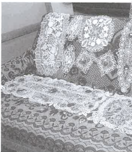
Közösen végzik a hagyományörzést (fent) – Se szeri, se száma a szemet gyönyörködtető alkotásoknak