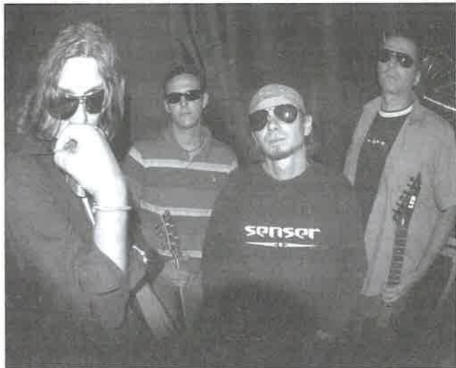
A Szélső Érték zenekar (is) az Oázissal ünnepelt

fog. Érezhető volt valami pozitív, hasznos feszültség a levegőben, hogy van mire várni. Jó volt része lenni a tömegnek, együtt várni, valami megfoghatatlanban közösködni, bátran visszabámulni a robogós srácra, aki a fejét fordítva néz vissza, hogy valami történik az Oázisban. Bizony, biccentettünk volna vissza páran. Itt valami történik... S történt is, a legnagyobb természetességgel vettük, hogy elkezdődött. Elkezdődött, de mi kint ültünk, s mindaz a várakozás, izgalom hirtelen megtörténtté vált. Ültünk, a hátunk mögött szólt a zene. Szeretem az ilyen utolsó utáni pillanatokat. Az utca hirtelen újra utca lett, nem a várakozó tömeg tere. S az a valami, a pozitív feszültség immár bentre költözött. Mentünk is utána.