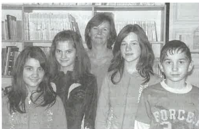
A szemészeti verseny résztvevői