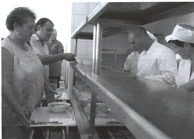
A megszokotthoz képest óriási adagokat főznek