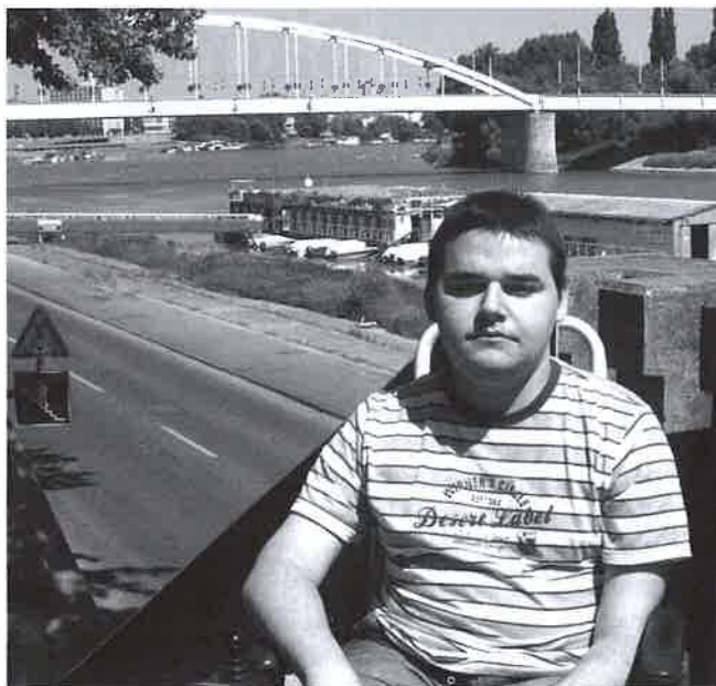
Imi közeli célja az érettségi

Imi csak vitaminokat szed. 9 évesen vált nehézkessé a mozgása, addig úgy élt, mozgott, mint bármelyik kisfiú. Vizsgálatok igazolták a súlyos diagnózist, izomsorvadás. A család felvette hasonló sorsú családokkal a kapcsolatot, érdeklődött, pénzt gyűjtött. A „Segíts, hogy felnőtt is lehessen!” alapítványra a rengeteg felajánlásból nagyon