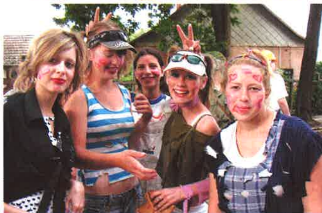
Vidáman „bolondballagtak” a bocskaisok