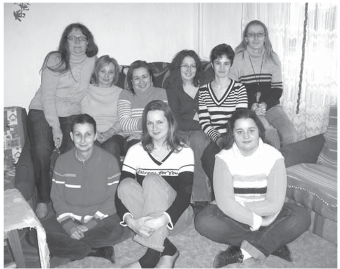
Maguk is meglepődtek azon, milyen nagy szükség van a segítségükre

Ígény van a munkánkra. Jelenleg közösségi ellátásban 68 ellátottunk van, nappali ellátásba 31 fő az ellátottak száma,