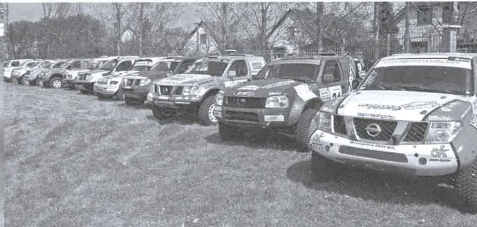
Fórián József képriportja