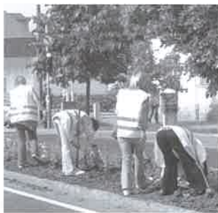
Területfejlesztés – immár derecskei irányítással

A térségi együttműködés a közoktatás területén jelentős állami kiegészítést nyújt a társulást alkotó intézményeknek: bejáró