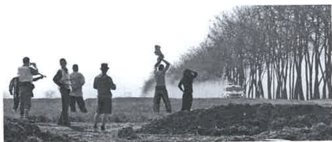
Mindenütt volt nézője a futamoknak