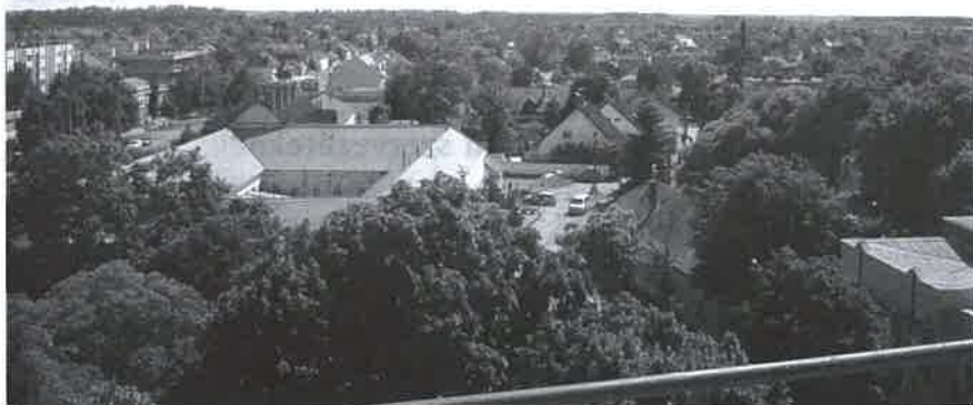
A sok beruházás nem veszélyezteteti a programot

– Ha valaki nem fizet, az az önkormányzat vesztesége lesz a nagy elszámoláskor, mivel neki kell jótállni. Ezért önkormányzati érdek, hogy az utolsó forintig behajtsuk a tartozásokat. Meg is fogjuk tenni. Az érintettek már tapasztalják is, hiszen a napokban megkapták a fizetési felszólításokat. Fel sem merülhet az, hogy valaki nemfizetése miatt a rendesen fizetőknek kell magasabb összeget fizetni, mivel 2800 ingatlanra osztottuk az összeget, s ezen már nem tudunk változtatni. A társu-