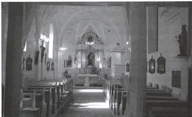
A templomfelújítás öt héten át tartott