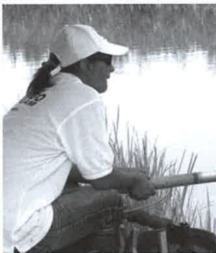
„A gyermekeim büszkék rám...”

– Az átlagember, ha horgászatról van szó, arra gondol, hogy valaki úcsörög a part szélén, figyel, hogy mikor akad a horogra mondjuk egy 10 kilós ponty. Mi nem erre várunk. Nekünk adott idő - 3 óra - alatt kell kifogni a lehető legtöbb halat. Ezt súlyra mérik, teljesen mindegy, milyen hal. Sokszor egy nagy hal több kárt okoz, szétveri az etetést, és sok időt veszítünk, míg kifogjuk. Az olaszok egy nagyon szeszélyes vízre vittek bennünket, ahol a víz sebessége állandóan változott, ez nehezítette a horgászatot. Aki ért hozzá: 40 grammos úszótól a 2 grammosig lehetett használni. Nem volt halban gazdag a pálya, ettől még nehezebb volt a