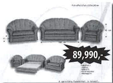
3+2+1 garnitúra /ágyazható/