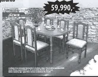
6 személyes étkező