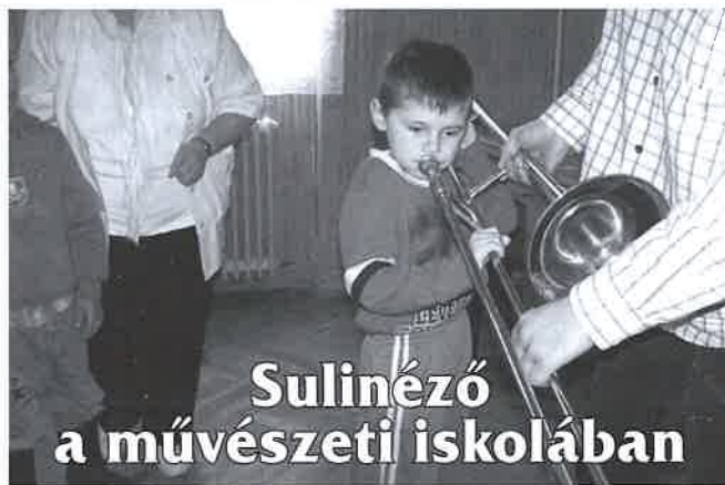
Sulinéző a művészeti iskolában

A bevételt növelte az is, hogy a Városgazdálkodási Kht. elengedte a terembérlési díjat és csak a rezsi költséget kellett kifizetnünk. Köszönet érte!