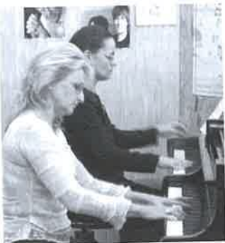
Páratlan élmény volt

Haydn korának legnagyobb, leghíresebb és legjelentősebb zeneszerzője volt. A „Bécsi Klaszszikusok Mesterének” életműve 1200 nagyszerű szerzeményt foglal magába, többek között a mai német himnusz zenéjét, eredeti címén a Császári Himnusz. A vidéki fiúból oxfordi