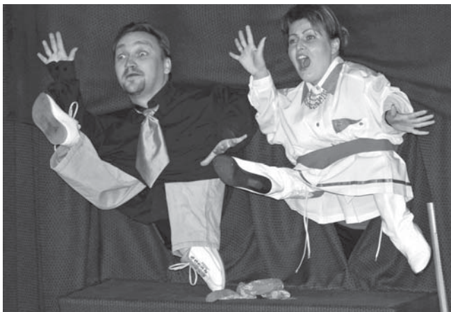
EGY VIDÁM ESTE. Február utolsó hétvégéjén a Bocskai-iskola rendezte meg hagyományos farsangi bálját. A rendezvényen színvonalas produkciók szórakoztattak mindenkit.