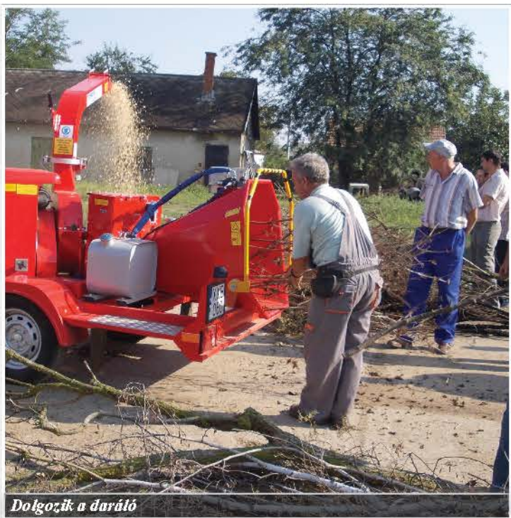
Dolgozik a daráló