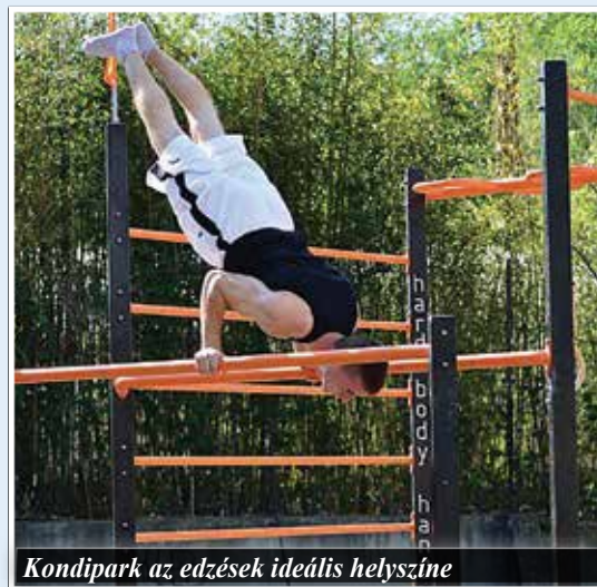
Kondipark az edzések ideális helyszíne