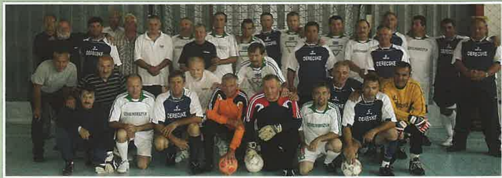
Székelykeresztúron is megmérkőztek egymással az öregfiúk

Hajdú-Bihar megyében a hajdúszoboszlóiak mellett a derecskei öregfiú focistáknak nagyon jó a kapcsolatuk a mikepércsi veteránokkal is, akikkel idén is megmérkőztünk egy oda-visszavágó erejéig. Mikepércs és Hajdúszoboszló mellett szeretnénk további megyei kapcsolatokat