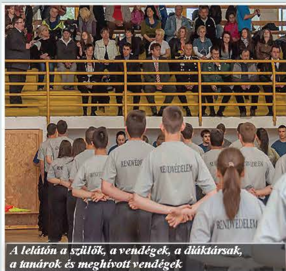
A lelátón a szülők, a vendégek, a diáktársak, a tanárok és meghívott vendégek