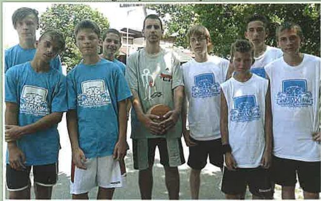
Az utánpótlás csapat