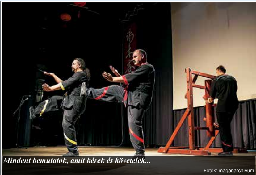
Mindent bemutatok, amit kérek és követelek...