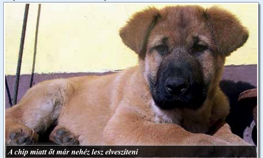
A chip miatt őt már nehéz lesz elveszíteni