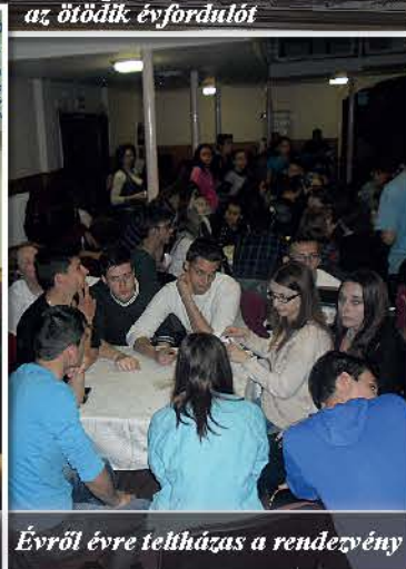
Évről évre teltházas a rendezvény