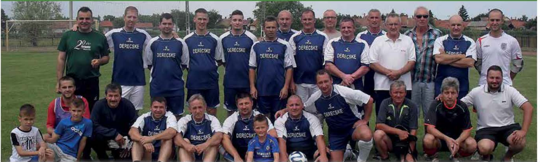
Derecske csapata az öregfiúk nyári, III. Varga János Emléktorna című rendezvényén