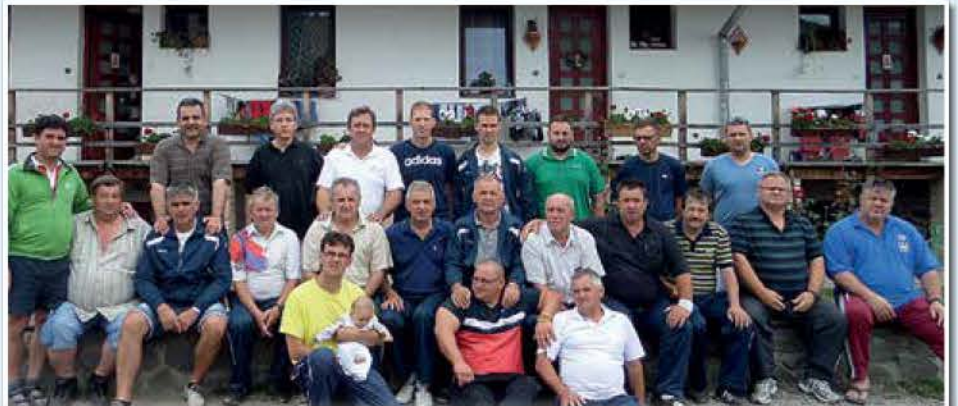
A szovátai alapítvány előtt