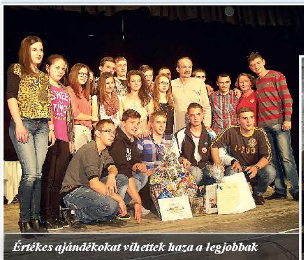
Értékes ajándékokat vihettek haza a legjobbak