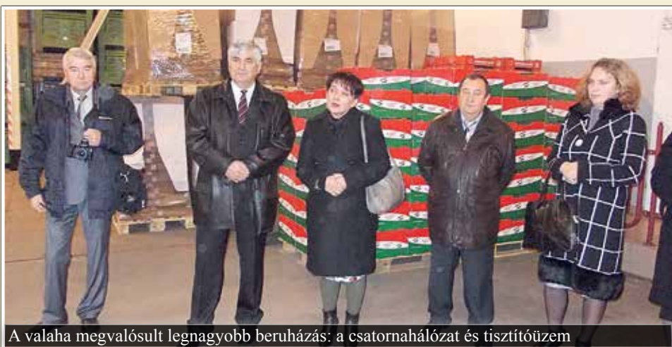
A valaha megvalósult legnagyobb beruházás: a csatornahálózat és tisztítóüzem