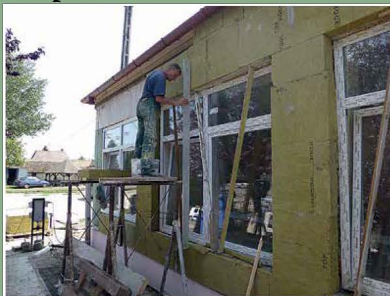
Az átadás szeptember 1-jén 8.00 órakor, a tanévnyitó ünnepség keretében történik. /8