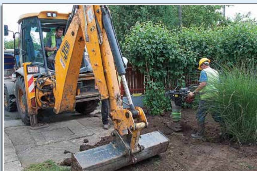
Hiába van már a cső vége az udvaron, a szennyvíz még nem jut el a tisztítóhoz

is üzembe helyezésre került, a rákötés megvalósítható. Ha az épületben keletkező szennyvizek elvezetése a terepi adottságok miatt gravitációs úton nem lehetséges, az ingatlanon belül házi szennyvízáttemelő akna kerül kiépítésre. Az áttemelő aknára történő rácsatlakozásnál kiemelten fontos a csatornázási szakember közreműködése, ugyanis fokozott szaktudást igényel az áttemelő aknák megfelelő koronafúróval történő megfúrása, a tömítettség szakszerű megoldása. Majd a már elkészült csatlakoztatást 48 órán belül személyesen be kell jelenteni a Vízmű Zrt. derecskei vízműtelepén. Az ingatlanon belül elhelyezett műanyag tisztítóaknára, házi áttemelőaknára történő rákötésnél a földtakarás addig nem végezhető el, amíg a Vízmű Zrt. azt át nem vette. A szennyvízcsatorna-hálózatra történő rácsatlakozás a Vízmű Zrt. felé fizetendő felülvizsgálati díja: