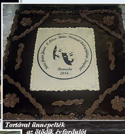
Tortával ünnepelték az ötödik évfordulót