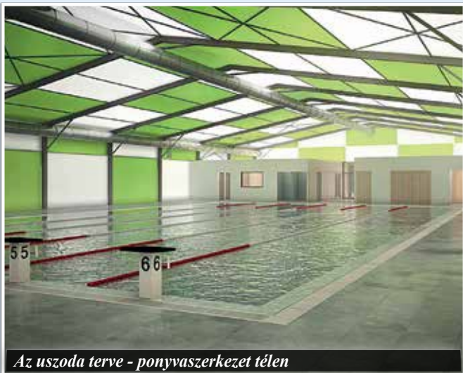
Az uszoda terve - ponyvaszerkezet télen