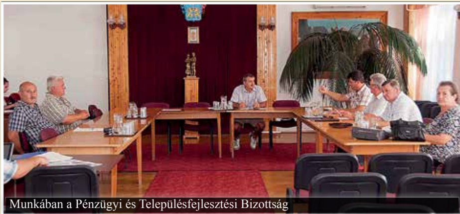
Munkában a Pénzügyi és Településfejlesztési Bizottság