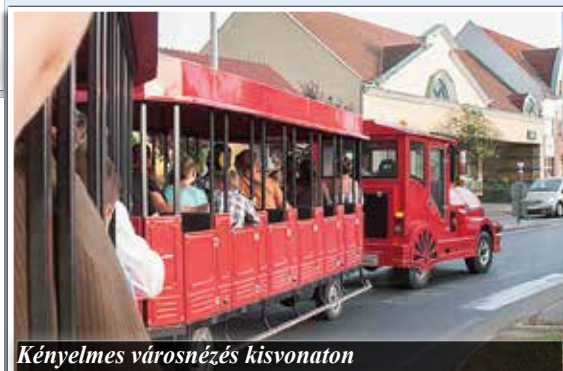
Kényelmes városnézés kisvonaton