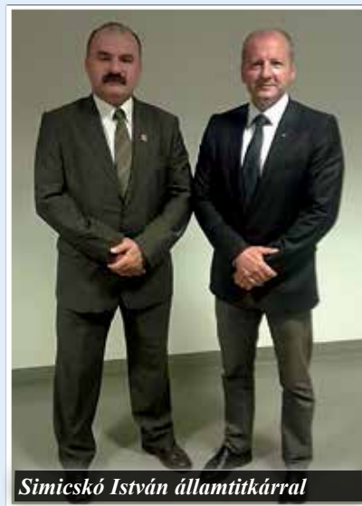
Simicskó István államtitkárral