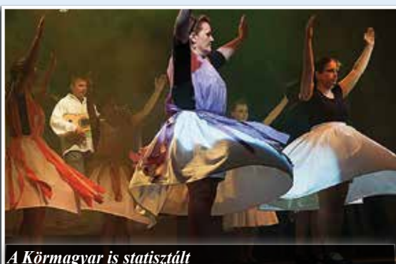
A Környári is statisztált