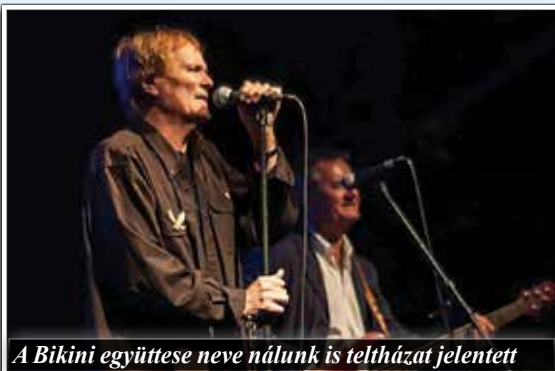
A Bikini együttese neve nálunk is teltházat jelentett