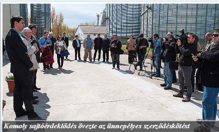
Komoly sajtóérdeklődés övezte az ünnepélyes szerződéskötést