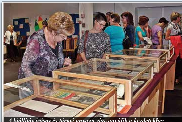
A kiállítás írásos és tárgyi anyaga visszanyúl a kezdetekhez