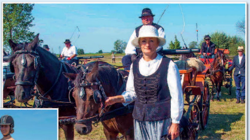
A derecskei Kozák házaspár