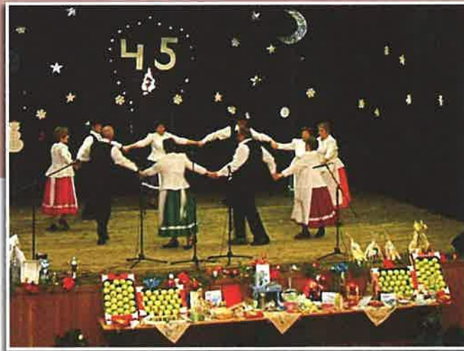
A néptánc csoport

Tánc csoportunk öt éve működik, mára vegyes tánc csoporttal dicsekedhetünk.