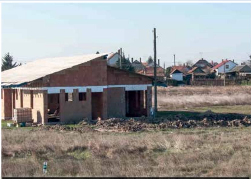
Szabálytalanul épült, lebontották