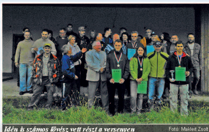
Idén is számos lövész vett részt a versenyen