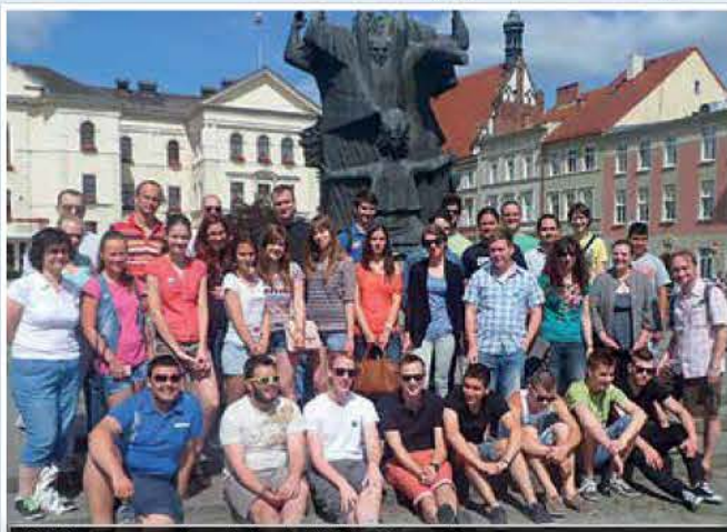
A Magyarországot képviselő fúvószenekar