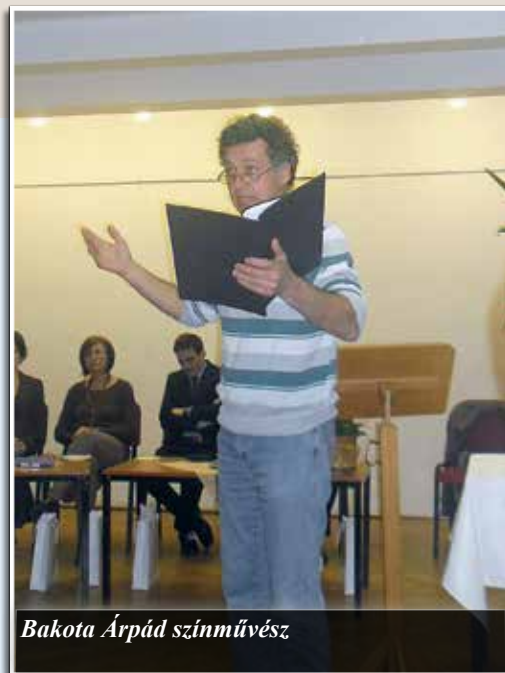
Bakota Árpád színművész