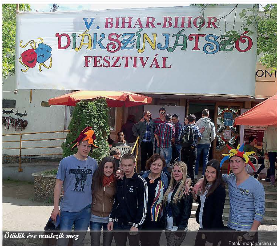
Ötödik éve rendezik meg