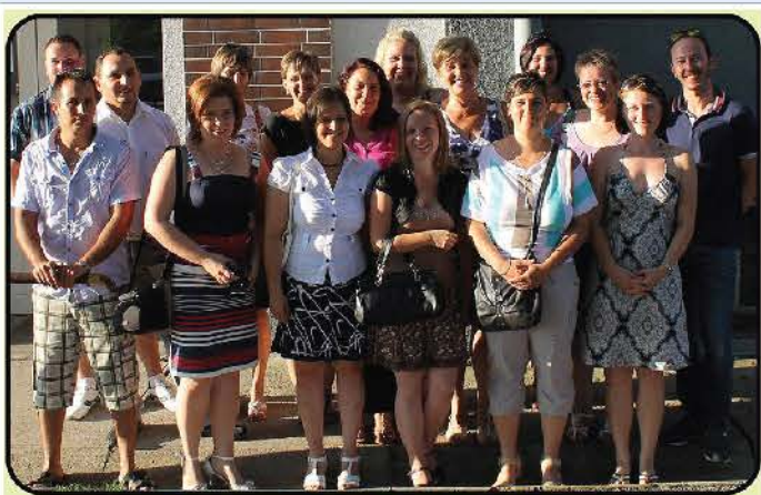
15 éves Osztálytalálkozó