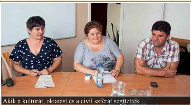
Akik a kultúrát, oktatást és a civil szférát segítették