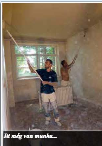
Itt még van munka...