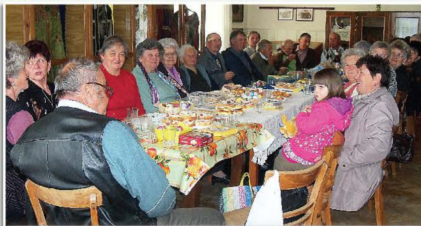
A Derecskei Hagyományörző Nyugdíjas Klub tagjai húsvét után keddi nap találkoznak a helytörténeti múzeumban minden évben