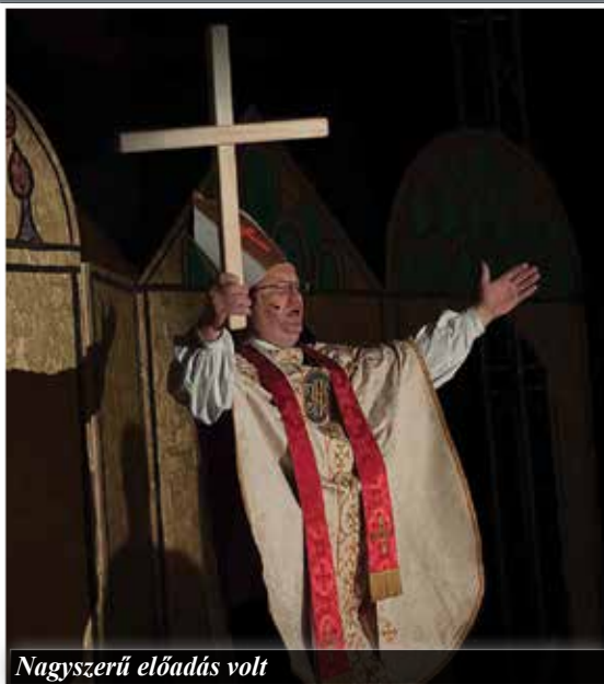
Nagyszerű előadás volt