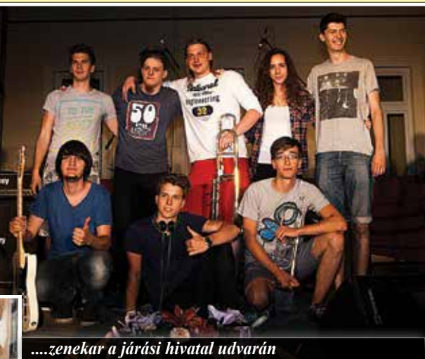
....zenekar a járási hivatal udvarán