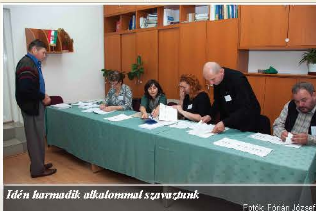
Idén harmadik alkalommal szavaztunk