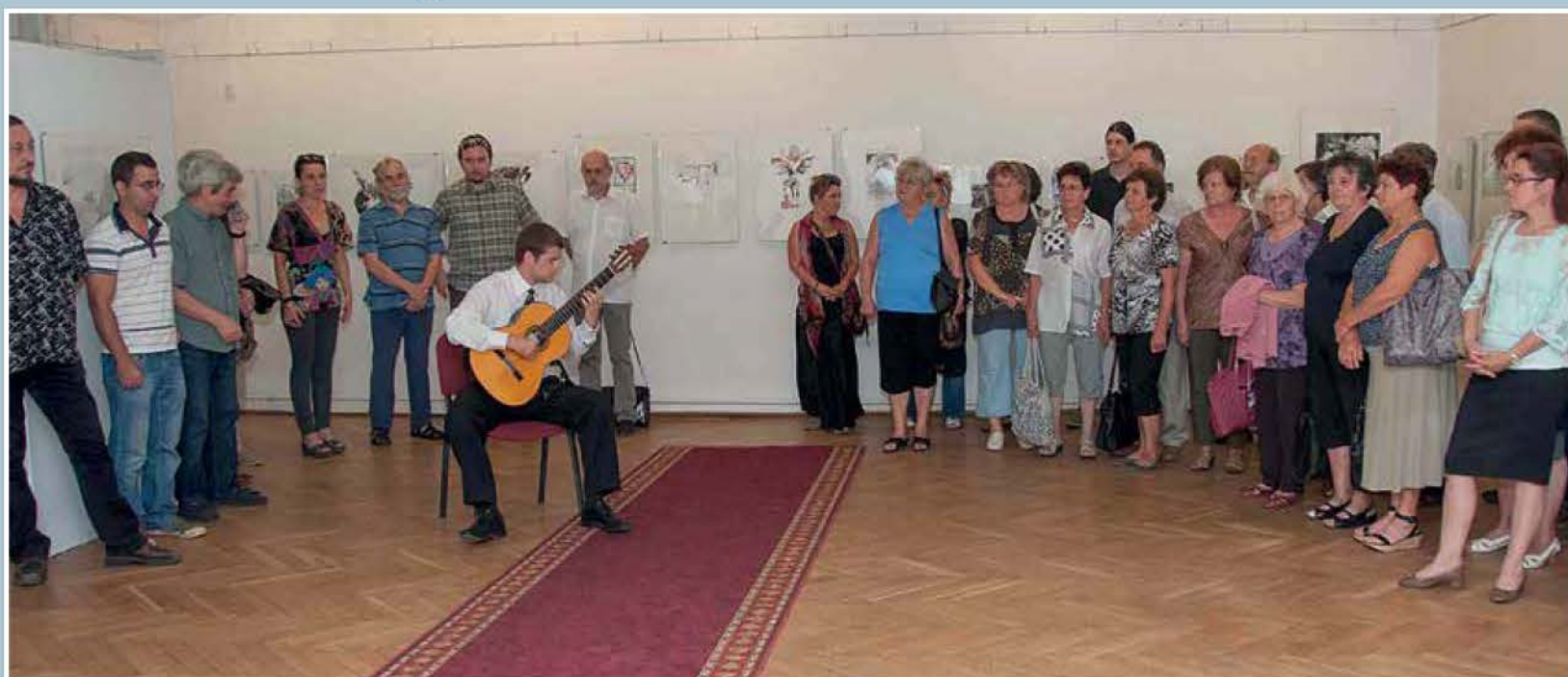
Alkotók és közönség a grafikai művésztelep zárókiállításán. /9