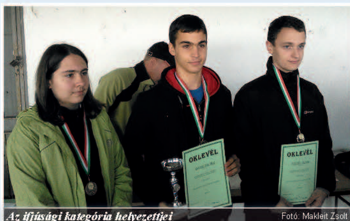
Az ifjúsági kategória helyezettei