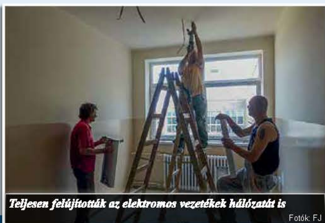
Teljesen felújították az elektromos vezetékek hálózatát is