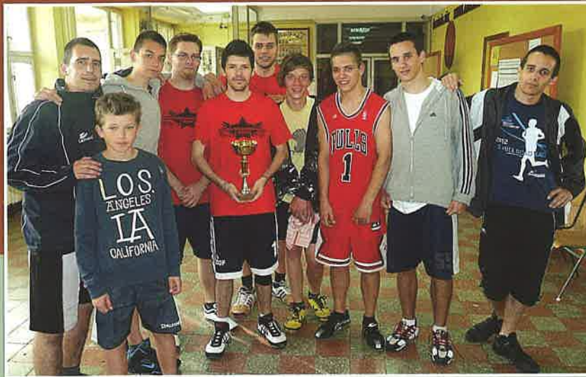
Püspökladányi 24 órás kosárlabdázáson

- A gimnáziumi pályáján kosárlabda-bajnokságot szoktam szervezni. Sajnos az intézmény vezetése kevésbé támogatja tevékenységünket. Kevés rendezvény van, amire el tudunk menni, a derecskei rendezvények elmara-