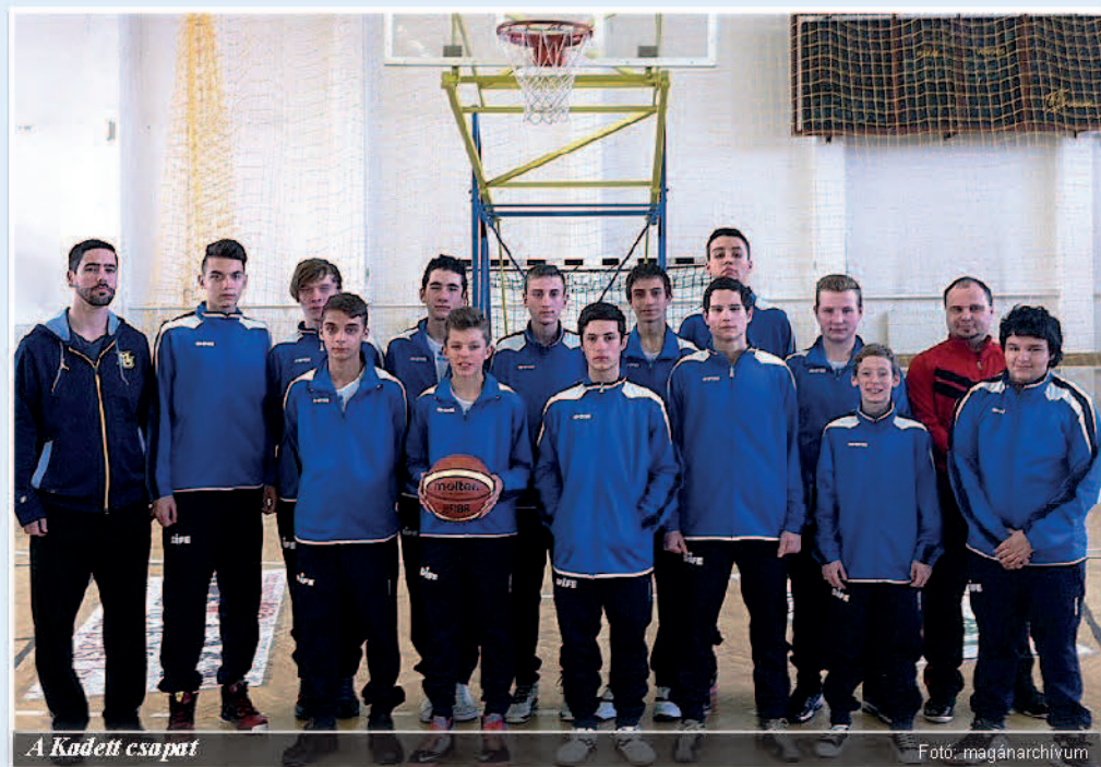
A Kadett csapat