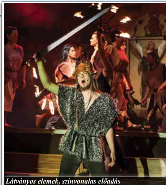
Látványos elemek, színvonalas előadás