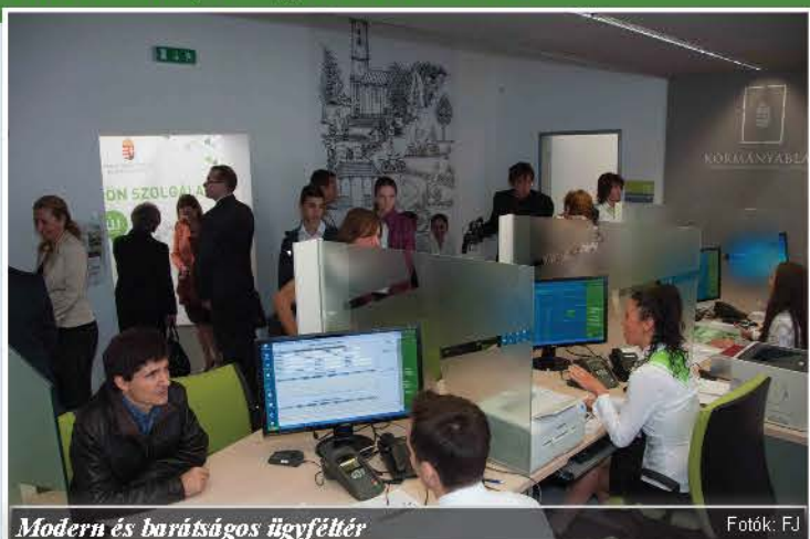
Modern és barátságos ügyféltér