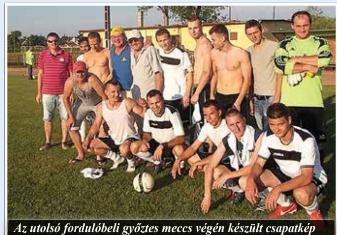
Az utolsó fordulóbeli győztes meccs végén készült csapatkép