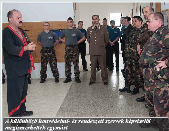
A különböző honvédelmi- és rendészeti szervek képviselői megismerhették egymást