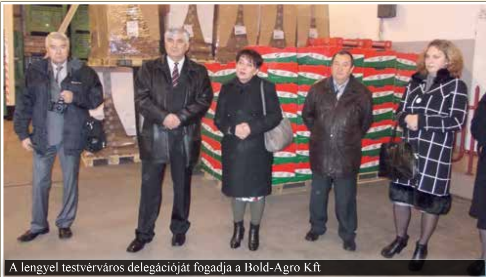
A lengyel testvérváros delegációját fogadja a Bold-Agro Kft