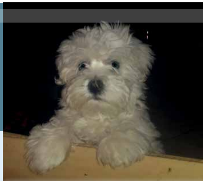
Van, hogy csak jószág, van, hogy a legjobb barát.

- Már tető alatt volt az épület, akkor kezdődött a lakosság egy részének tiltakozása. Az elnyeréstől számítva egy évig nem kezdtük el az építkezést, mert igyekeztünk másik területet találni, mi-