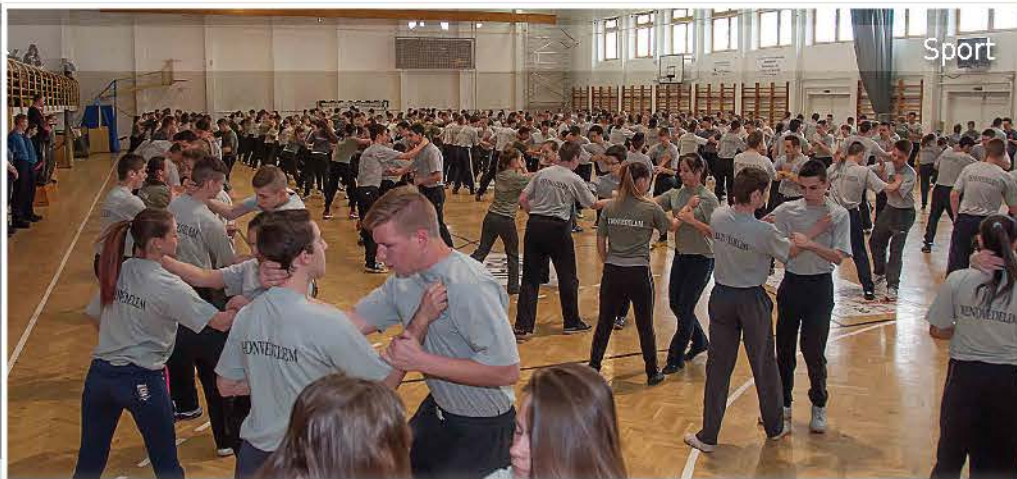
Háromszázötven egyen- és formaruhába öltözött diák egyszerre végzi a formagyakorlatot