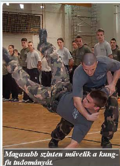
Magasabb szinten művelik a kung-fu tudományát