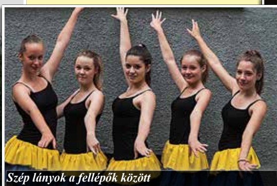
Szép lányok a fellépők között