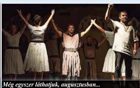
Még egyszer láthatjuk, augusztusban...