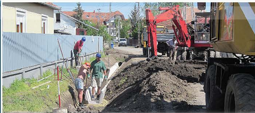
Számos utcában épülhetett új csapadékvíz-elvezető pályázati forrásból

Derecske Város Önkormányzata a csapadékvíz hálózat 2010-es felújítását követően tavaly egy újabb sikeres pályázatnak köszönhetően 303.340.536.- Ft összegű támogatásból tovább fejleszthette a város csapadékvíz-elvezető-rendszerét.