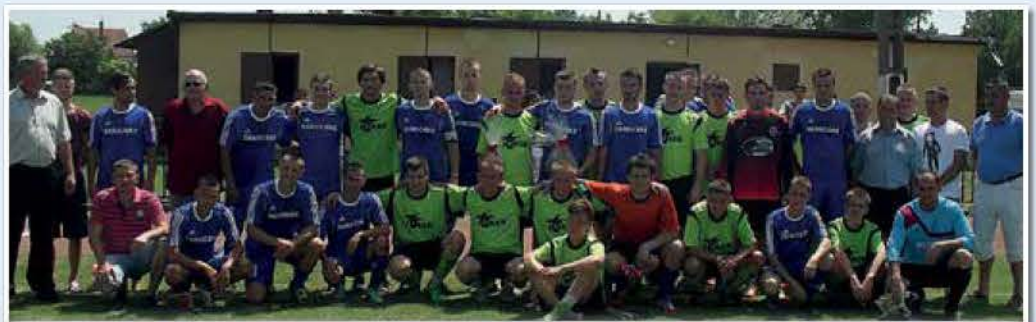
Koszyce és Derecske csapata