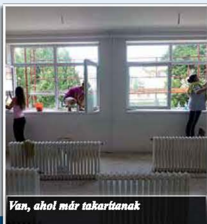
Van, ahol már takartanak