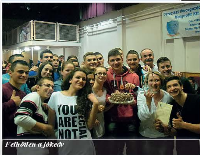
Felhőtlen a jókedv