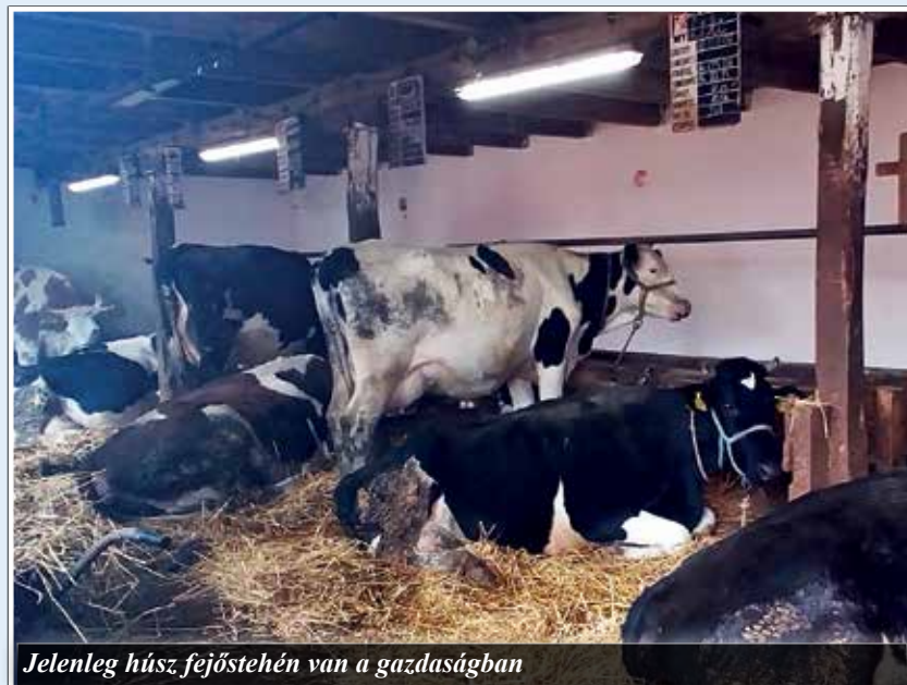
Jelenleg húsz fejőstehen van a gazdaságban