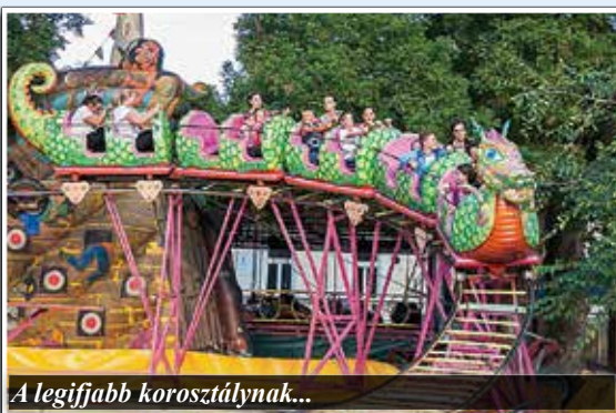
A legifjabb korosztálynak...