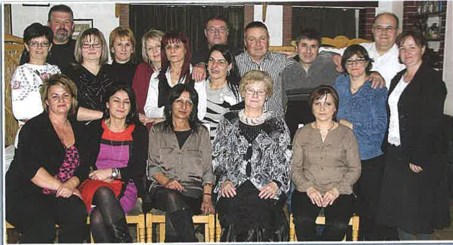
8/a osztály. 2013.11.30.