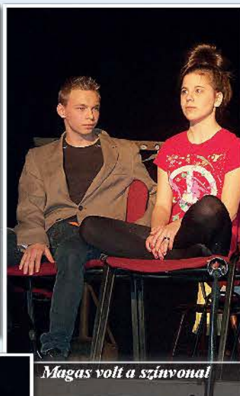
Magas volt a színvonal!