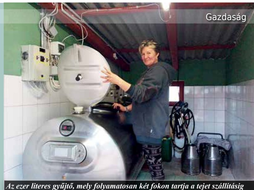
Az ezer literes gyűjtő, mely folyamatosan két fokon tartja a tejet szállításig