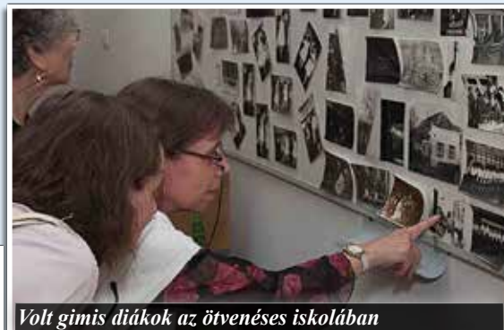
Volt gimis diákok az ötvenéves iskolában