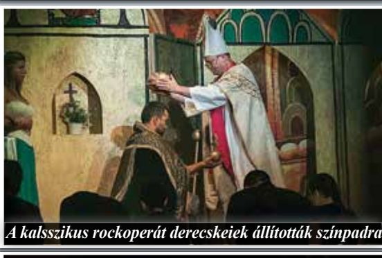
A kalsszikus rockoperát derecskeiek állították színpadra