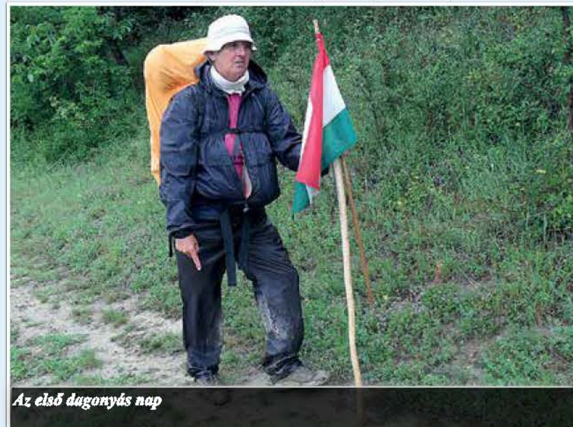
Az első dagonyás nap

Az ott eltöltött huszonegy nap alatt pontosan éreztem a különbséget. A csoport, akikkel a biztonságom miatt csatlakoznom kellett, zarándokcsoport volt. Ebből a szempontból én kívülállónak vettem részt, számomra nem volt vallási töltet. A zarándok hitvallás szerint a zarándok nem turista és nem kirándul. Az idegenforgalmi látványosságokat nem keresi, bizony többször volt, hogy elmentünk olyan dolgok mellett, amiket én szíve-