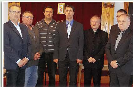
A polgármester és a kivitelezésben részt vevők a projekt záróeseményén