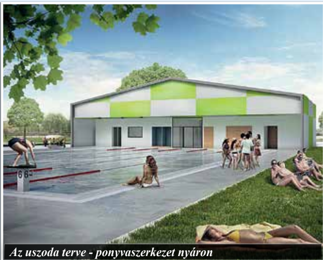
Az uszoda terve - ponyvaszerkezet nyáron