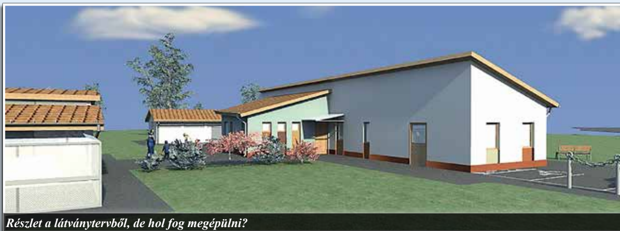
Részlet a látványtervből, de hol fog megépülni?

- Voltak egyeztetések a lakosság képviselői, a polgármester és közöttünk, melyek arról szóltak, milyen kompromisszumokat tudunk tenni. Szakértőket fogadtunk, zajvédő falat terveztünk, vállaltuk, hogy saját költségen megépítjük. És azt is, hogy az eredetileg száz kutya befogadására épülő menhely csak ötven kutyának nyújt majd menedéket. A 2013 novemberében elkezdődött tiltakozást követően sem az önkormány-