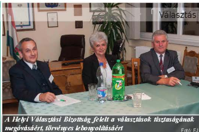
A Helyi Választási Bizottság felelt a választások tisztaságának megővéséért, törvényes lebonyolításáért

Előre lehetett jósolni, hogy alacsonyabb részvételre lehet számítani. Jó volt látni, hogy akik viszont szavaztak, azok megadták a módját: semmiféle rendkívüli esemény nem történt, az alkalomhoz méltó viselkedést tanúsított Derecske.