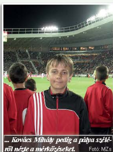
... Kovács Mihály pedig a pálya széléről nézte a mérkőzéseket.