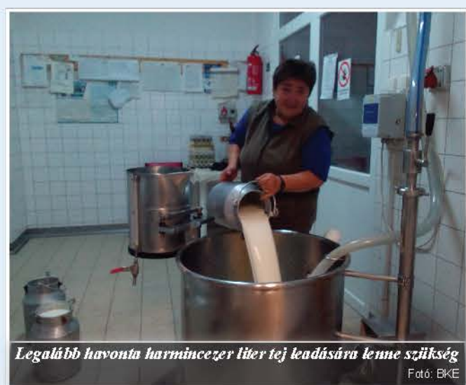
Legalább havonta harmincezer liter tej leadására lenne szükség

- Ugyanezek a problémák a környező településeken is kialakultak, Konyáron, Körösszakálon például. A tökére, gyorsan terjeszkedő felvásárló a na-