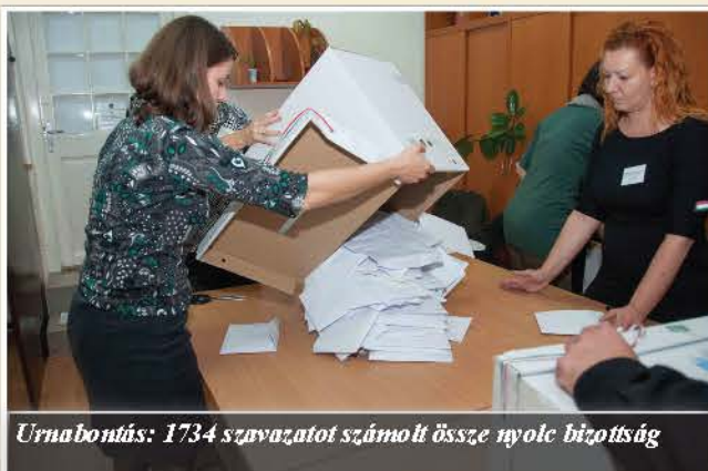
Urnbontás: 1734 szavazatot számolt össze nyolc bizottság