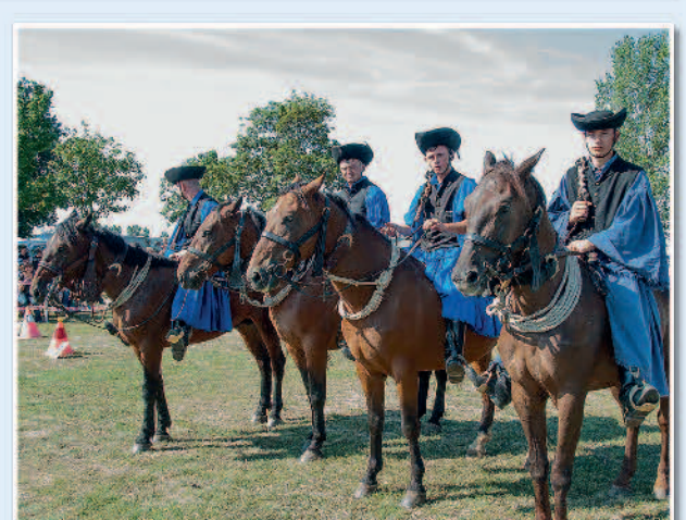
A bemutatókra együtt gyakorolunk