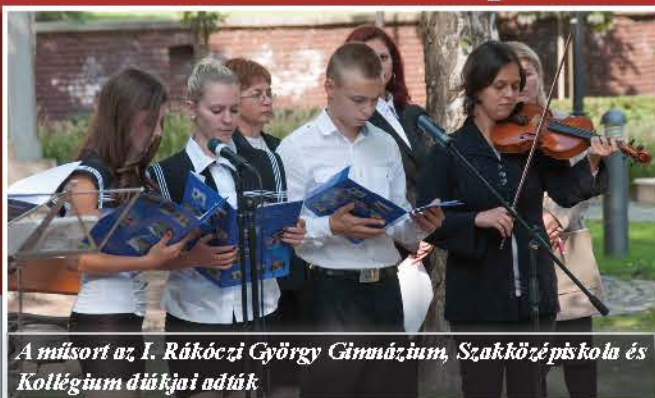
A műsort az I. Rákóczi György Gimnázium, Szakközépiskola és Kollégium diákjai adták