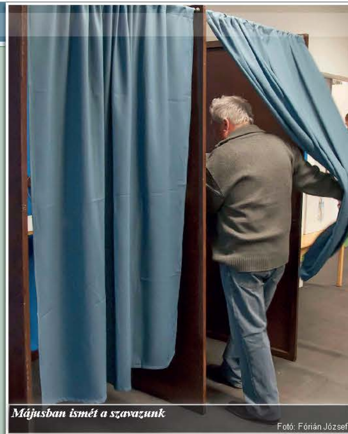
Májusban ismét a szavazunk

A tájékoztatóban megadott határidők nem csak a kérelmek benyújtására, hanem a már korábban előterjesztett igények módosítására és visszavonására is vonatkoznak (kivéve: az EU más tagállamának – magyarországi lakó-