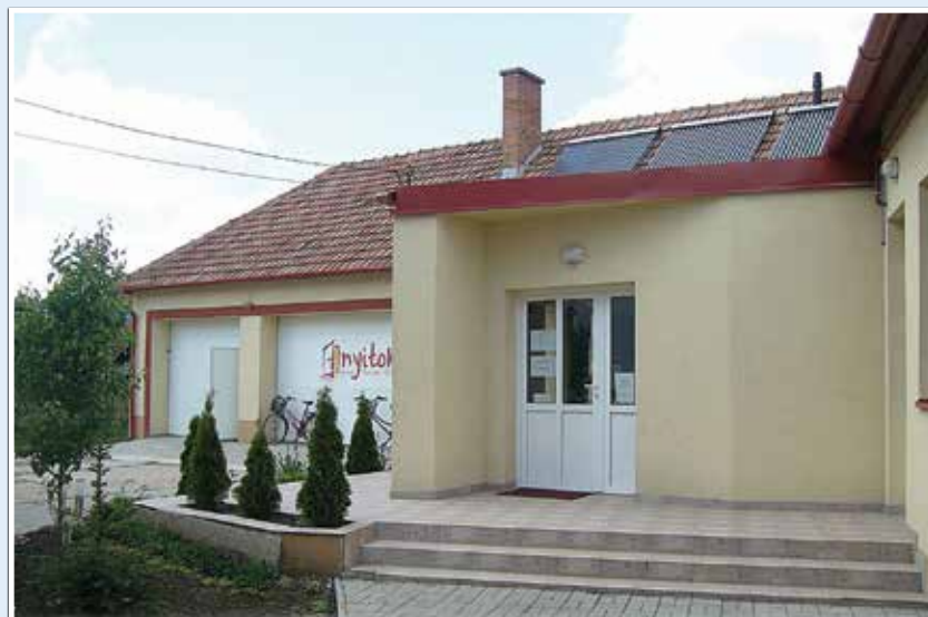
Az alapítvány nagy gyakorlattal rendelkezik az önkéntes tevékenység terén

Derecske Városi Jóléti Szolgálat Alapítvány