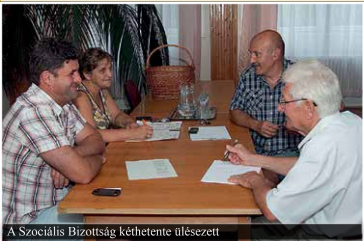
A Szociális Bizottság kéthetente ülésezett