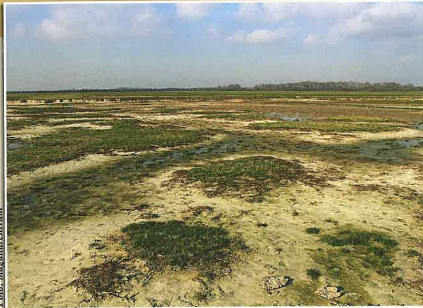
A derecskei Nagy-nyomáson (Nagy-sziken)

Derecske külterületén egyrészt a Bocskoros nevű szikes tómeder vízmennyiségét szeretnénk stabilizálni, azzal, hogy a területről vizet levezető egyik csatornán fix küszöbű bukót létesítünk. A területen mesterséges víz-