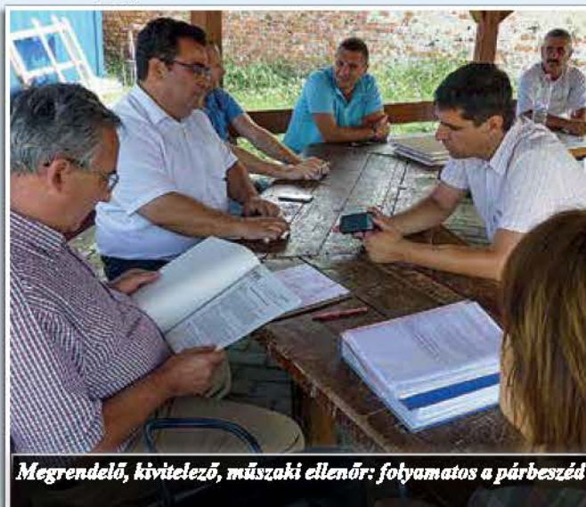
Megrendelő, kivitelező, műszaki ellenőr: folyamatos a párbeszéd