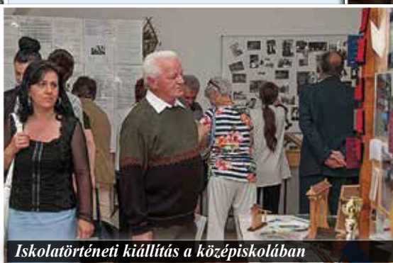
Iskolatörténeti kiállítás a középiskolában