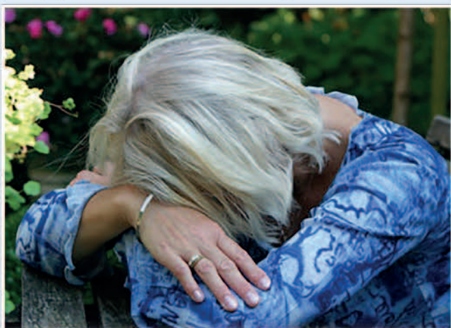
Nem csak a testünk, érzelmeink is válaszolnak a stresszre