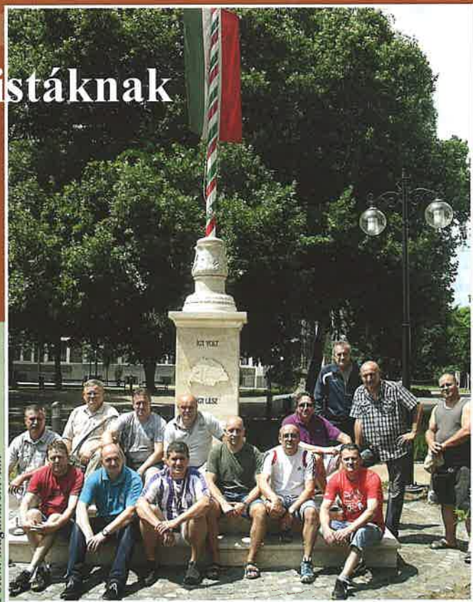
A Szatmárnémetiből érkező futballbarátok megtekintették városunkat és az országzászlót is