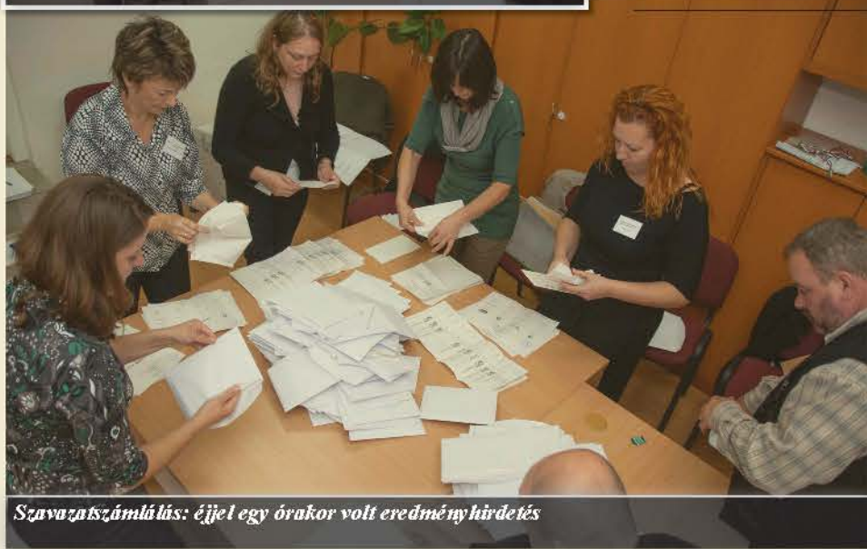
Szavatszámolás: éjjel egy órákor volt eredményhirdetés

Derecske Választókerület Roma Nemzetiségi Önkormányzati választási eredmény