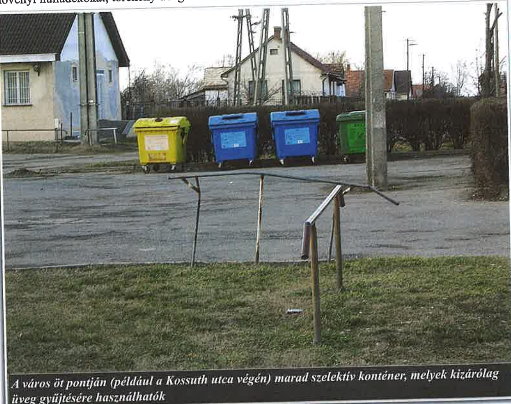
A város öt pontján (például a Kossuth utca végén) marad szelektív konténer, melyek kizárólag üveg gyűjtésére használhatók

Szelektív hulladékgyűjtésre alkalmas sárga színű zsákok közeli szállítási napjai: