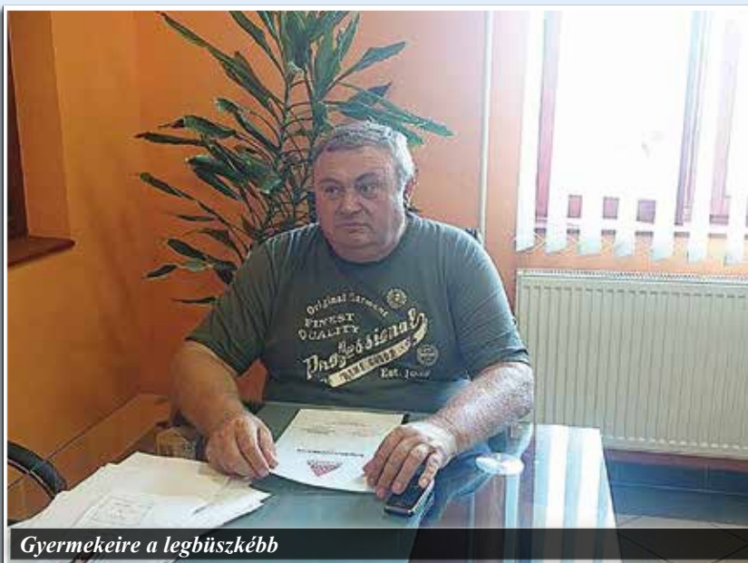
Gyermekeire a legbüszkébb

A cégnél jelenleg tizenegy fő dolgozik, gépészek, sofőrök, autószerelők, irodai munkatársak. Egyes munkákhoz pedig alvállalkozókat alkalmazunk, de a bővítéseknek és fejlesztéseknek köszönhetően egyre csökken az alvállalkozóknak kiadott munka. Jelenleg már tizenegy teherautó, rakodógépek, öt sínes kotró és más nagyértékű földmunkagép van a cég tulajdonában.