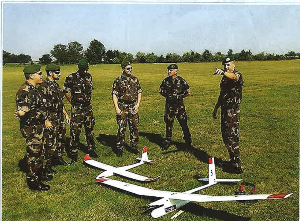
Oktatáson előadóként drónokkal