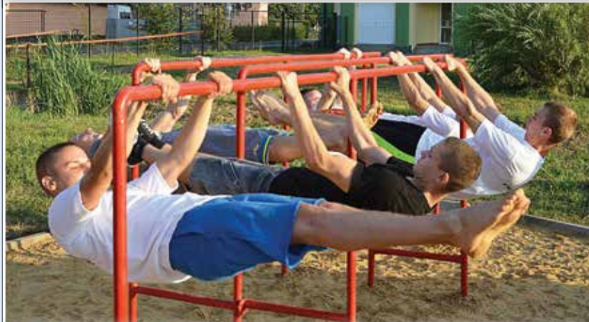
Párhuzamos korlát - szükség volt rá, megcsinálták