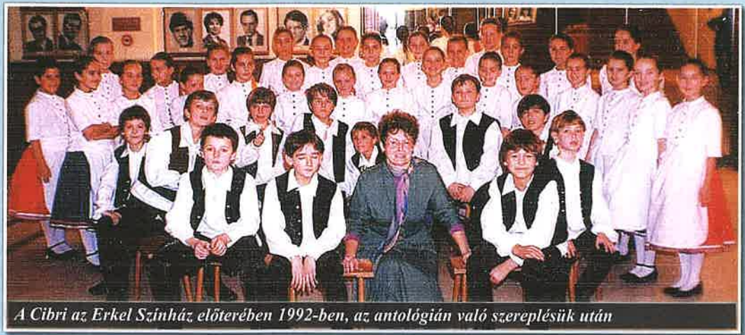
A Cibri az Erkel Színház előterében 1992-ben, az antológián való szereplésük után