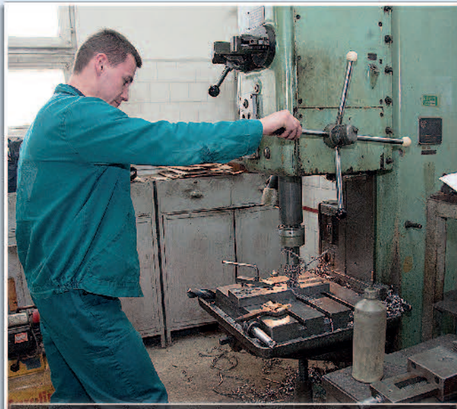
Külföldre és a helyi autógyáraknak is szállítanak

- Nagyon szeretek olvasni és kirándulni, valamint kedvem lelem a kertészkedésben és a barkácsolásban.