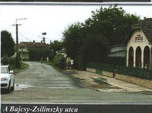
A Bajcsy-Zsilinszky utca