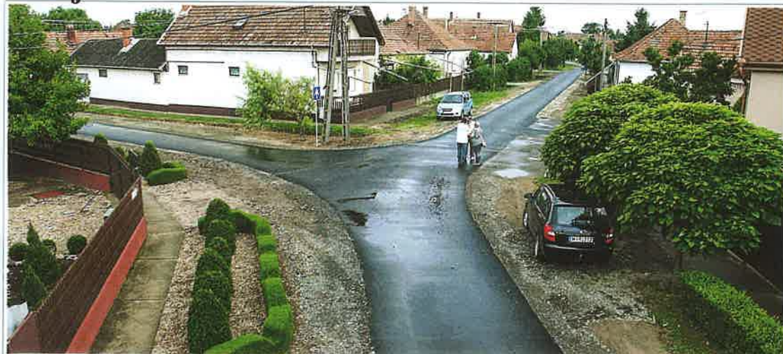
Többek között megújult az Eötvös utca - Kert utca is