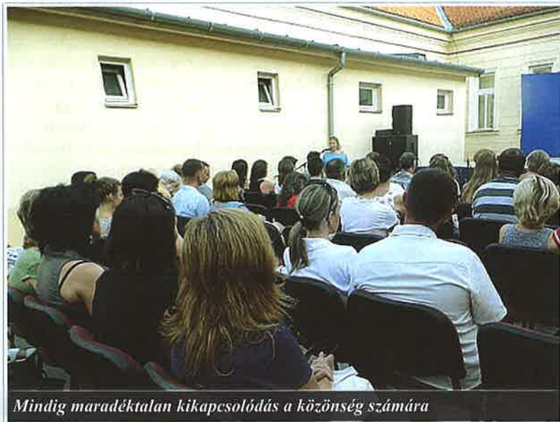
Mindig maradéktalan kikapcsolódás a közönség számára