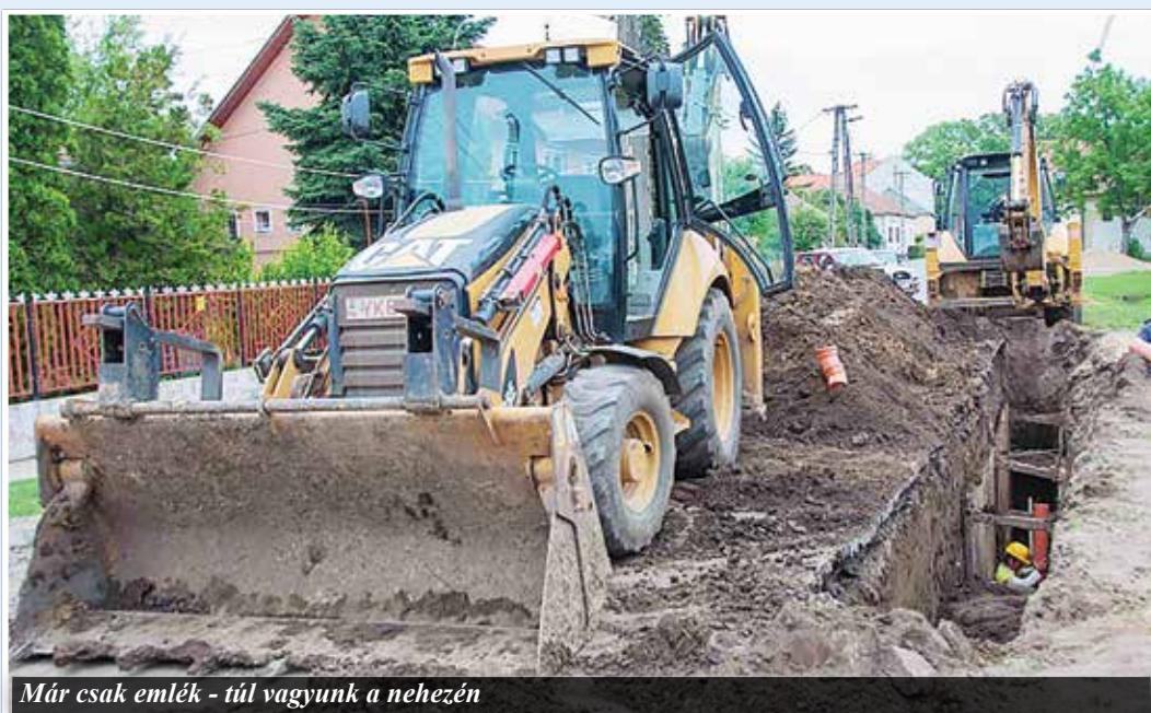
Már csak emlék - túl vagyunk a nehezén

- Egy ilyen drága és időben is elhúzó projekt legnagyobb tanulsága, hogy menet közben bármi bármikor megváltozhat (ideértve az állami akaratot, a törvénykezést, az életpénzforrások biztosítását, az építési szabályzatokat egyaránt). Kezdetben az állam feltételül szabta, hogy a lakosságtól gyűjtsünk önerőt, s ennek összege 270.000 Ft-ra jött ki, mely a vé-