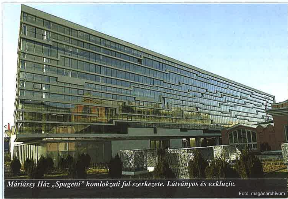
Mária Ház „Spagetti” homlokzati fal szerkezete. Látványos és exkluzív.