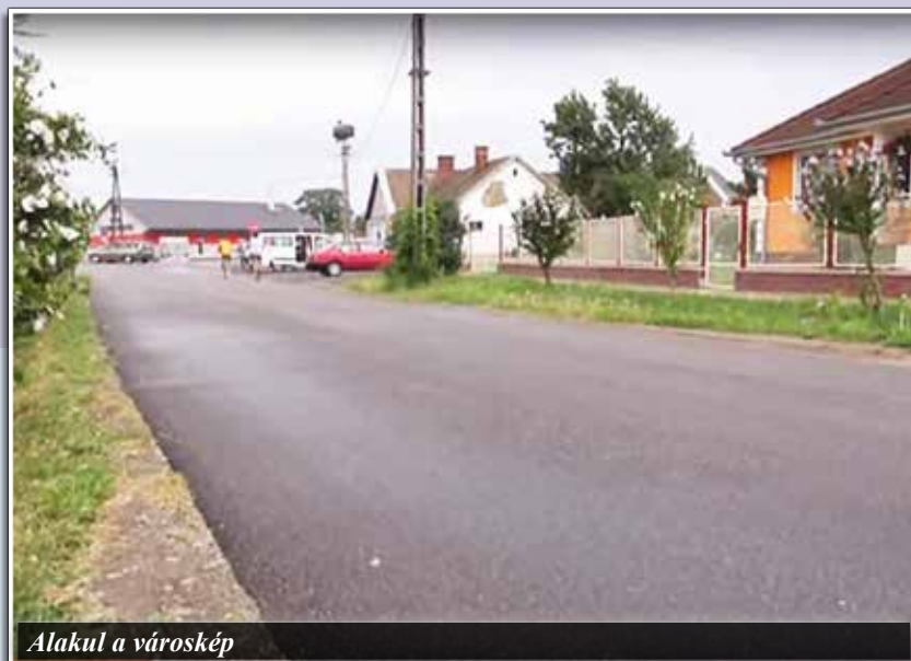
Alakul a városkép

A további tervekről elmondta még: az úthálózat korszerűsítése kiemelt feladata lesz az elkövetkező éveknek. Az önkormányzat idén 42 millió forint önerőt fordít aszfaltozására, egyelőre öt-