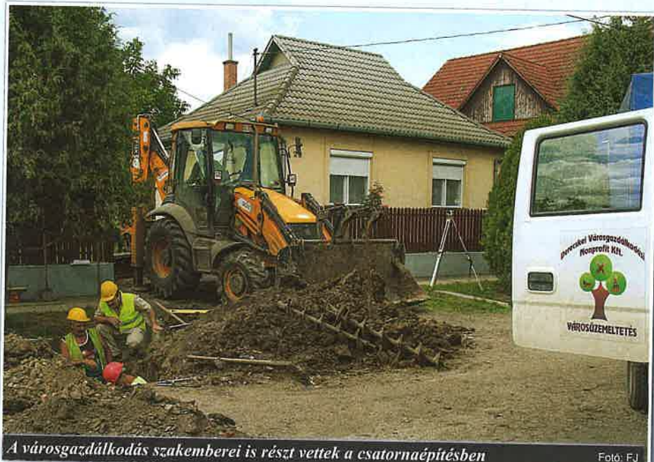
A városgazdálkodás szakemberei is részt vettek a csatornaépítésben