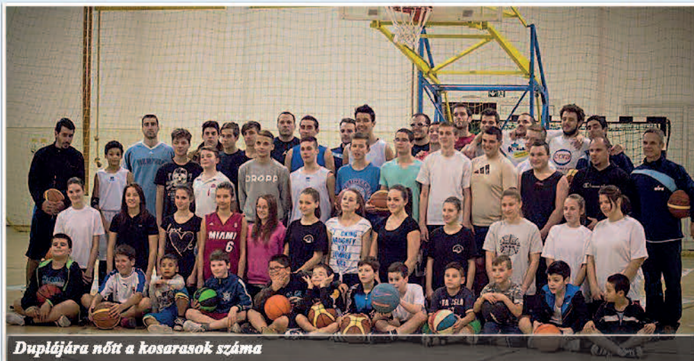
Duplájára nőtt a kosarasok száma