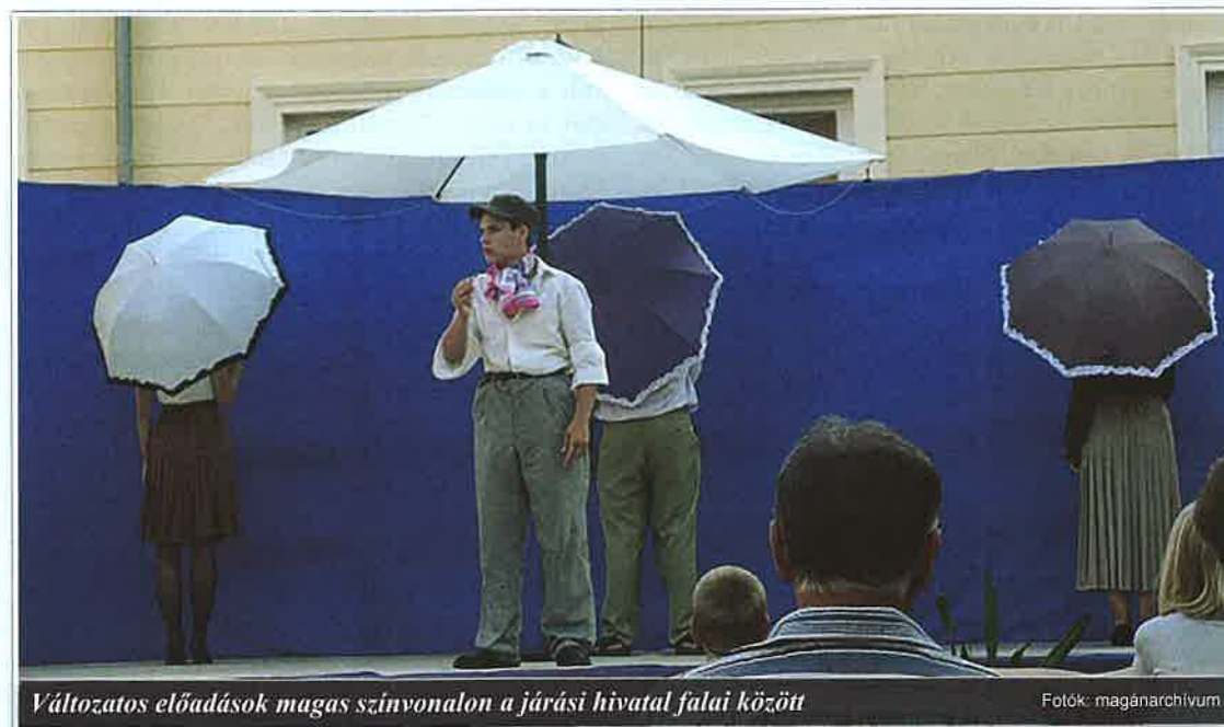
Változatos előadások magas színvonalon a járási hivatal falai között

A programsorozatban a debreceni Alföld Színpad prezentálta Molière: A megsúfolt férj című művét. A darab rendezője Sóvárgó Csaba, az Alföld Színpad ve-