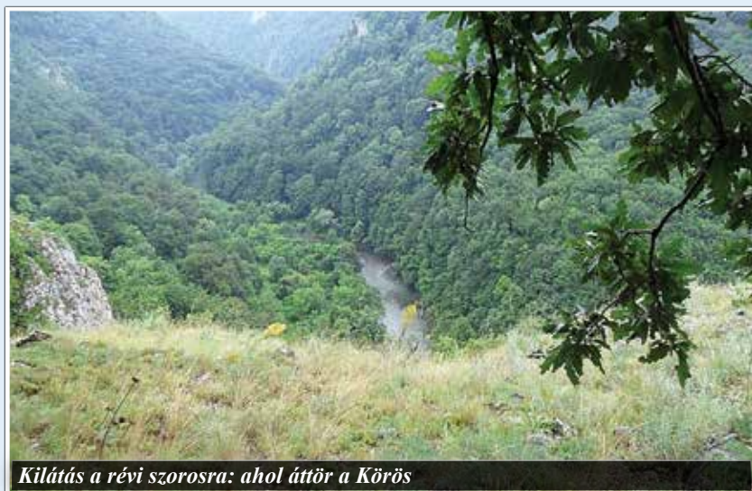
Kilátás a révi szorosra: ahol áttör a Körös

Az E60-as úton, Nagyvárád belvárosának kikerülésével indultunk Kolozsvár felé. Királyhágó előtt – Köröstopán - jobbra letértünk Rév majd Vársonkolyos irányába, a Sebes-Köröshöz.