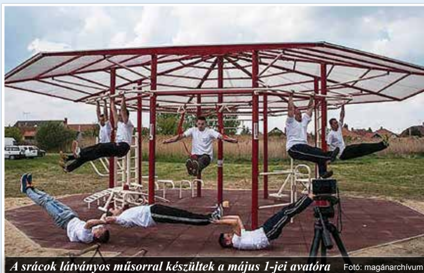
A srácok látványos műsorral készültek a május 1-jei avatóra