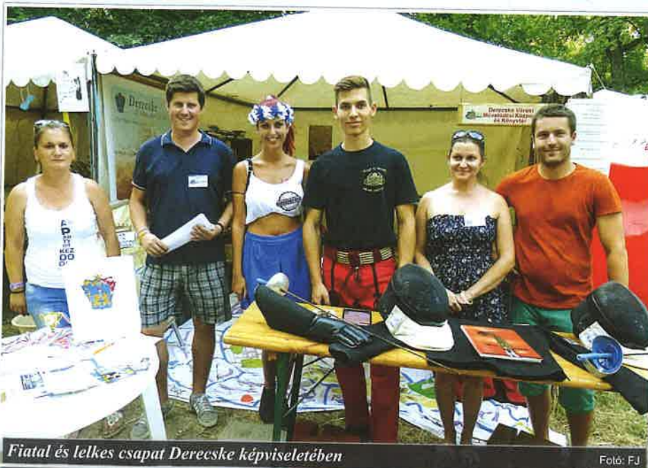
Fiatal és lelkes csapat Derecske képviseletében