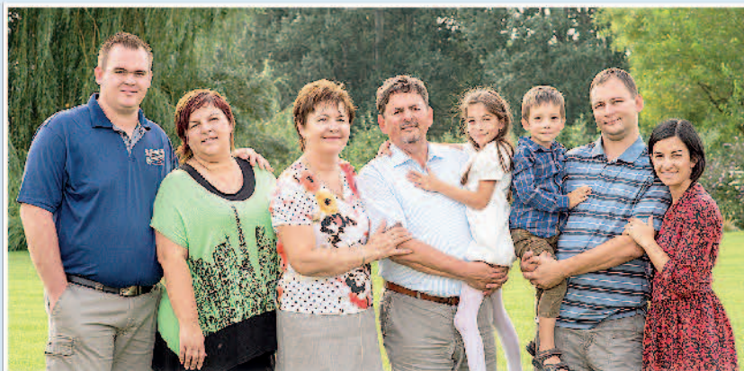
A Bold Agro Kft. 98%-a a család tulajdonában van, mára a fiatalok is bizonyították: felelősen és sikeresen irányítják a céget

- Először egy óvoda szeretett volna kilitogatni