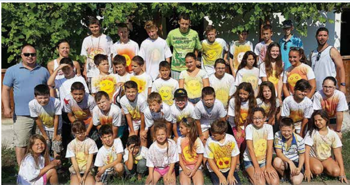
Harmincnegyzere derecskei gyerekek vett részt a táborban