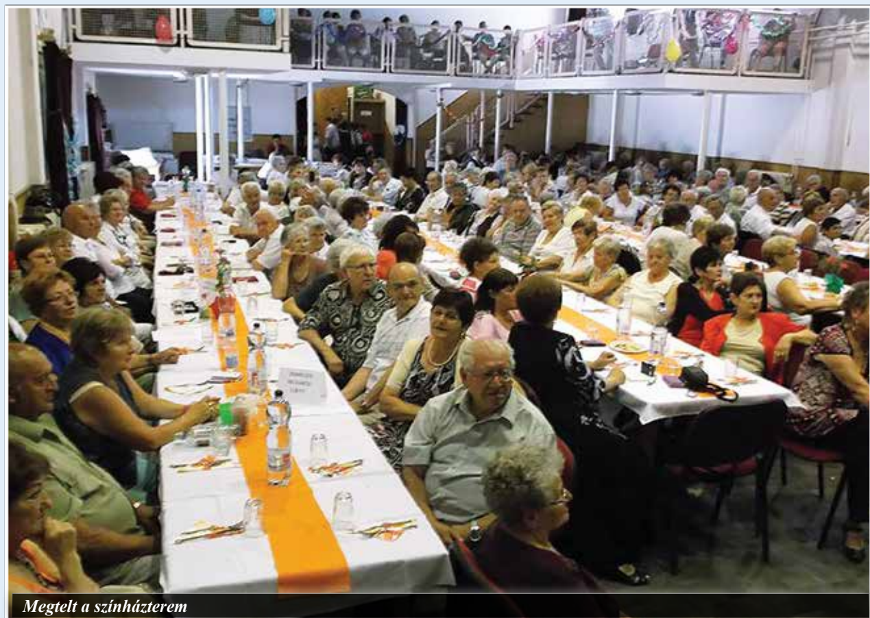
Megtelt a színházterem