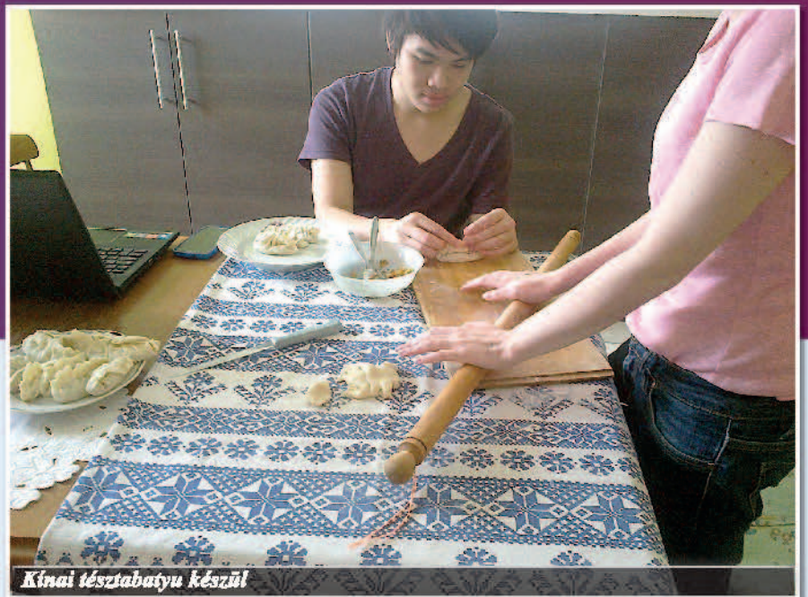
Kínai élesztőbáttyu készül

- Nagyon jól. Próbálok odafigyelni az órákon, ám most még nehéz, mivel a magyar nyelvű tárgyakat nem értem. Az angol viszont jól megy és itt a matematika a kedvenc tantárgyam. A judo órákon is részt ve-