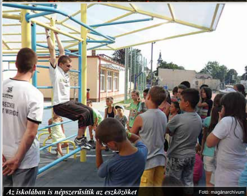
Az iskolában is népszerűsítik az eszközöket