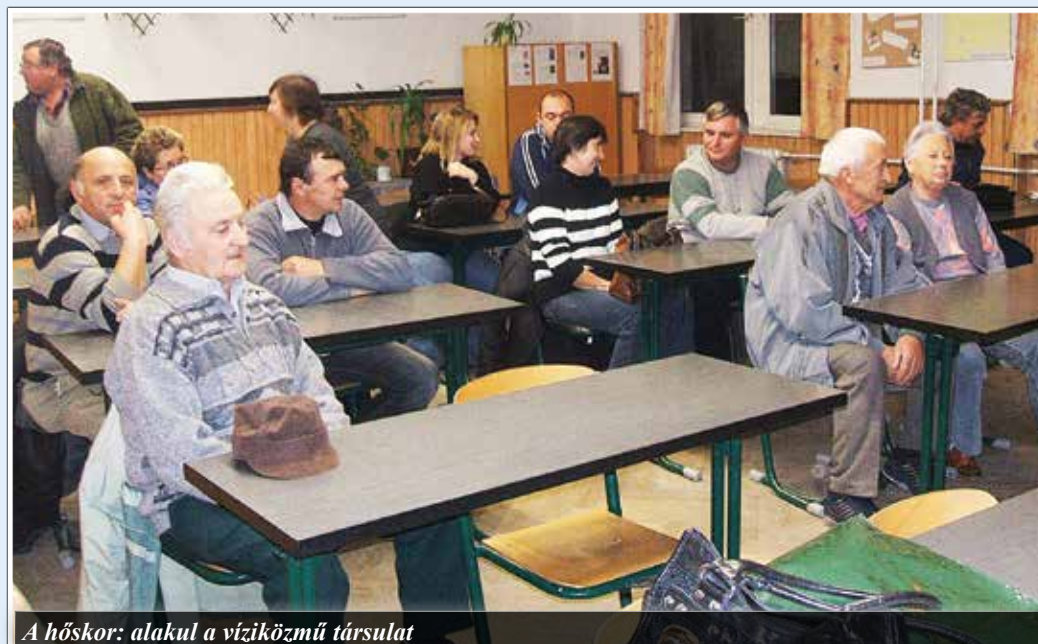
A hősor: alakul a víziközmű társulat