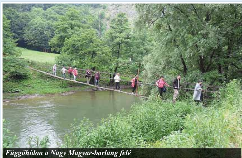
Függőhídon a Nagy Magyar-barlang felé