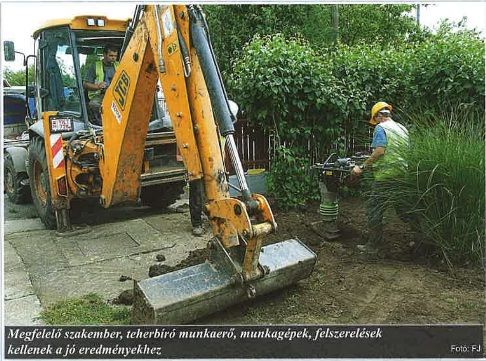
Megfelelő szakember, teherbíró munkaerő, munkagépek, felszerelések kellene a jó eredményekhez

- A kudarc a szükséges rossz. Szükséges, mert tanulsz