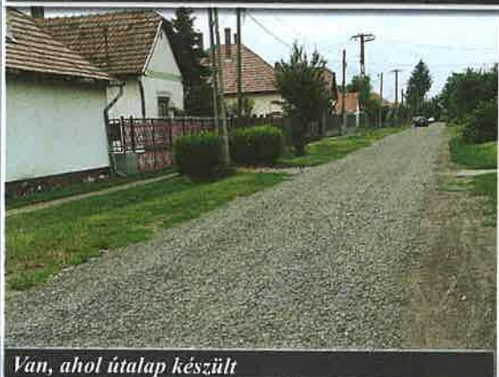
Van, ahol útalap készült