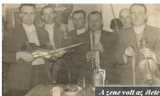
A zene volt az élete

Emlékezünk KOVÁCS ISTVÁNRA, a legendás Kovács Zenekar vezetőjének születése 95. és halála 20. évfordulójának alkalmából.