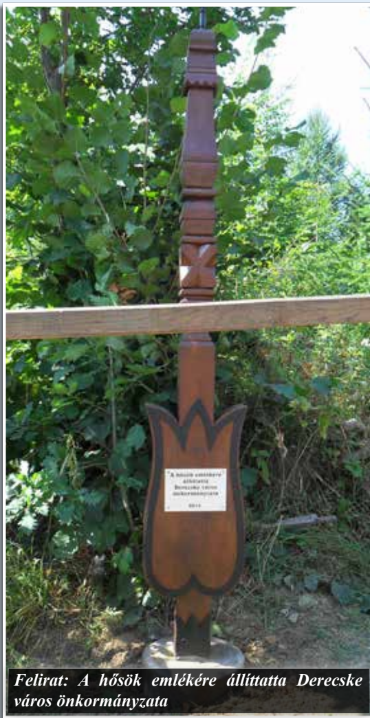
Felirat: A hősök emlékére állította Derecske város önkormányzata

Amikor ilyen nagy távolságra utazunk, érdemes megnézni a környező nevezetes helyeket, így válik