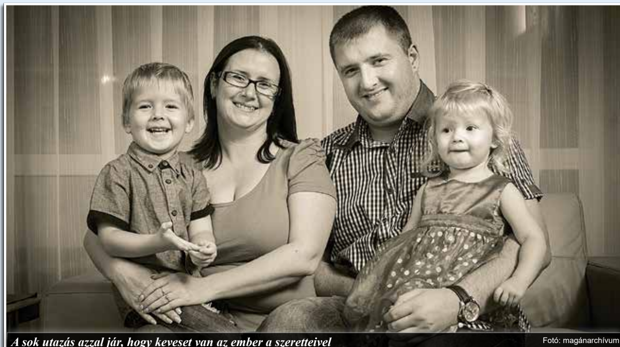
A sok utazás azzal jár, hogy keveset van az ember a szeretteivel