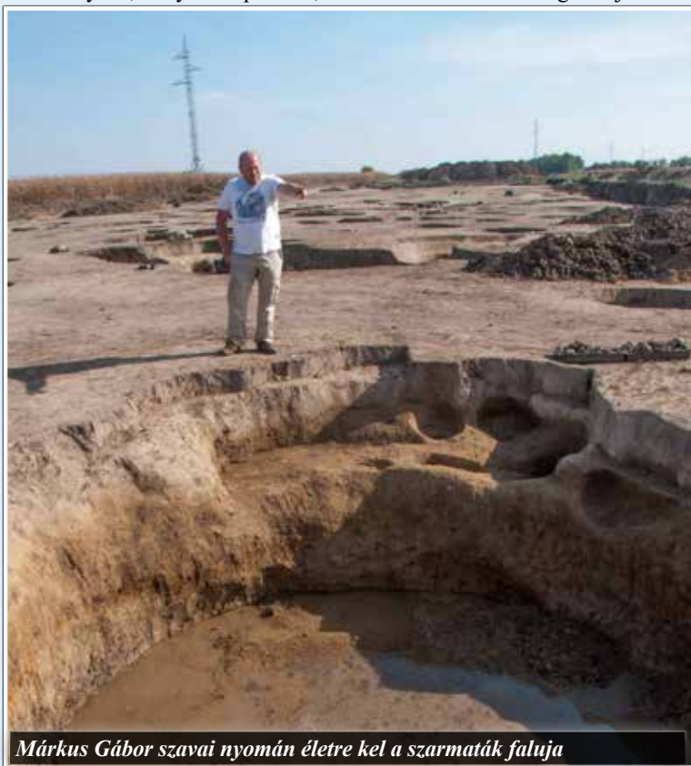
Márkus Gábor szavai nyomán életre kel a szarmaták faluja

désre csábította a vándorlás korabeli népeket, a szarmatákat, gepidákat, hunokat, avarokat, majd a honfoglaló törzseket. Derecske jelenlegi tájképe az ötvenes évek meliorációjának köszönhetően alakult ki, a régészeti leletek azonban geofizikai kutatás segítségével megtalálhatók, s ilyenkor, nagyobb építkezések idején a felszínre is kerülnek.