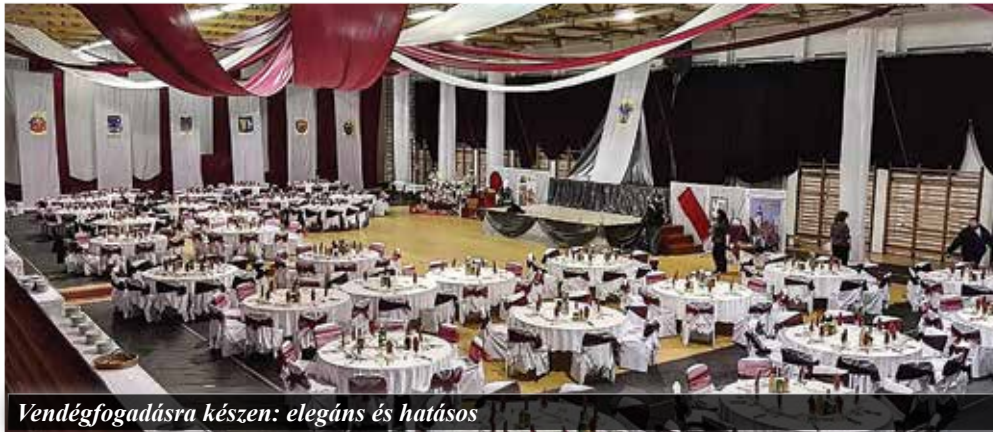
Vendégfogadásra készen: elegáns és hatásos