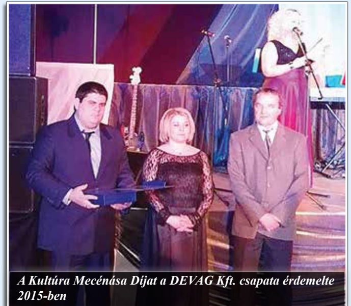
A Kultúra Mecénása Díjat a DEVAG Kft. csapata érdemelte 2015-ben