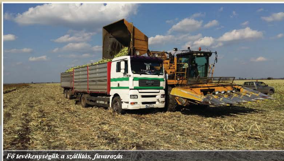
Fő tevékenységük a szállítás, fuvarozás

- Két állásban dolgoztam. Ha a műszak letelt a gépállomáson, mentem a térszbe délutánra, megvolt a munkatapasztalatom. Hamar megtanultam az önállóságot, mert rám szakadt, bíztam magamban, szerettem volna előbbre jutni. Az elmúlt másfél évtizedben bizonyítottam, hogy megérte a kockázatot vállalni, mert megbízhatók vagyunk, megcsináljuk, amit vállaltunk. Nem ígérek olyat, amit nem tudok teljesíteni, ilyen még soha nem fordult elő. Fontos,