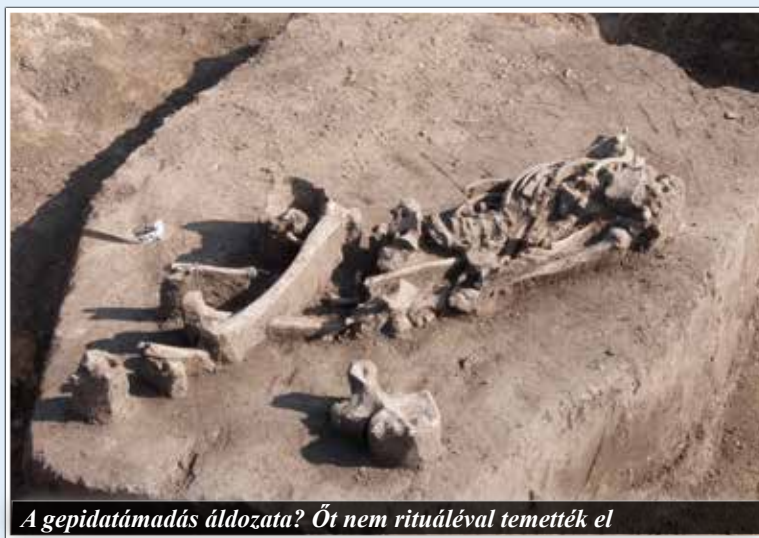
A gepidatámadás áldozata? Őt nem rituáléval temették el