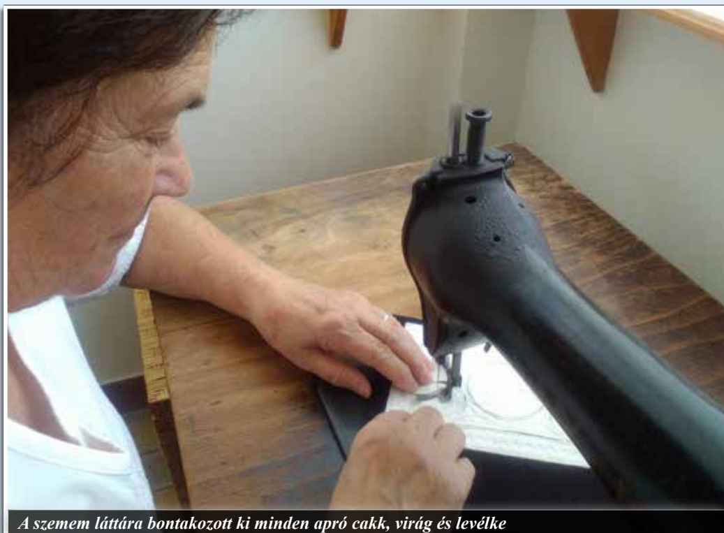
A szemem láttára bontakozott ki minden apró cakk, virág és levélke

Legutóbb a „Kítettük a szűrét” pályázatra küldte el munkáit, NESZ fődíjat kapott, 2015 őszén öt alkotásával szerepelt a Néprajzi Múzeum Élő