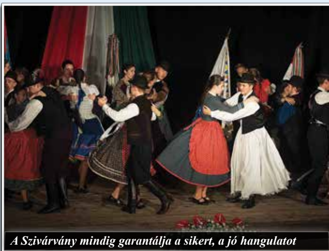
A Szivárvány mindig garantálja a sikert, a jó hangulatot