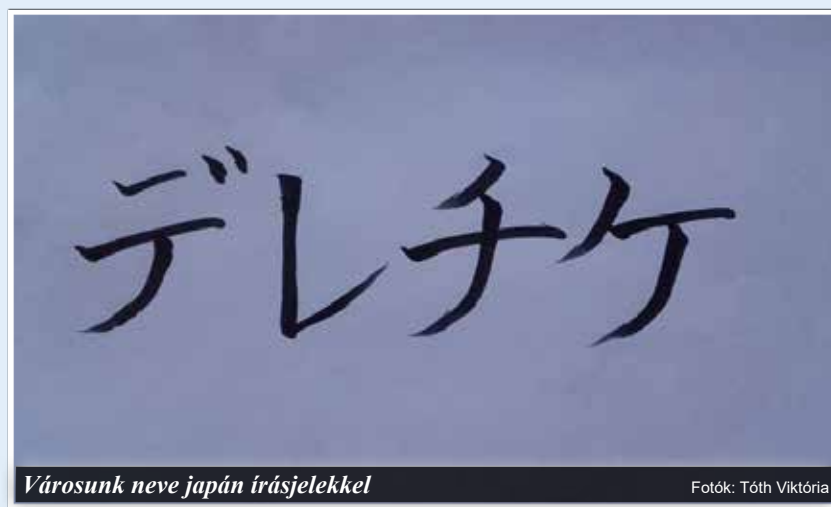
Városunk neve japán írásjelekkel

vagy épp kvíz szakkör közül. Körülbelül kéthetente szombatnapon is van tanítás. Az iskolát a diákok takarítják, ugyanis a japánoknál fontos a munkára nevelés, a környezetvédelem, a megbecsülés. Nagy hangsúlyt fektetnek továbbá a természet védelmére. Japánban kb. 1000 földrengés van évente, ezért a suliban tanítják, hogy mit kell tenni egy-egy ilyen természeti katasztrófa esetén. (Asztal alá kell bújni és megfogni az ellentétes asztallábakat.) Viselünk egyenruhát is. Ez lányoknál térdig érő szoknya, vagy épp nadrág és zakó, melyet fehér, rózsaszín vagy szürke inggel viselhetnek. Testnevelés órára külön egyenmelegítőnk van. Japánban csak két és fél hét a nyá-