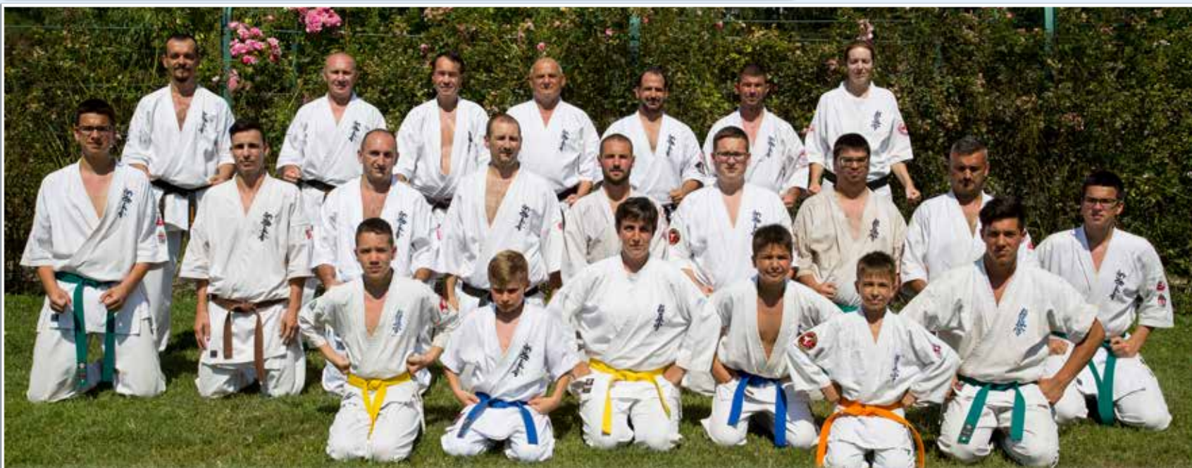
A táborban tizenöt derecskei öltötte fel karateruháját, és vett részt a napi három edzésen, a Balaton partján