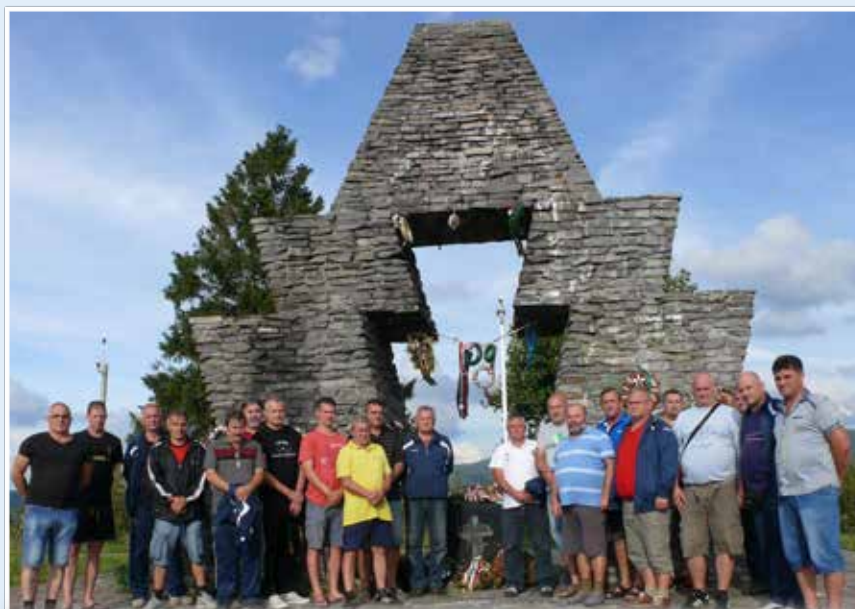
A vereckei emlékmű megkoszorúzásra került

Innen utunk hazavezetett. Ismét rengeteg élménnyel, ismerettel gazdagodtunk. Úgy gondoljuk, egy-