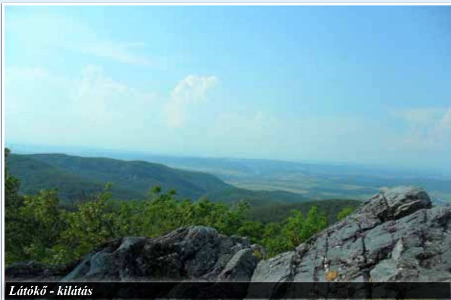
Látókő - kilátás

Ezeket, és az ehhez hasonló útvonalakat a Cartographia – Bükk turistatérkép segítségével bárki megtervezheti és bejárhatja.