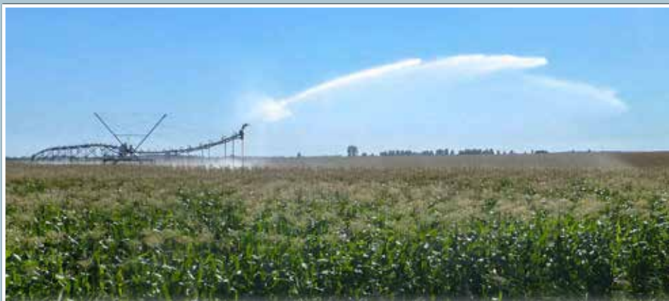
Minden gazdának megadatik majd: öntözés a derecskei határban