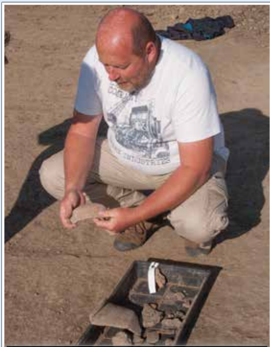
A leleteket dokumentálják, restaurálják, vizsgálják

désre csábította a vándorlás korabeli népeket, a szarmatákat, gepidákat, hunokat, avarokat, majd a honfoglaló törzseket. Derecske jelenlegi tájképe az ötvenes évek meliorációjának köszönhetően alakult ki, a régészeti leletek azonban geofizikai kutatás segítségével megtalálhatók, s ilyenkor, nagyobb építkezések idején a felszínre is kerülnek.