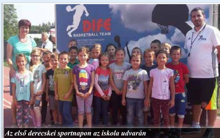
Az első derecskei sportnapon az iskola udvarán