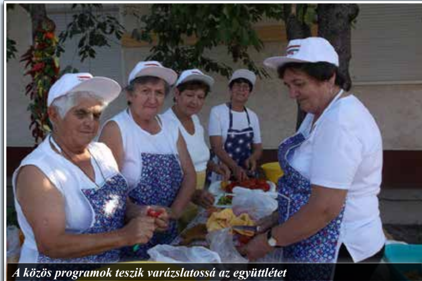
A közös programok teszik varázslatossá az együttléte