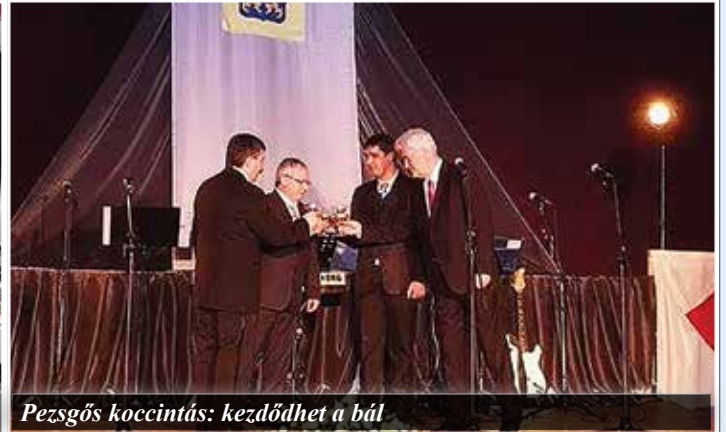
Pezsgős koccintás: kezdődhet a bál