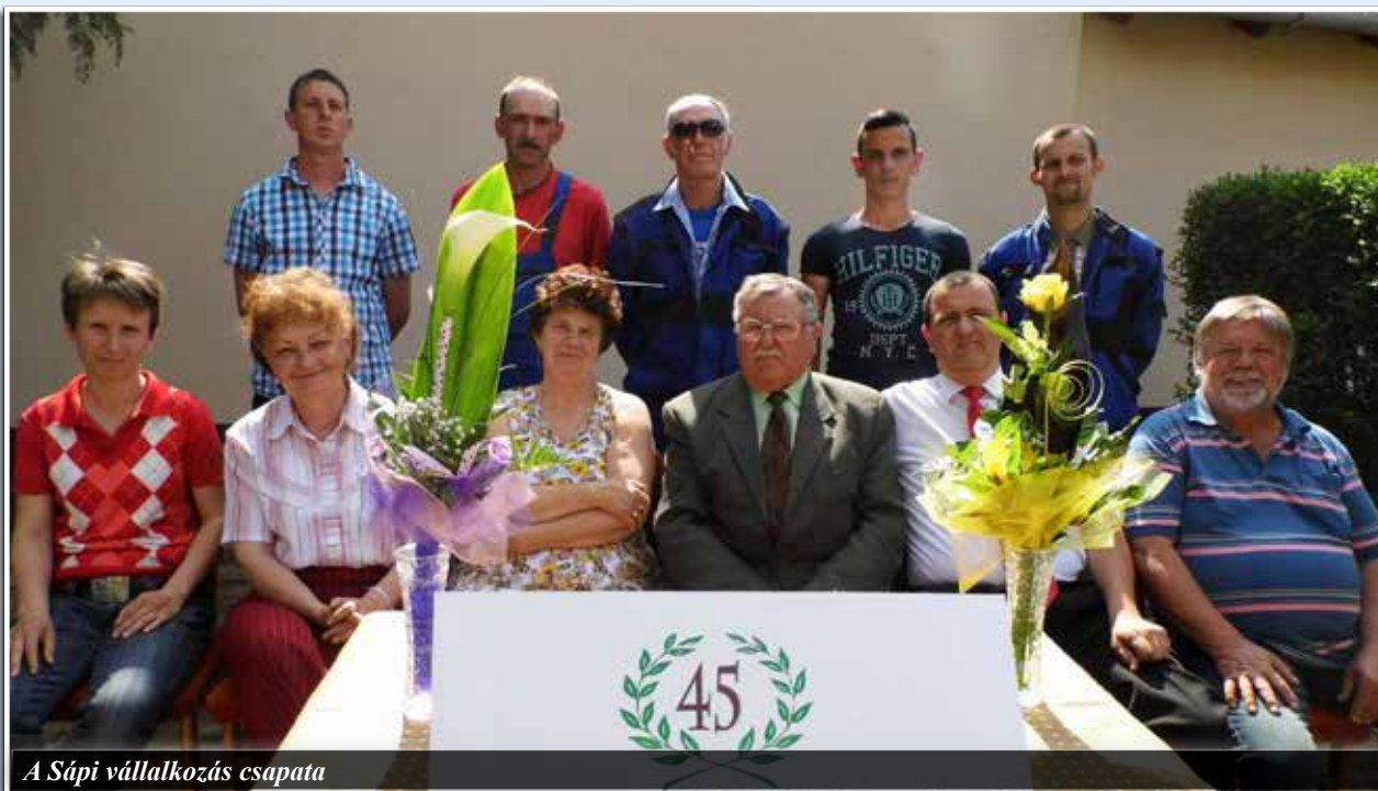
A Sági vállalkozás csapata