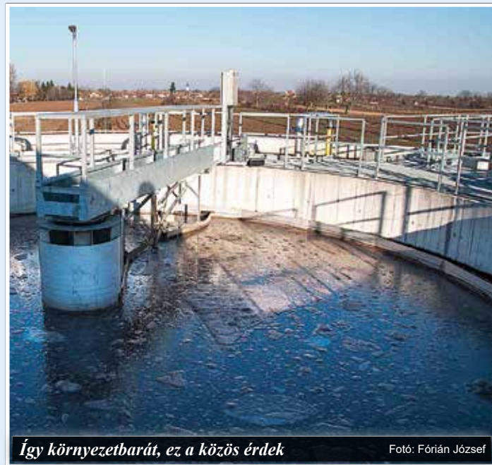
Így környezetbarát, ez a közös érdek