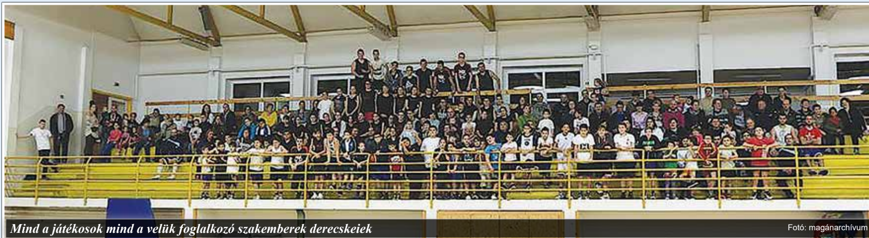
Mind a játékosok mind a velük foglalkozó szakemberek derecskeiek

A Derecske Ifjúságáért Egyesület ismét egy kiemelkedően jó éven van túl. 2015-ben folytattuk csapatainkkal az előző években megkezdett munkát. Újonnan megalakult lány és kenguru csapatunk is szépen fejlődött, és egyre többen kezdték el a kosárlabdázást Derecskén. Kadett és felnőtt csapatunk a megszokott edzőkkel folytatta a felkészüléseket az előttük álló mérkőzésekre, tornákra.