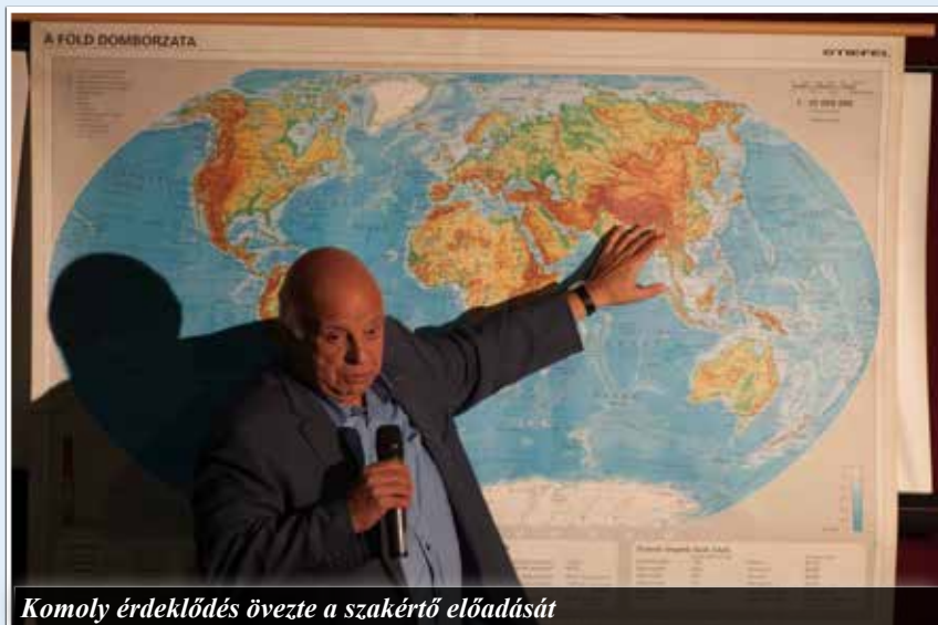
Komoly érdeklődés övezte a szakértő előadását