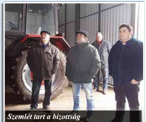
Szemlét tart a bizottság