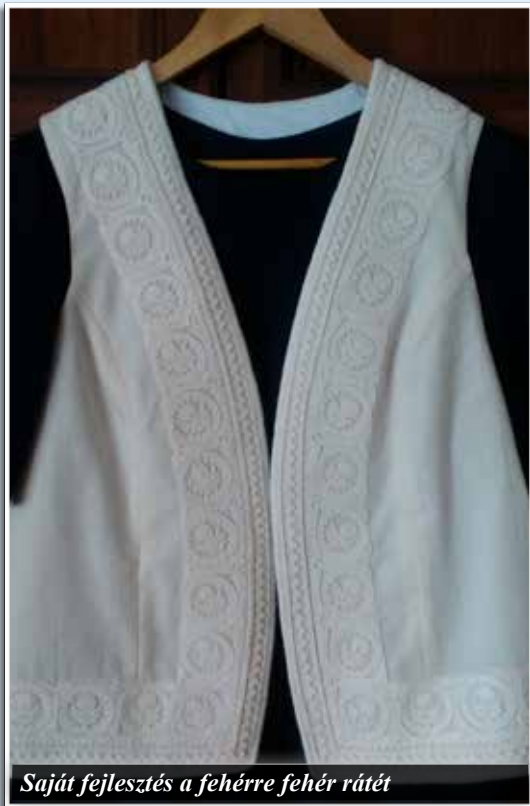
Saját fejlesztés a fehérre fehér rátét