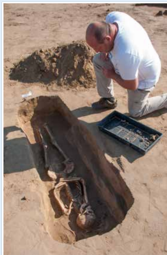
Csak a koporsó maradványai enyésznek el