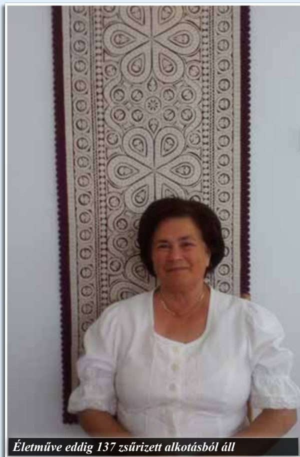
Életműve eddig 137 zsűrizett alkotásból áll