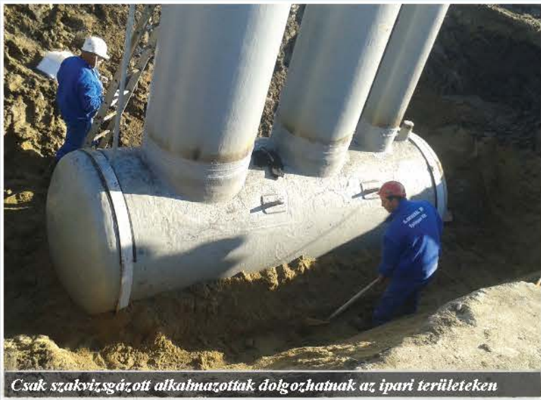
Csak szakvizsgázott alkalmazottak dolgozhatnak az ipari területeken

lásokat, olaj-sav- és lúgálló műgyantázásokat, szikramentes-antisztatikus betonterek készítését végezzük.