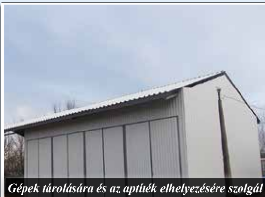
Gépek tárolására és az apríték elhelyezésére szolgál

A mezőgazdasági program keretein belül, körülbelül 8 200 000.- Ft-ból, 50%-a volt uniós támogatással épült meg az új tárolóépület, melyre nagy szüksége volt a városgazdálkodási kft.-nek. Egyrészt a mezőgazdasági közmunka program keretében foglalkoztatottakat helyezik el itt, de ez a tároló fogadja be a biomasszakázánokhoz szükséges aprítékot is, melyek három nagy intézmény, a polgármesteri hivatal, az általános iskola és a kft. főépületét fűtik. Az épület zárt része géptárolásra szolgál. Az épület átadásán megjelent Nagy András a Belügyminisztérium államtitkárságának koordinátora, Bakó István polgármester valamint a településfejlesztési bizottság tagjai.