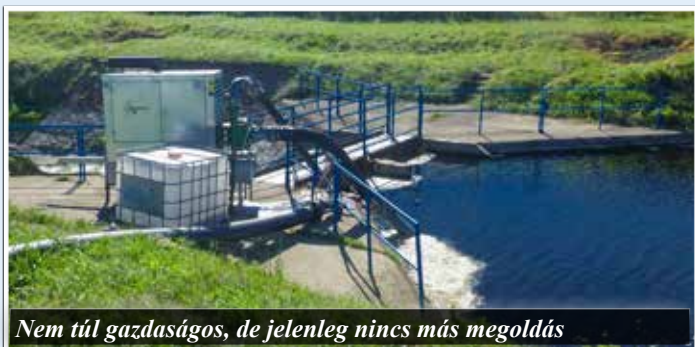
Nem túl gazdaságos, de jelenleg nincs más megoldás

mára az állandó öntözést, akár egyszerre is. Összességében duzzasztókra, a főcsatorna eredeti állapotának helyreállítására, szigetelésre, vízkormányzók és tisztítóaknak építésére és a Kösely-Hajdúszováti átmetszés rekonstrukciójára van szükség. A rendszer teljes kiépülése az öntözésen kívüli időszakban tározást is lehetővé tenne, ezzel tovább nőhet a kapacitás.