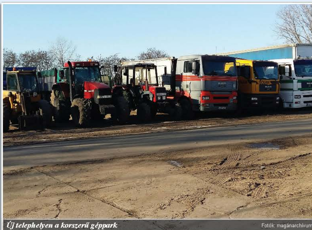
Új telephelyen a korszerű géppark