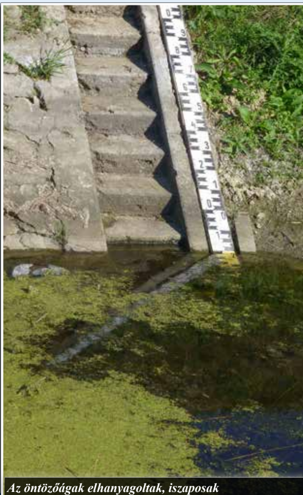
Az öntözőágak elhanyagoltak, iszaposak