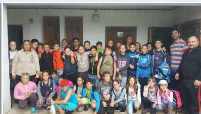
Köszönjük, hogy ott lehettünk! „