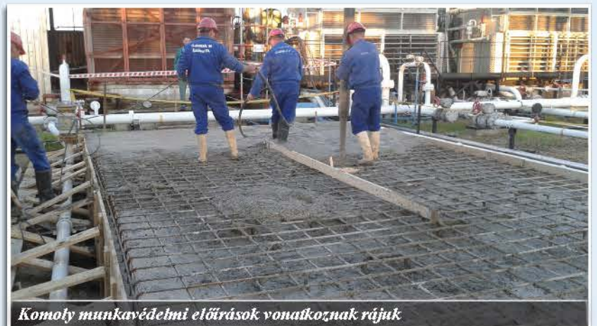
Komoly munkavédelmi előírások vonatkoznak rájuk