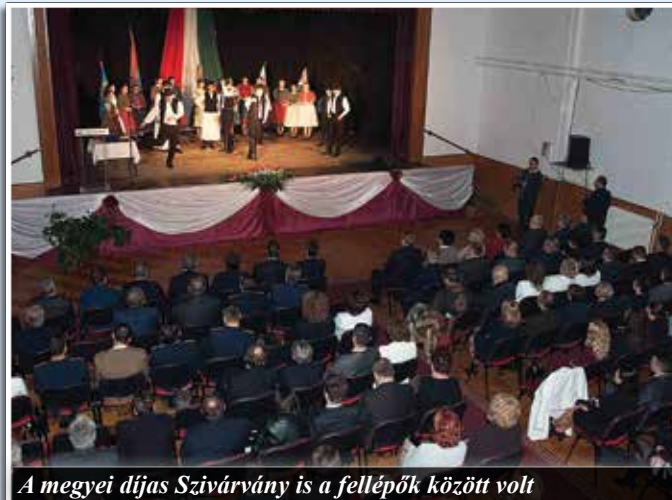
A megyei díjas Szivárvány is a fellépők között volt