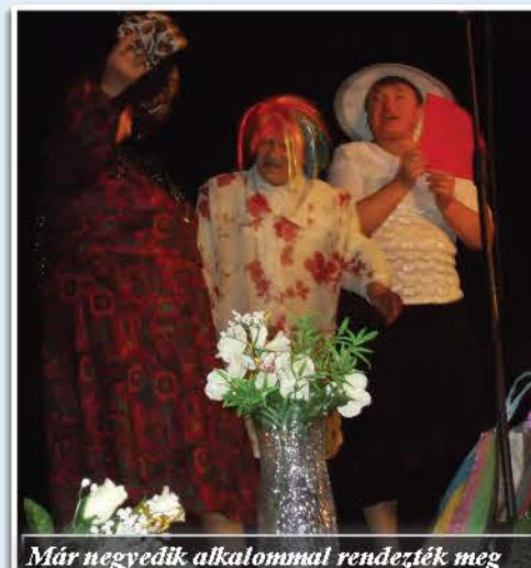
Már negyedik alkalommal rendezték meg