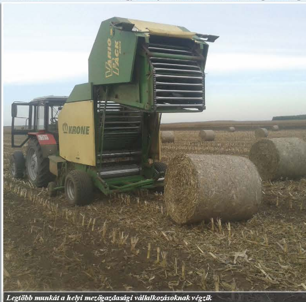
Legtöbb munkát a helyi mezőgazdasági vállalkozásoknak végzik

A továbbfejlődéshez mindenképpen szükséges egy új telephely építése, melyhez a Széllakásban meg is találta a megfelelő területet. Egyelőre információkat gyűjt a telephelyfejlesztéssel kapcsolatos pályázati kiírásokról, a szükséges engedélyek megszerzéséről, s utána várhatóan belevág egy, a gépei számára ideális állomáshely kialakításába.