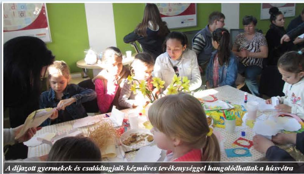
A díjazott gyermekek és családtagjaik kézműves tevékenységgel hangolódhattak a húsvétra

A rendezvényen kicsik és nagyok is egyaránt jól érezték magukat.