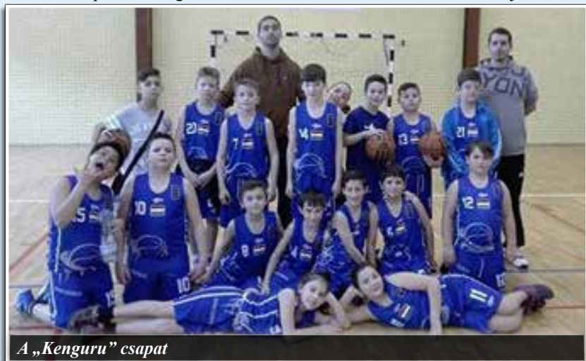
A „Kenguru” csapat