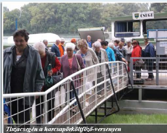
Tiszacsegén a harcsapörköltfőző-versenyen

Köszönjük polgármester úrnak és a képviselő testületnek a 2015. évben nyújtott anyagi támogatást, valamint a művelődési központ vezetőjének és dolgozóinak segítőkészségét, hogy helyet biztosítanak rendezvényeink, próbáink, összejöveteleink számára.