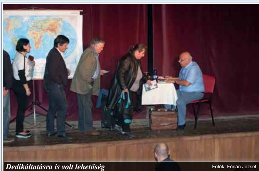
Dedikáltatásra is volt lehetőség