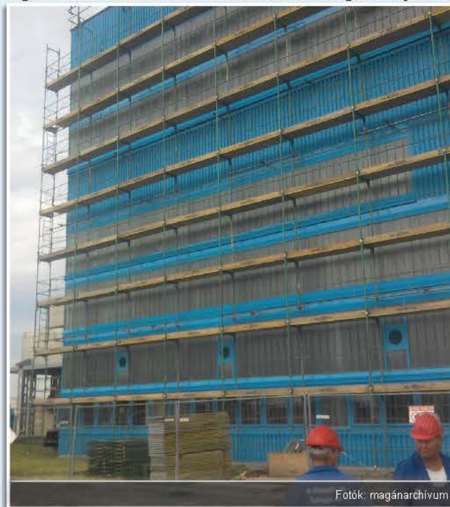
Az ügyvezetők: apa és fia

- A munkaterületeken sokszor megosztva dolgozunk, akár egyszerre két-háromfelé, és emellett jelentős az adminisztrációs munka is. Én is csak azt tudom mondani, hogy édesapám segítségével nélkül nagyon nehéz dolgom lenne.