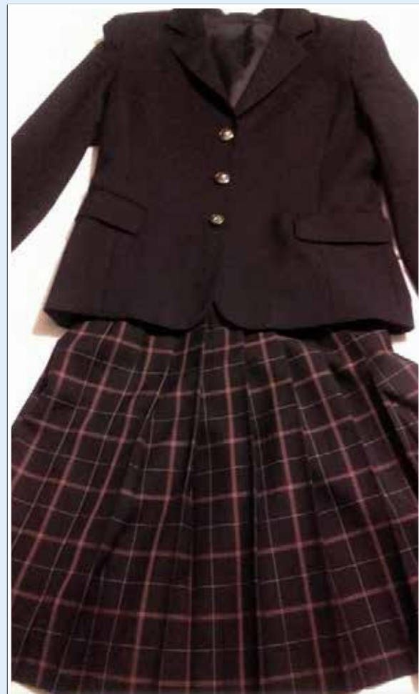
A japán iskolai egyenruha

- Könnyen megtaláltad vendéglátóiddal a közös hangot?