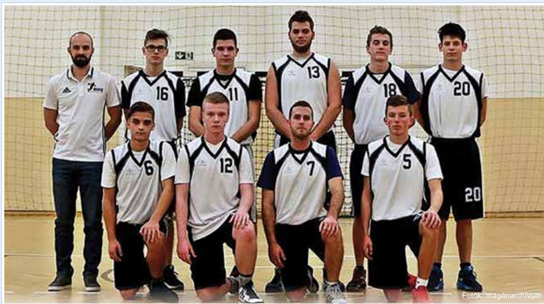
November vége örömtelire sikerült. Felnőtt csapa-

Pályázatot adtunk be a következő kenguru kupa megrendezésére, amit sikeresnek nyilvánítottak. Ennek eredményeképpen december 10-én Derecske városa először rendez meg az országos kosárlabda bajnokság területi fordulóját.