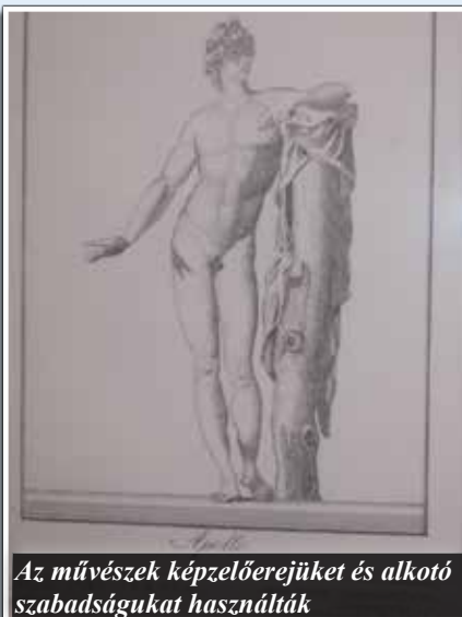
Az művészek képzelőerejüket és alkotói szabadságukat használták