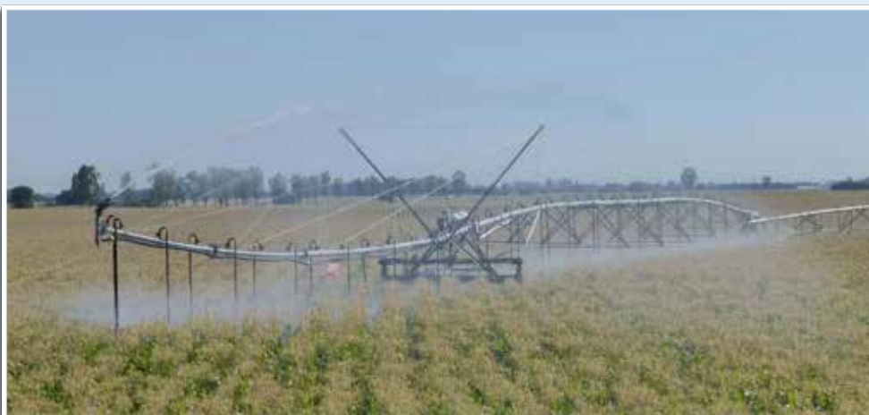
Tervezhető vízmennyiségre van szükség a versenyképesség megtartásához

- A vállalkozók nemcsak együttműködést és támogatást várnak az önkormányzattól, hanem maguk is hajlandók anyagi áldozatra, ha a saját és a közös érdek úgy kívánja. Mikor elkészült az első szakasz engedélyes terve, a hat legnagyobb mezőgazdasági vállalkozás képviselői megállapodtak abban, hogy nagyon fontos az öntözésfejlesztés kiterjesztése a déli területekre is, ezért közös összefogással, minden vízjogi engedéllyel rendelkező gazdálkodó bevonásával, saját erőforrásból elkészítetik a második szakasz engedélyes terveit is. A huszonegy millió forintnyi bekerülési költséget a jelenleg is öntözött saját területek arányában osztották meg. A második ütem engedélyes tervei várhatóan még ebben az évben elkészülnek. A tervek birtokában a TIVIZIG mint tulajdonos, üzemeltető sikerrel pályázhat majd állami forrásokra a második szakasz megvalósítása érdekében. Bízunk benne, ennek megvalósulása hamarosan követi az első szakasz megépülését.