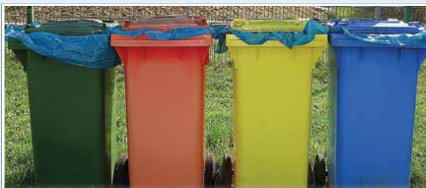
Egyszer a zsákokat is felváltja majd egy szelektív hulladék gyűjtésére alkalmas edényzet