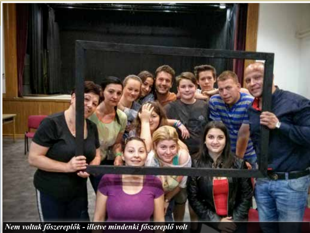
Nem voltak főszereplők - illetve mindenki főszereplő volt