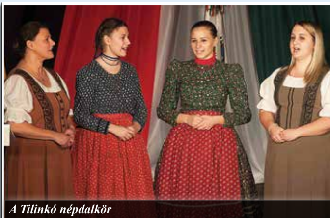
A Tilinkó népdalkör