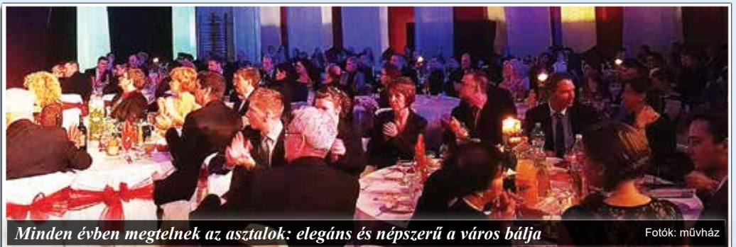
Minden évben megtelnek az asztalok: elegáns és népszerű a város bálja