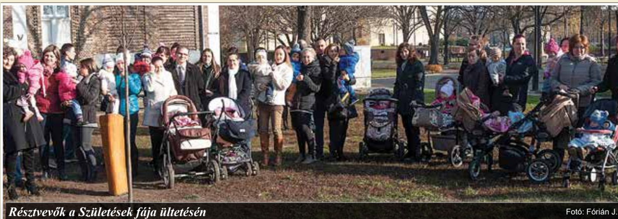
Résztevők a Születések fája ültetésén