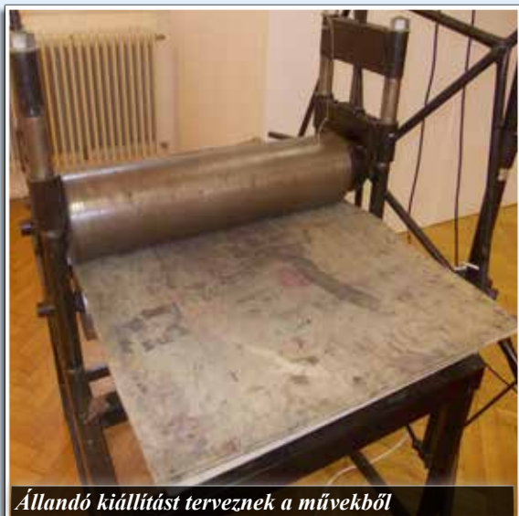
Állandó kiállítást terveznek a művekből