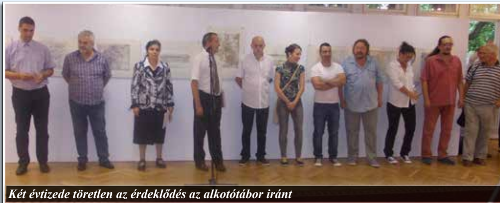
Két évtizede töretlen az érdeklődés az alkotótábor iránt