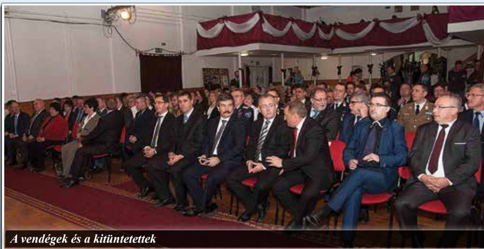
A vendégek és a kitüntetettek