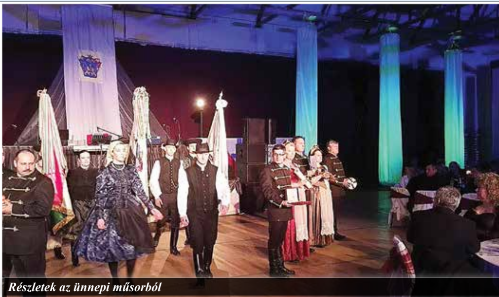
Részletek az ünnepi műsorból