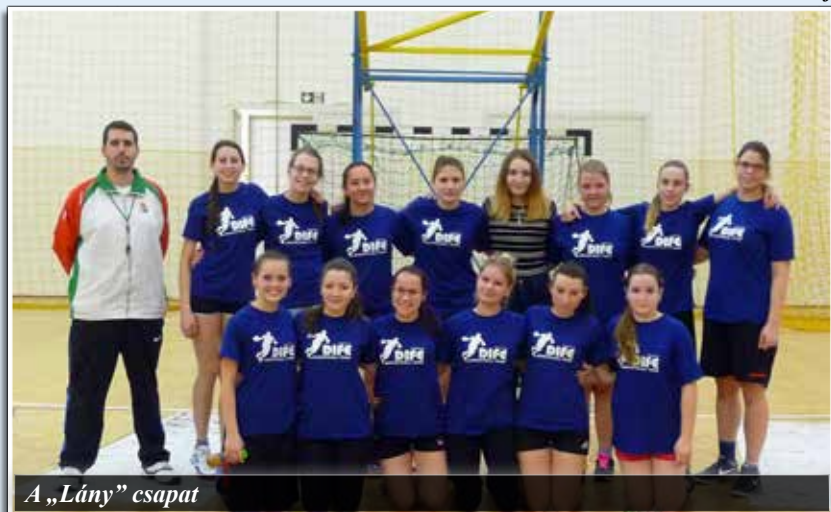
A „Lány” csapat