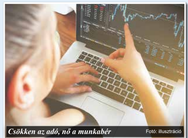
Csökken az adó, nő a munkabér

A munkavállalók megbecsüléséhez tartozik a már nyugdíjban lévők juttatásainak emelése is. 0,9% helyett 1,6% lett a nyugdíjmelés, mely majd az infláció mértékét is követni fogja. Minden nyugdíjas 10.000 Ft Erzsébet-utalványt kap a megszüntetett 13. havi