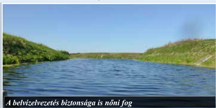
A belvízelvezetés biztonsága is nőni fog

Aki mezőgazdaságból él, tudja, minél inkább a kiszámíthatóságra kell törekedni.