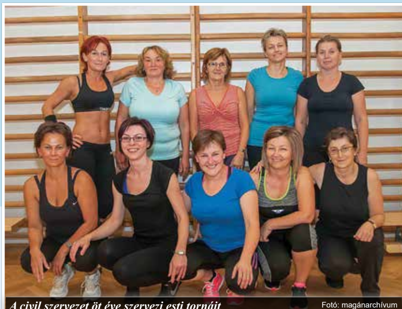
A civil szervezet öt éve szervezi esti tornáit

Szó volt a testmozgás és a táplálkozás kölcsönhatásáról, arról, hogy a táplálkozás megvonása többet árt, mint használ. A hasznos tápanyag a szervezet számára létszükséglet. Mindkét előadás lényeges mondanója volt, hogy a kiegyensúlyozott életnek, a hatékony konfliktuskezelésnek fontos része a megfe-