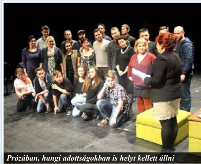
Prózában, hangig adottságaikban is helyt kellett állni

nés színház felé induljunk. A Képzelt riport egy amerikai popfesztiválról zenéjét a társulat választotta. Aztán közösen dolgoztuk ki a sémát, a jelenségeket. A zenét és a prózát összehangoltam, így megszületett a darab. Ehhez persze hatalmas segítséget nyújtottak a helyi művészeti iskola zenetanárai, akik élőzenével kísérték a darabot. A cselekmény különálló történetekből áll össze, amelyeknek a számai mégis egybefutnak. Ezek saját életünkből vett vagy hallott, illetve kitalált történetek, a Képzelt riport egy amerikai