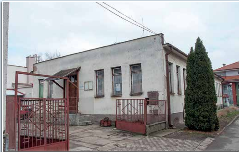
A könyvtár épülete 2018-ban