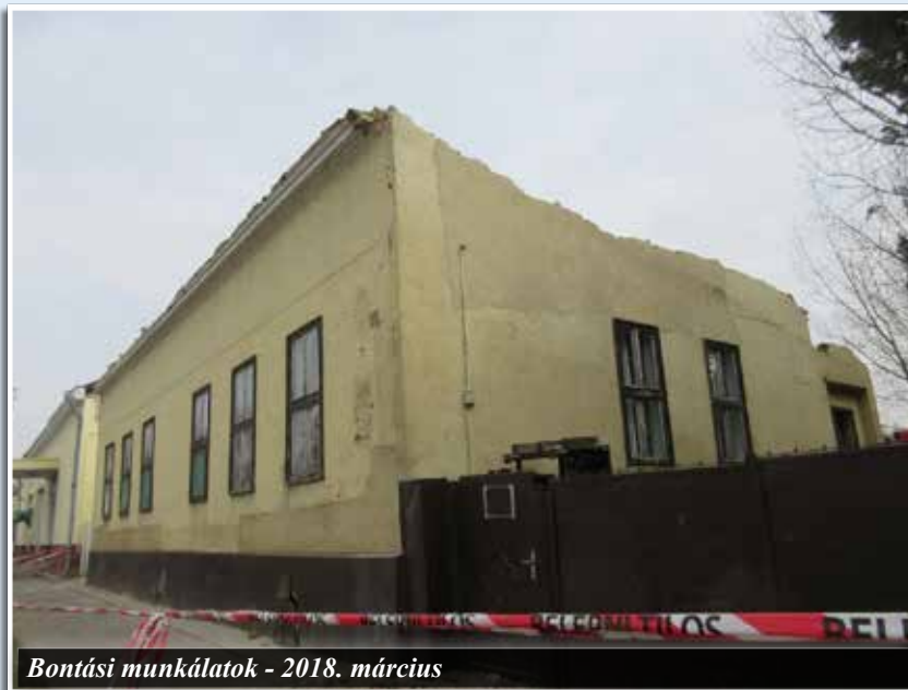
Bontási munkálatok - 2018. március