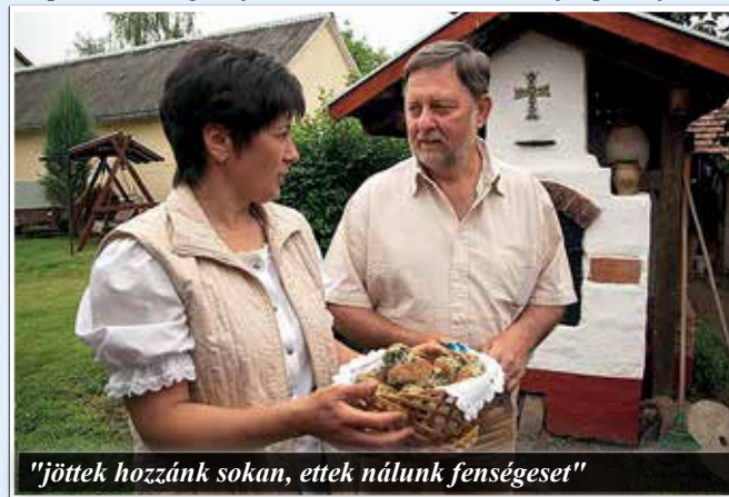
"jöttek hozzánk sokan, ettől nálunk fenségeset"

A Derecskei Fenséges márkanév ismertté vált. A budapesti Lehel piacon ugyanúgy keresett termék, mint a rangos vidéki termelői piacokon. Céges ajándékként