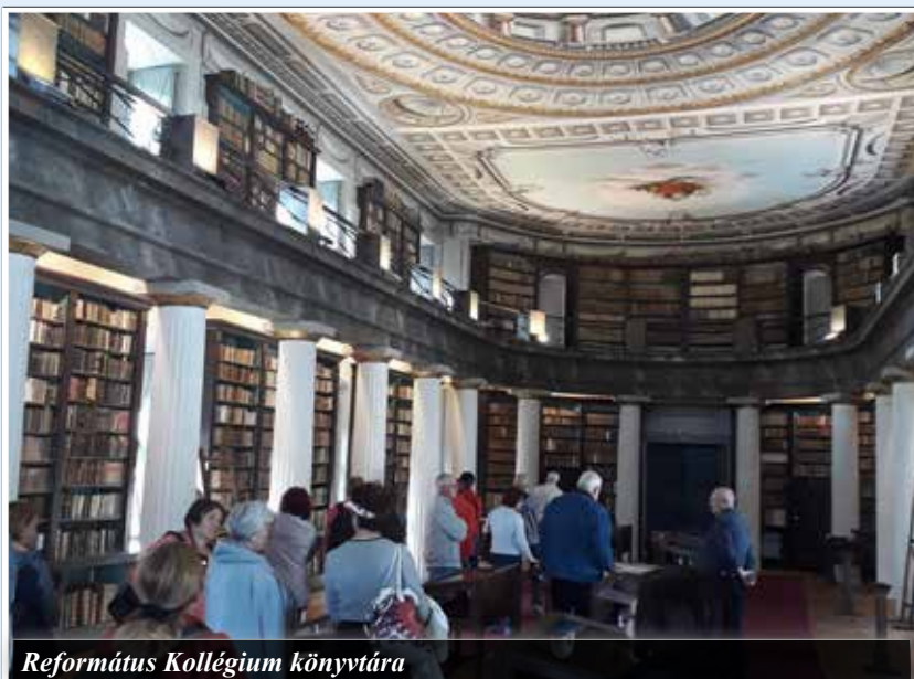
Református Kollégium könyvtára