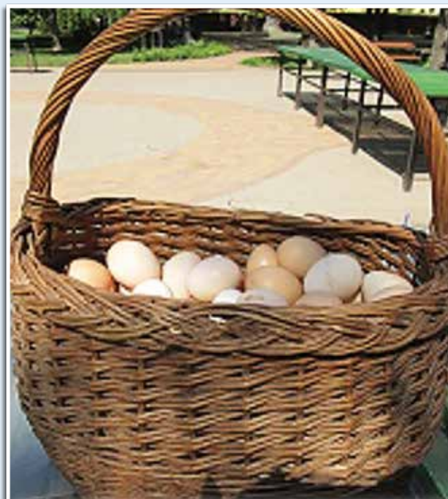
Friss tojás a piacon karos kaskában