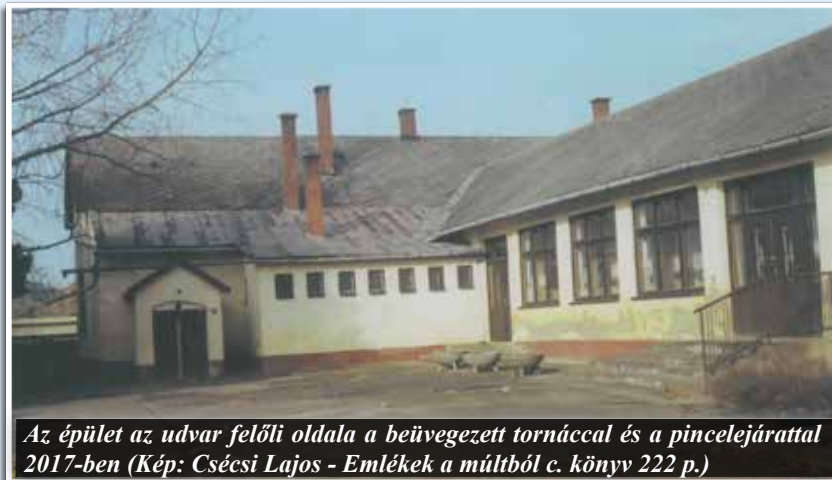
Az épület az udvar felőli oldala a beüvegezett tornáccal és a pincelejárattal 2017-ben (Kép: Csécsi Lajos - Emlékek a múltból c. könyv 222 p.)

ruházati áruházat építettek és a Gála elnevezést kapta. Ettől kezdve lett az óvoda a „Gála melletti”. 1975-ben a Kinizsi úti óvoda mögé egy 100 férőhelyes (erről kapta a nevét) szárny épült, így az új óvoda lett az I. számú, a „Gála” melletti épület lett a II. számú Napközi Otthonos Óvoda. Az elmúlt száz év során voltak átalakítások, többek között a vakolatdíszek eltávolítása és a téglaoszlopos tornác beüvegezése az 1980-as évek közepén. Ezek a munkálatok, haszná-