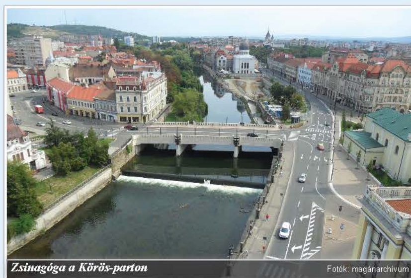
Zsinagóga a Körös-parton

Az előbb említett várral kezdtük az ismerkedést. Néhány hónapja már futólag körbenéztünk, most több időnk volt, átböngészünk a vár történetét is. Majd ezer évvel ezelőtti I. László magyar irányú monostort alapított a vár helyén, de a tatárjárás után kőfallal erősítették meg. Falain belül jelentős vallási és kulturális élet folyt könyvtárral, csillagvizsgálóval, nyomdával és iskolával. Azután, évszázadokon keresztül hol elpusztult, hol újjáépítették. Többnyire hadicélokot szolgált, de őriztek itt hadifoglyokat, működött csendőriskola és nagykereskedelmi raktárként is funkcionált. A jelenlegi felújítást követően a megújult épületekben múzeumok, kőtár, a céhek utcája és egy többfunkciós kulturális tér is helyt kapott. „Katolikus templomában és temetőjében hét király