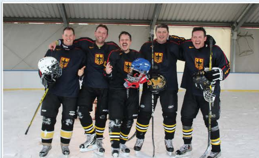
A 2017-es bajnokcsapat