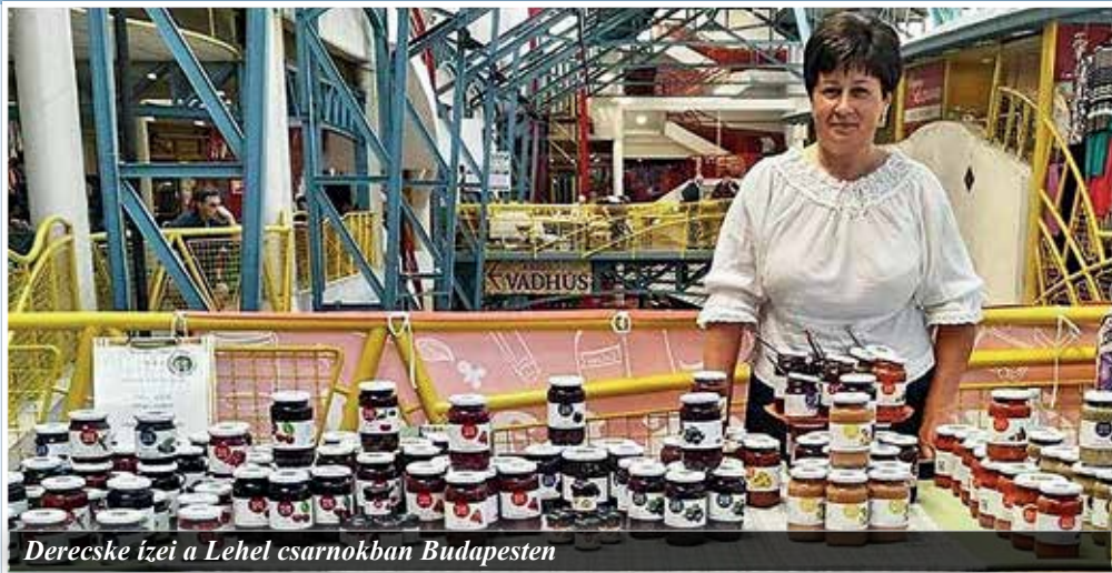
Derecskei Fenséges lekvárok a Lehel csarnokban Budapesten

Mint azt a házaspártól megtudtuk, az Év Terméke díj különlegessége, hogy nem pályázható, szakmai ajánlás alapján ítéli oda független zsűri. Kökénylekvárukat ízvilága, állaga, csomagolása és különböző receptekben való kipróbálása avatta az év termékévé. Számukra az elismerés egyúttal szakmai visszajelzés, a mögöttük álló évek munkájának dicsérete.