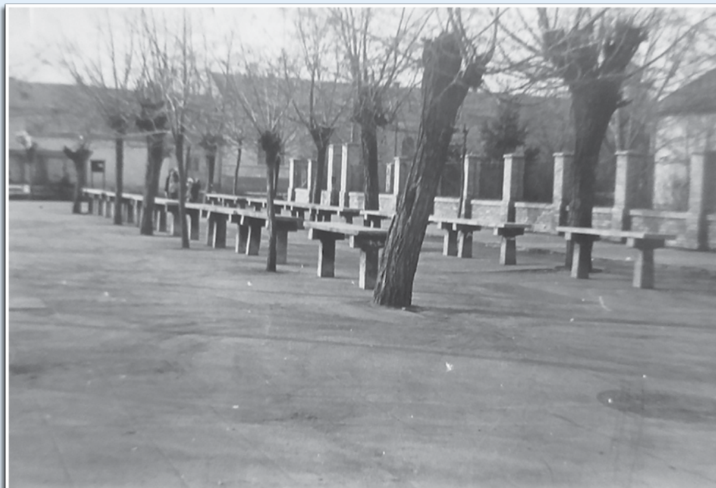
Piactér 1950-es években