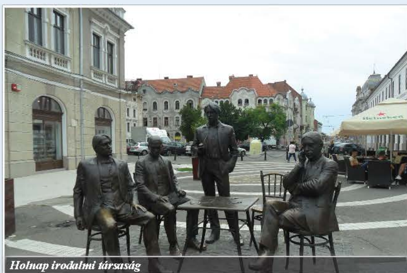
Holnap irodalmi társaság