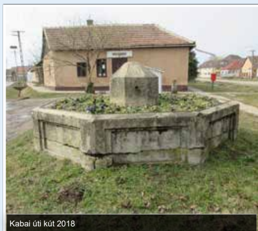
Kabai úti kút 2018