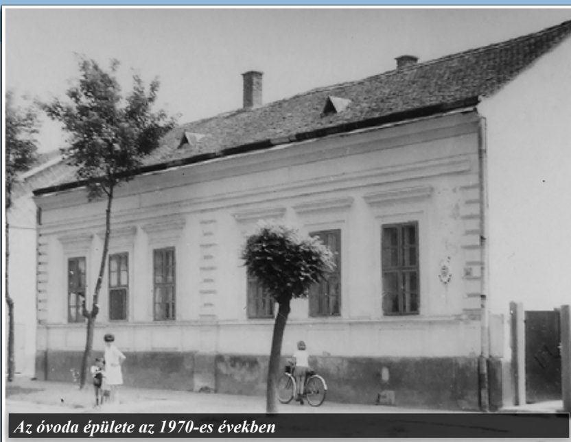
Az óvoda épülete az 1970-es években

Néhány évig lakatlan volt az épület, majd a derecskei helytörténeti gyűjtemény 2009 áprilisában nyert