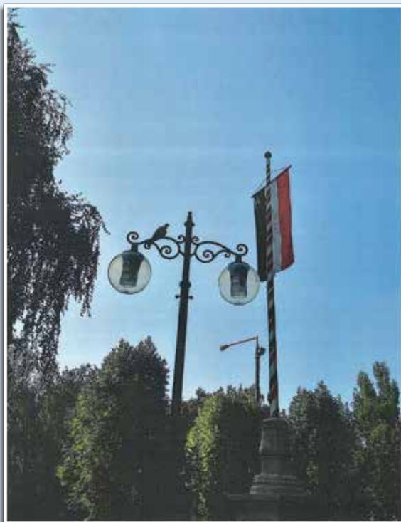
delmi és Iparkamara a „hónap kézműves remeke” cím elnyerése (Dante Étterem)

Köztéri munkái mellett számos egyéni megrendelés is teljesített, igényes ízlésvilággal, színes egyedi formákkal: Bold Agro irodaépület, a köztemetőben lévő zsűrizett sírkereszt, a Rákóczi út 2. sz. lakóház kerítése, Rákóczi út 23. sz. lakóház kerítése, Mátyás ki-