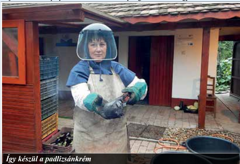
Így készül a padlizsánkrém