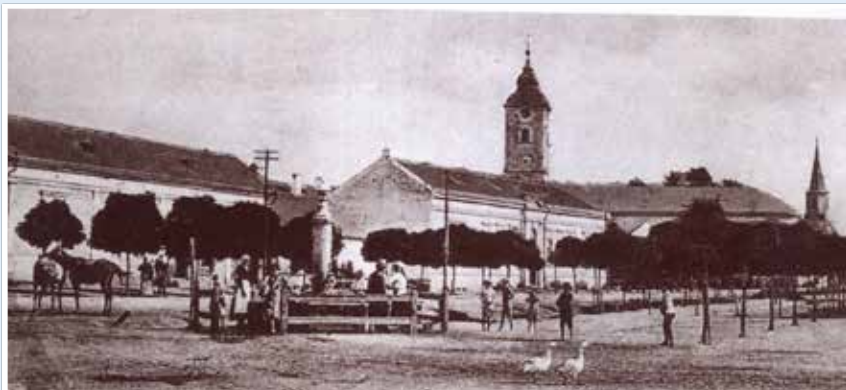
1867-ben a mészárszék helyén ártézi kút fúrat a községi tanács Derecske története képekben, Fénnyel írt történelem c. könyv 17 p. 2/2 kép. Szerző: Szöllősi Imréné - Rékasi Attila

A község megvásárolta és lebontotta a központot csúfító mészárszéket (az az üzlet, bolt, amelyben a mészáros a levágott állatok húsát méri, húsbolt), majd több éves előkészítés után 1867-ben a helyére ártézi kút fúratott, hogy végre iható vize legyen a lakosságnak. A kút 38 öl (72m) mélyre fúrták.