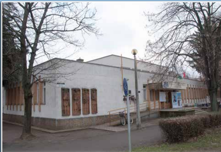
A művelődési központ épülete 2018-ban

Derecske kulturális életének, művelődésének alakításában nélkülözhetetlen szerepe van a művelődési központnak és a könyvtárnak. A társasélet és a közművelődés szervezeti keretei az 1870-80-as évektől kezdve alakultak ki. Különböző egyesületek, egyesületek jöttek létre, amelyeknek célja a műveltség előmozdítása volt - többek között a társalgás, a véleménycsere és az olvasás által. Az olvasási kultúra alakításában a különböző szervezetekhez tartozó könyvtáraknak – polgári olvasókör, gazdasági népiskola, népkönyvtár, gazdakör, szaktanítói könyvtár, iparos olvasókör – volt szerepük egészen a második világháborút követő évekig. Itt ismerte meg az újság- és folyóiratolvasás szokását a derecskei közönség.