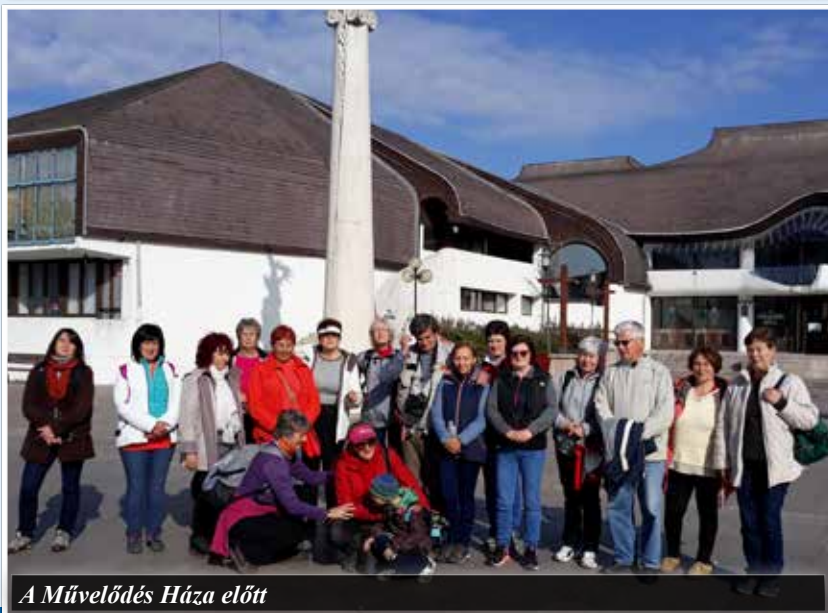
A Művelődés Háza előtt