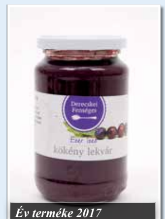
Év terméke 2017