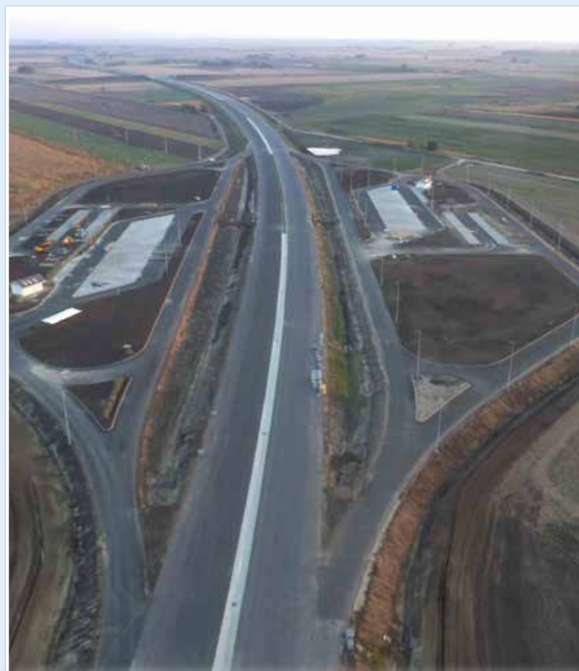
A derecskei pihenő: itt még félkész állapotban