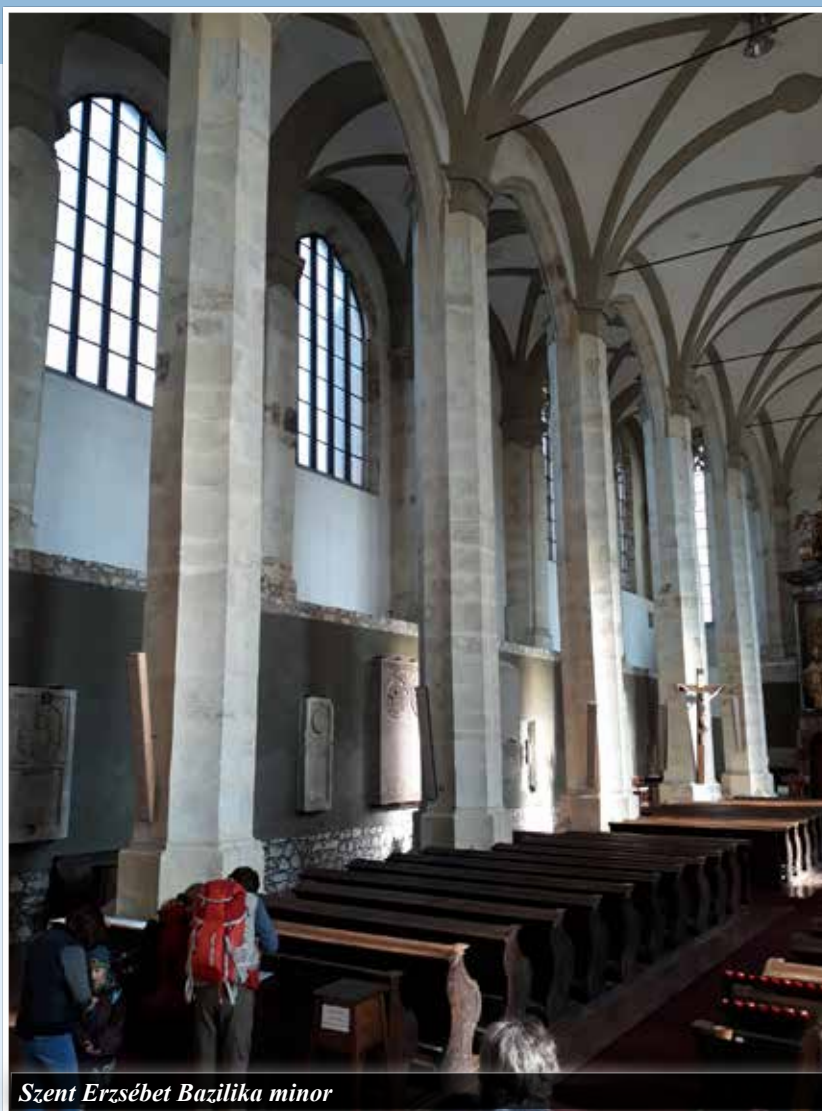
Szent Erzsébet Bazilika minor