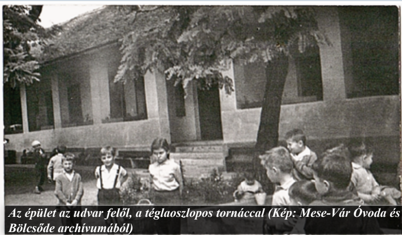
Az épület az udvar felől, a téglaoszlopos tornáccal

Ez az épület volt 1920-ig az első I. számú óvoda épülete. Ezután nyitották meg a II. számú (Kinizsi utcai) óvodát. 1969-ben az óvoda mellett új