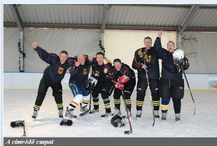
A címvédő csapat

Sajnos Derecskén nincs állandó jégfelület, ezért Berettyóújfaluban és Debrecenben tudjuk játszani ezt a gyönyörű sportot. A legfizikálisabb csapat-