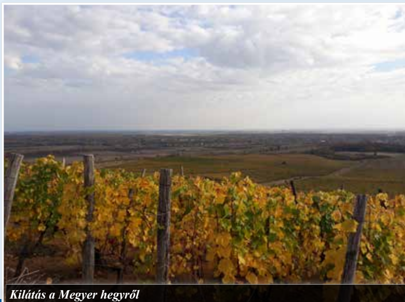
Kilátás a Megyer hegyről