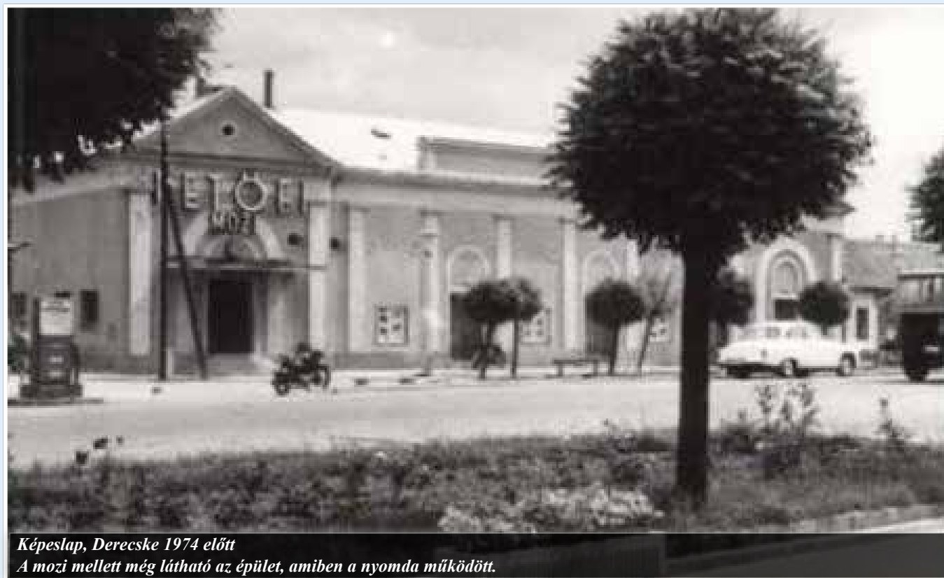
Képeslap, Derecske 1974 előtt A mozi mellett még látható az épület, amiben a nyomda működött.