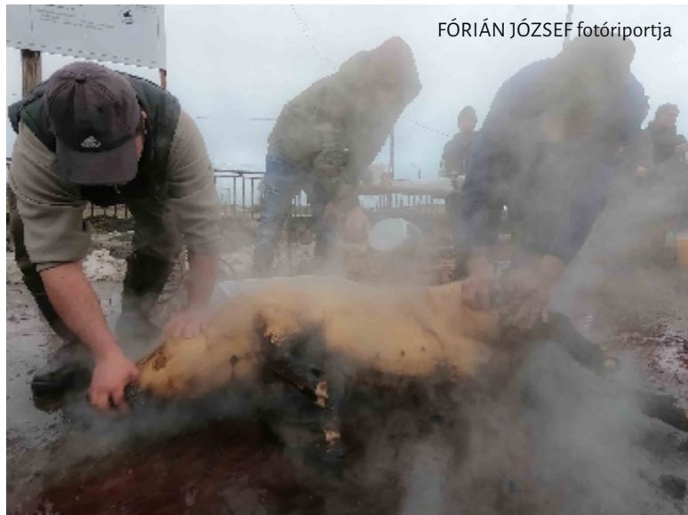
FÓRIÁN JÓZSEF fotóriportja