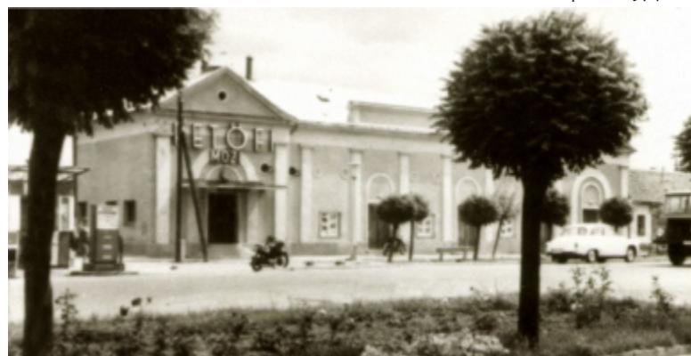
A Petőfi mozi 1974-ben

Az elkövetkező évtizedekben, a filmek és a filmszínházak mind népszerűbbé váltak a közönség körében, mindenki számára könnyen hozzáférhető szórakozás volt.