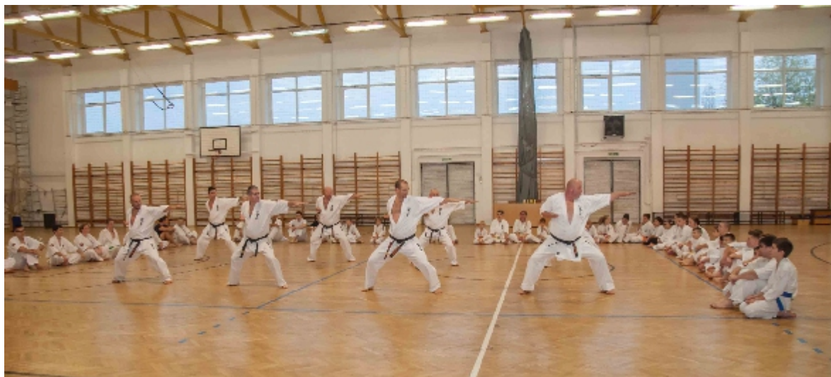
A fekete öves mesterek egy formagyakorlatokból álló csokrot mutattak be a közönségnek.

Megkezdte a felkészülést január 15-én a Derecskei LSE felnőtt labdarúgó csapata a Hajdú-Bihar megyei I. osztály 2018-2019-es bajnokságának tavaszi küzdelmeire.