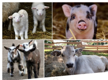
Kisállat simogató a Derecskei Disznótörban!

Mutassa be ön is kedvenc háziállatát 2019. február 2-án szombaton Derecske Főtéren!