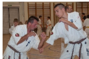
A páros küzdő jellegű gyakorlatok során már mindenki megizzadt kicsit, és a régi tagok is újra átérezhették, hogy milyen is volt anno karatézni.