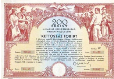
A harmadik Békekölcsön 200 forintos címlete 1952-ben

küzdött fel magát. A járás egész területén népnevelők szorosán összekötötték a munkájukat a szántás-vetés, a kukoricaszaporítás jelentőségének ismertetésével. A járás legjobb községe Esztár, utána Derecske következik. Derecskén a népnevelők Sztálin elvtárs nyilatkozatával indultak útnak, magukkal vitték a vasárnapi Szabad Népet, Néplapot s ezt házanként felolvasták. Ennek az agitációnak döntő része van abban, hogy több mint 50 forinttal megjavult a községben a jegyzés átlaga.”