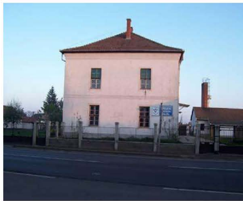
A volt Járásbírószág épülete

Derecskén a Járásbírószág épületénél volt a fogda. Ide zárták be a kulákokat. A régi bírósági és a fogda épületét (Köztársaság u. 67.) 2006-ban lebontották. Ma a Penny Market Áruház van a helyén.