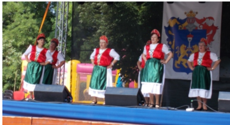
Derecskei város napi szereplés