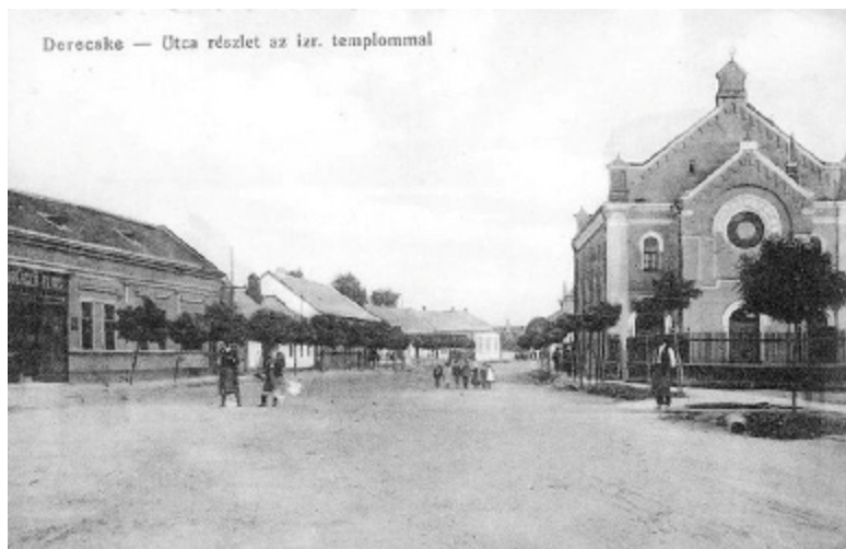
Képeslap Derecske 1915.