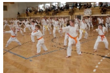
A megnyitó után kezdetét vette a közös mozgás. A bemelegítést a Kyokushin Karate alaptechnikái követték.