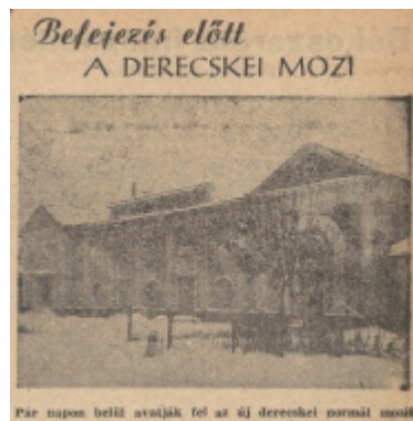
Hajdú-Bihari Napló 1958. január 9.

1957-ben felújításra került a mozi épülete. Először a községháza épületébe (ma Járási Hivatal) költözött, templomfelőli oldalán volt a nagyterem, itt vetítették a filmeket, majd a volt Gazdakör épületében üzemelt a mozi. A felújított mozi 1958 januárjában került felavatásra, amiről a megyei lap is tudósított.