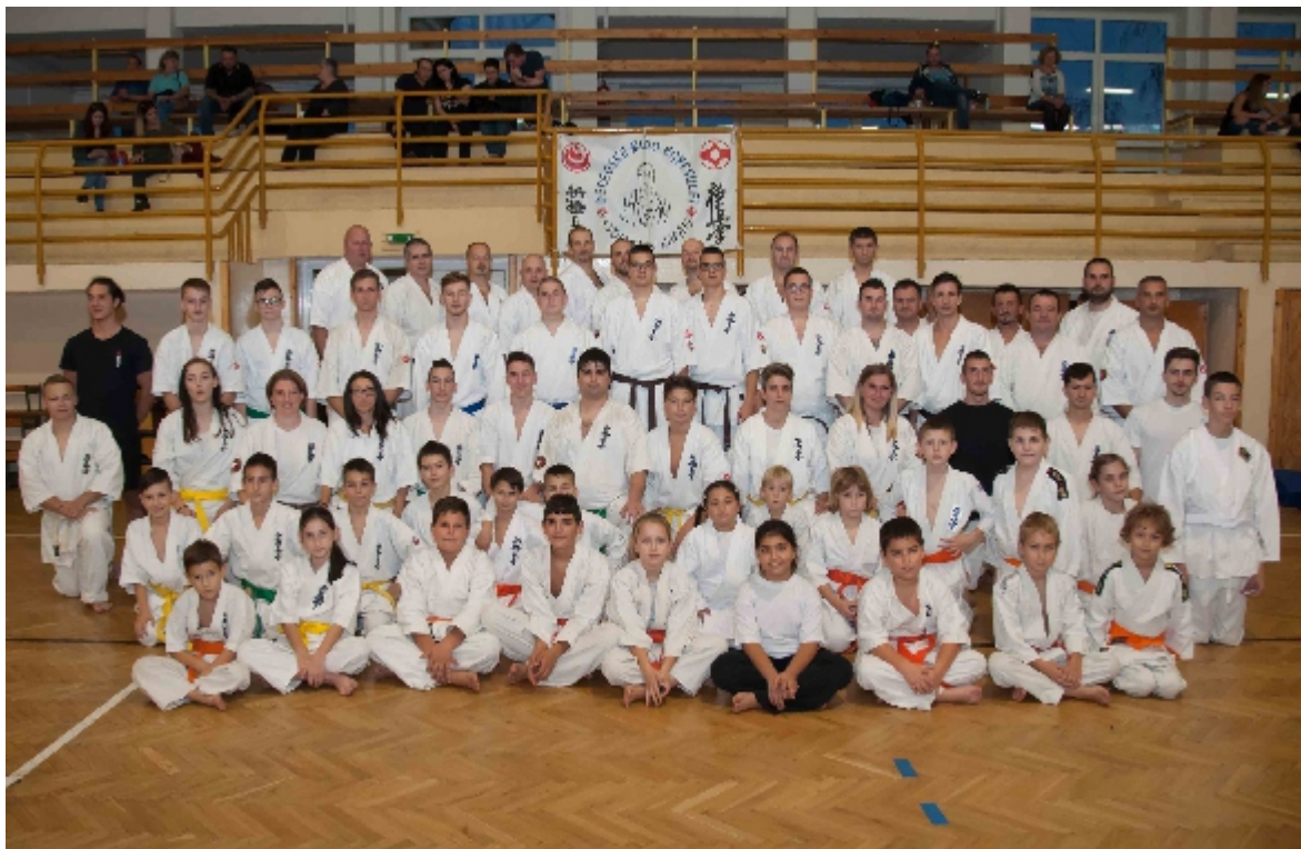
Az ünnepi rendezvény a Művelődési házban folytatódott vacsorával, programokkal és hajnalig tartó mulatsággal.