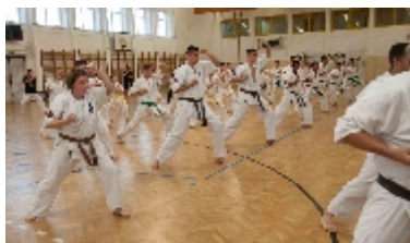
Az alaptechnikák után a jóval látványosabb formagyakorlatok következtek.