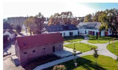
Magtár és a Szolgáltatóház