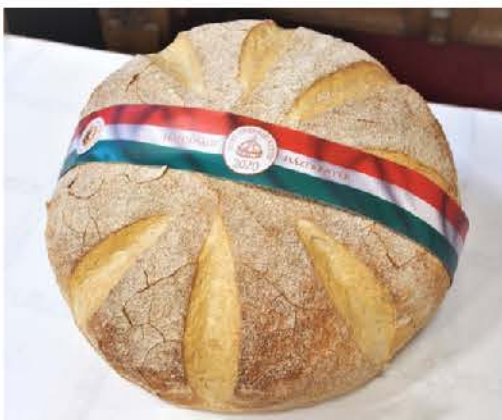
Az év kenyere 2020-ban

kovászt lisztrel megszórták, majd a kovászosító fát keresztbe tették, vászon abrosszal, szakajtó ruhával betakarták, hogy meg ne fájzon. Éjszakára pihenni hagyták. A letakart kovász megkelesztéséhez 6-7 óra kellett. Reggel korán már három órakor kezdték a munkát. Először a vizet meglangyosították,