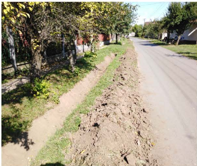
Pázmány Péter u. csapadékvíz elvezetés