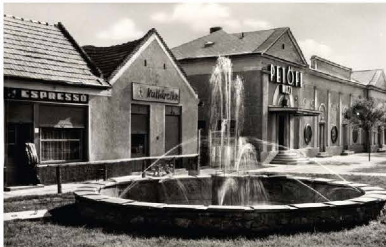
Derecskei főutca szökőkúttal és a Petőfi mozáival

Csupán néhány évig csodálhatta a közönség. 1967-ben a Művelődési Ház építésekora szökőkutat lebontották.