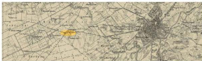
Aranyos csárda XIX. századi térképen (Harmadik katonai felmérés. 1869-1887)