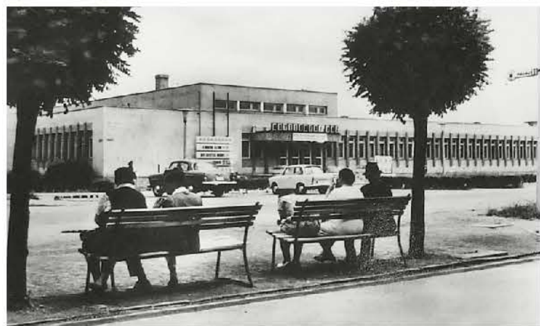
Művelődési Ház képe a 1969.