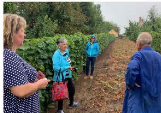
Munkában a zsűri

Köszönjük továbbá az ajándéksomagok összeállításához nyújtott segítséget az Alter-Center Kereskedőháznak és az Oázis Kertészetnek (Horváth Kertészeti Árudák Kft, Debrecen).