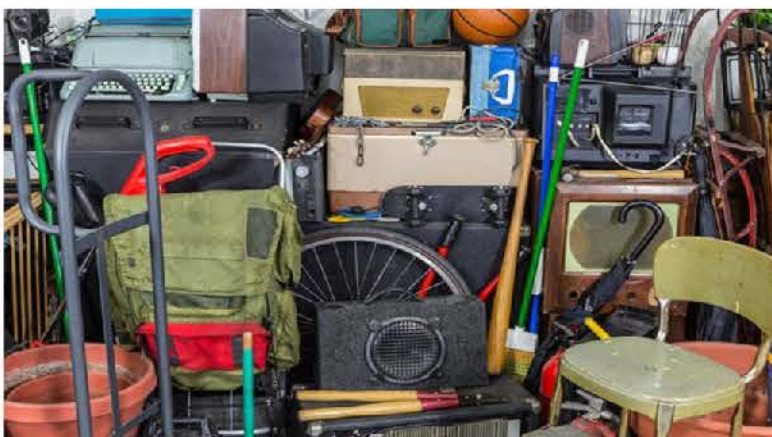
A fotó illusztráció

Tájékoztatam a Tisztelt Lakosságot, hogy a Bihari Hulladékgazdálkodási Nonprofit Kft. 2021. július 03-án (szombaton) délelőtt lomtalanítást végez.