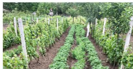
Szilágyi Lajos - Hajnalkert 5.