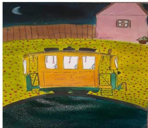
Tóth Janka 7. c