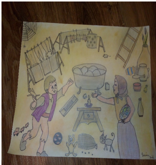
Kovács Zsófia 6. c