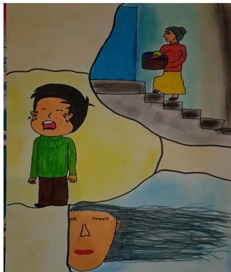
Fórián Dóra 7. a