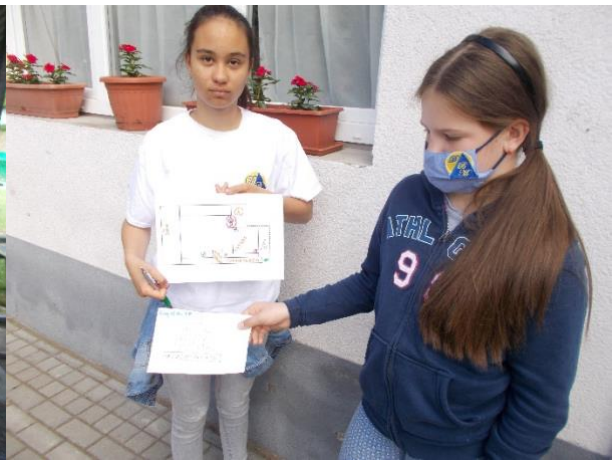
Az indulók bemutatása: