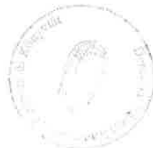
Nádházi-Tálás Csilla intézményvezető